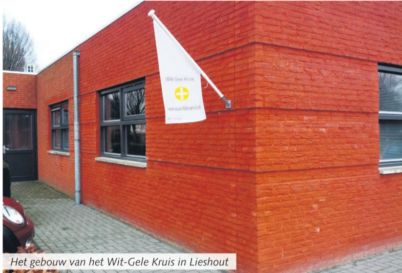
Het gebouw van het Wit-Gele Kruis in Lieshout

Het Zorg Advies Centrum van het Wit-Gele Kruis is te vinden aan de achterzijde van het Medisch Centrum aan de Grotenhof in Lieshout. Iedere dag van 10.00 tot 11.00 uur zijn medewerkers aanwezig en dat is ook te zien aan de vlag die dan buiten hangt. Iedereen kan altijd vrijblijvend binnen lopen. Ook kunt u de website www.wit-gelekruis.nl bezoeken. Hierop vindt informatie en een telefoonnummer voor dringende zaken.