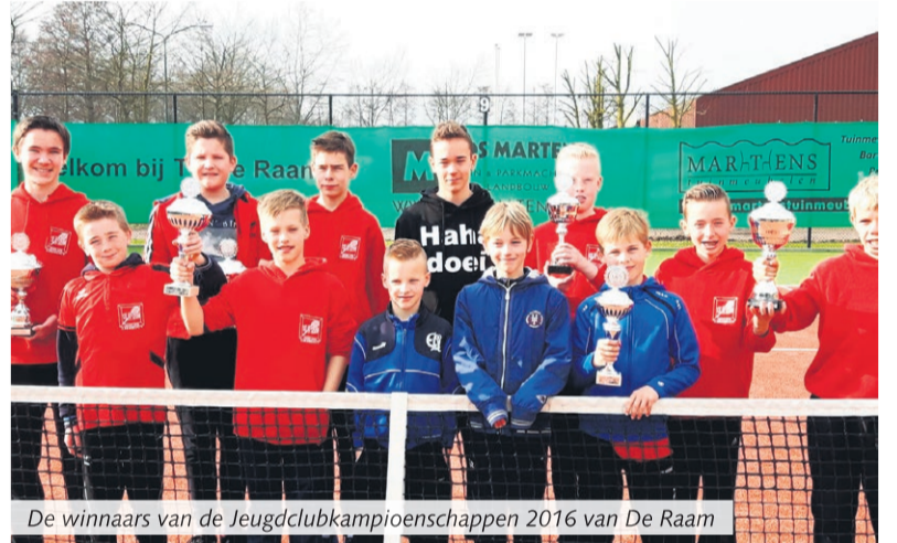
De winnaars van de Jeugdclubkampioenschappen 2016 van De Raam

Lieshout - De Jeugdclubkampioenschappen van TV De Raam vonden afgelopen weekend plaats. Onder een heerlijke vroege lentezon werden vrijdag en zaterdag de poulewedstrijden gespeeld. Op zondag mochten de finalisten strijden in de spannende finales om de titel.