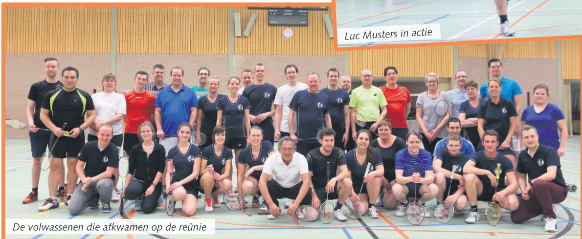
De volwassenen die afkwamen op de reünie