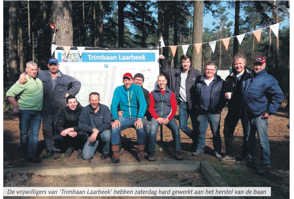
De vrijwilligers van 'Trimbaan Laarbeek' hebben zaterdag hard gewerkt aan het herstel van de baan

Mariahout - In het kader van NL Doet is afgelopen zaterdag door een aantal enthousiaste vrijwilligers een begin gemaakt aan het herstellen en opknappen van Trimbaan Laarbeek. Na de vernielingen van vorig jaar is er door de vrijwilligers hard gewerkt om nieuwe toestelborden en bewegwijzering te maken.