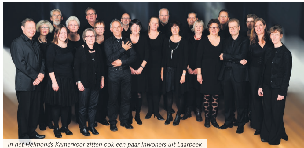
In het Helmonds Kamerkoor zitten ook een paar inwoners uit Laarbeek

Aarle-Rixtel - Het Helmonds Kamerkoor, waar ook Laarbeekse leden bijzitten, zingt dit jaar voor het achtste jaar passiemuziek op Witte Donderdag, Goede Vrijdag en Stille Zaterdag (24, 25 en 26 maart).