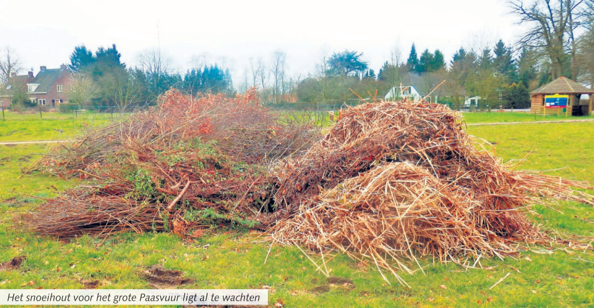
Het snoeihout voor het grote Paasvuur ligt al te wachten

Aarle-Rixtel - Op Eerste Paasdag, zondag 27 maart, houdt folkloregroep Dikkemik uit Aarle-Rixtel weer het jaarlijkse Paasfeest op Croy. Naast het Paaseieren zoeken en het grote Paasvuur wordt er ook weer een kleurwed-