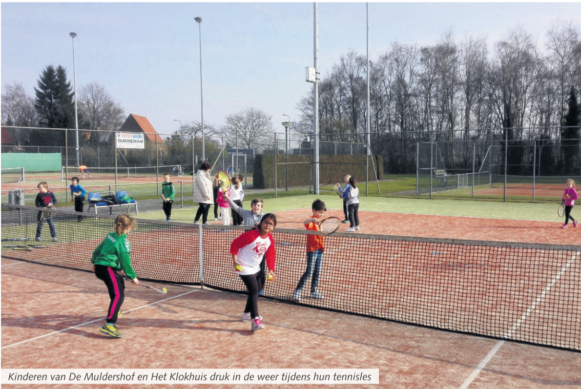
Kinderen van De Muldershof en Het Klokhuis druk in de weer tijdens hun tennisles

Beek en Donk - Meer dan 400 kinderen kregen in de afgelopen weken de kans om het schooltennisproject te volgen: 'Maak kennis met tennis'. Dit was speciaal voor de leerlingen van