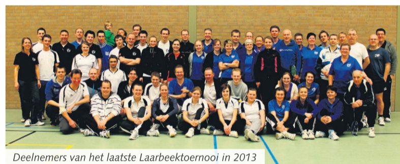
Deelnemers van het laatste Laarbeektoernooi in 2013

naast gewone wedstrijden ook andere spelelementen aan bod. Wat er precies gaat gebeuren blijft nog geheim, maar dat het hilarische momenten oplevert staat vast. Gezelligheid is dan ook het centrale woord bij dit toernooi. En die gezellige sfeer is er ook in de kantine. Daar wordt tussen de wedstrijden door een quiz gehouden voor de deelnemers. Dit om niet alleen fysiek maar ook mentaal bezig te zijn. De ervaring leert overigens dat badmintonners tijdens een quiz net zo fanatiek zijn als op de baan.