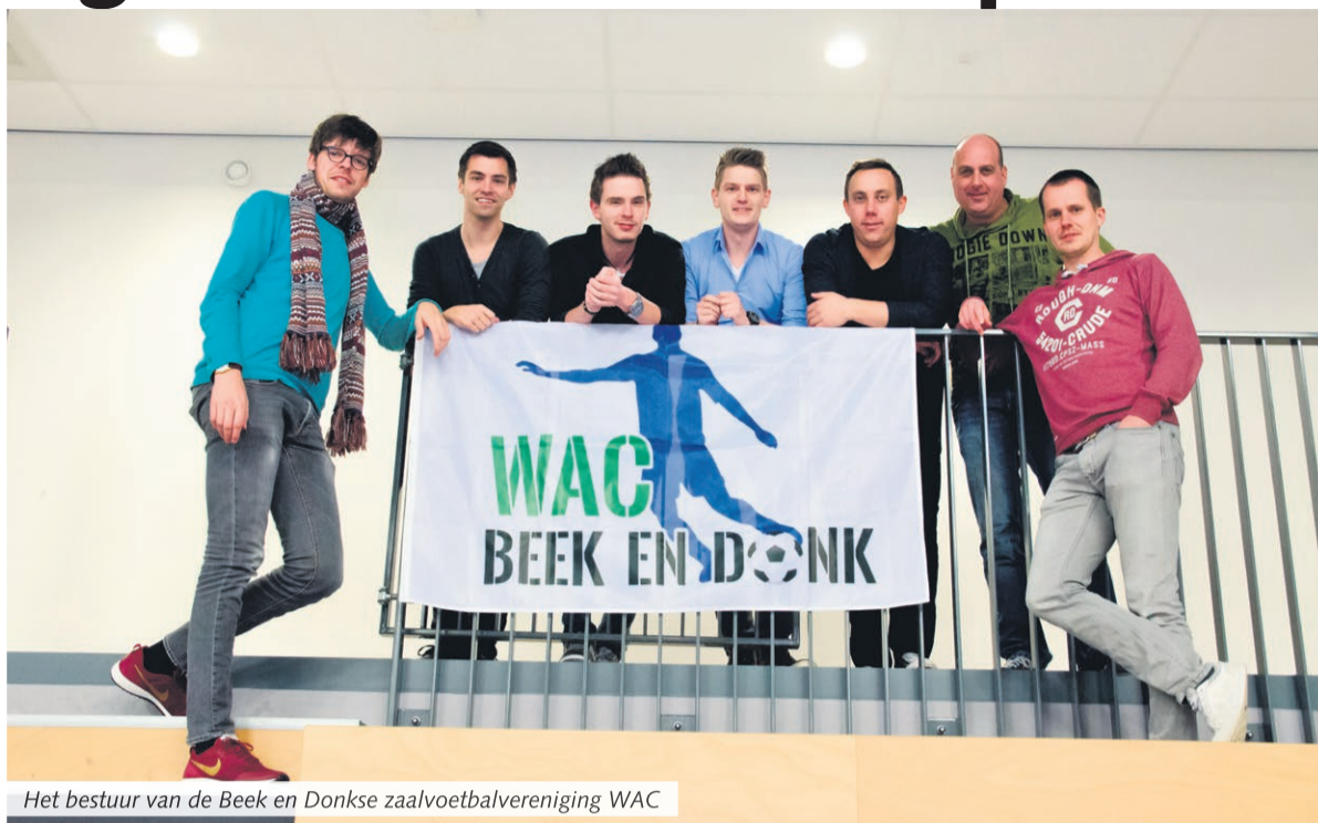
Het bestuur van de Beek en Donkse zaalvoetbalvereniging WAC

Vooraf die bezieling die zij hebben, willen ze uitstralen naar buiten toe. Dit willen zij graag overbrengen op de jeugd en ouderen, om in teamverband samen een potje te gaan voetballen en dan met name natuurlijk in den Ekker, op die donderdagavond. Na al een 'instuif' te hebben georganiseerd met carnaval, zitten ze vol met ideeën, om nog meer reclame te maken voor hun WAC. Zo zal er op het einde van deze competitie weer een instuif zijn en wil-