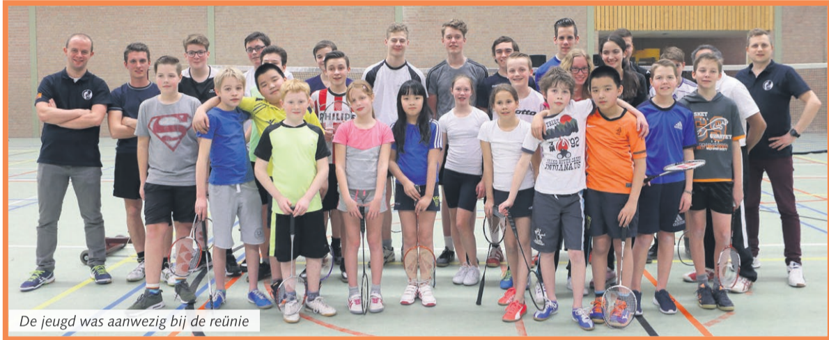
De jeugd was aanwezig bij de reünie

Redacteur: Martin Prick