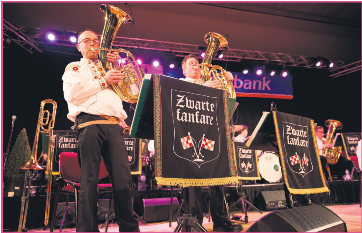
Redacteur: Martin Prick

Aarle-Rixtel - Blaaskapel 'De Zwarte Fanfare' viert het 40-jarig bestaan met een fantastisch spektakel op zaterdagavond 12 maart in 'De Dreef'.