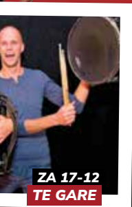
ZA 17-12 TE GARE