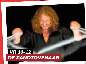
VR 16-12 DE ZANDTOENAAR