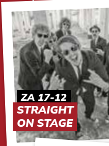
ZA 17-12 STRAIGHT ON STAGE