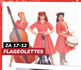
ZA 17-12 FLAGEOLETTES