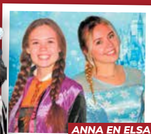
ANNA EN ELSA