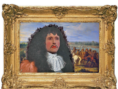
De Franse Zonnekoning Lodewijk XIV