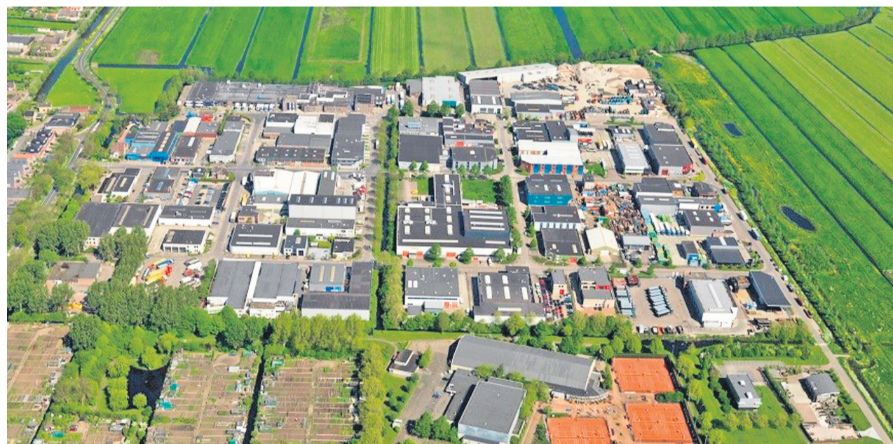
Oudewater kent een laag werkloosheidscijfer. Veel Oudewateraren werken op bedrijventerrein Tappersheul.

Verder doet Oudewater het goed op het gebied van werk en inkomen: de werkloosheid onder de beroepsbevolking bedraagt slechts 2,8%. Dat ligt een kwart lager dan in de rest van Nederland. Wie het volledige rapport wil lezen, kijkt op: https://gemeenteraad.oudewater.nl/stukken/raadsinformatiebrieven