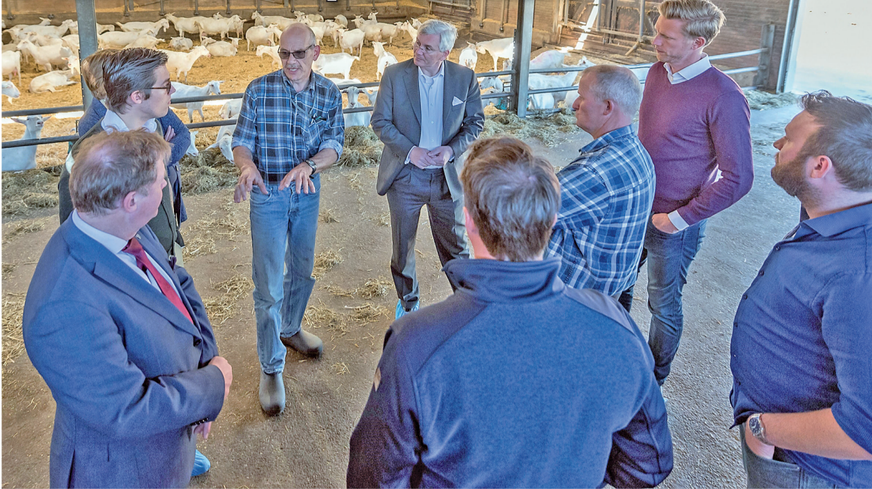
Zonde om ons mooie weidegebied verplicht vol te leggen met zonnepanelen, vinden de veehouders in de Lopikerwaard.