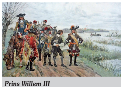
Prins Willem III

Daarom vinden we het belangrijk om het verhaal te vertellen. Wanneer je je verdiept in de geschiedenis van dit belangrijk verdedigingswerk, ontdek je dat veel gebouwen en vestingwerken, die onderdeel waren van de Oude Hollandse Waterlinie, nog deels in tact zijn, zoals het Kasteel in Woerden."