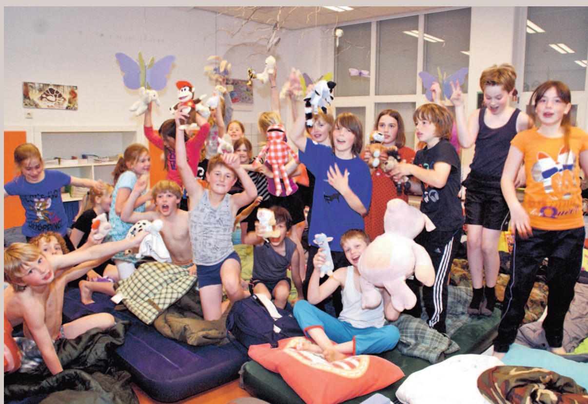
VORSTENBOSCH - Het slaapfeest van groep 5 tot en met 8 op basisschool 'Op Weg' in Vorstenbosch, ter gelegenheid van het 75-jarig bestaan, was geweldig!

DeMooiBernhezekrant feliciteert Bakkerij Lamers met het behalen van deze prachtige titel.