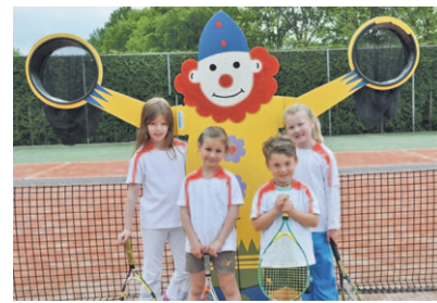
Het 'Rood' team