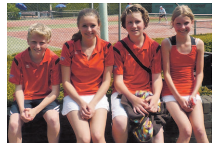
Gemengd t/m 17 jaar 1ste team