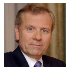
Keynote spreker Jaap de Hoop Scheffer