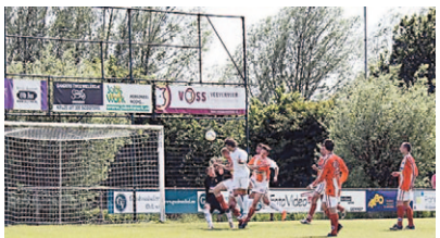
Tekst A.v. Lokven

NISTELRODE - Prinses Irene won de eerste confrontatie in de nacompetitie met 3-4 van Achates uit Ottersum. Het was broeierig warm in Ottersum.