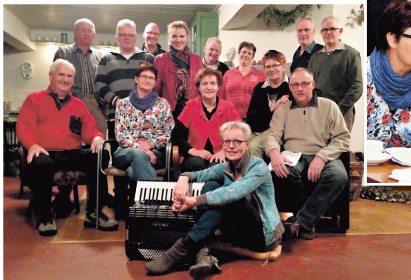
De spelersgroep van de revue