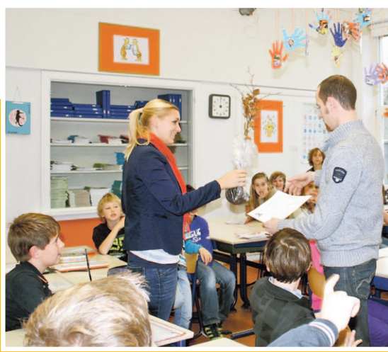
Kinderen van Basisschool Op Weg uit Vorstenbosch ontvangen een boompje

BERNHEZE - De boomfeestdag van de Gemeente Bernheze, kende in oktober en november een aantal activiteiten op de basisscholen rond het thema 'boom'. De kinderen kregen op school veel kennis over bomen. De soorten, hun nut, de natuurlijke omgeving en hoe te planten. Boomkwekerij Van den Broek uit Heeswijk-Dinther zorgde voor een waardige afsluiting. Elk kind kreeg een typische Nederlands boompje, een es of beuk, mee naar huis.