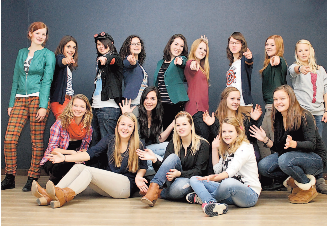
Tekst en foto: Hieke Stek

LOOSBROEK - Het decor is gebouwd. De kleding hangt klaar. De accessoires zijn verzameld. De dames van Young Voices zijn klaar voor 'Got Loose de musical' die ze 1 en 2 december gaan presenteren in De Blauwe Kei, Veghel. In 2011 debuteerde het jongerenkoor succesvol met een eigen versie van 'Mamma Mia' en met deze ervaring op zak, wordt Got Loose nóg beter, want Young Voices heeft volop ambities en leggen de lat steeds een stukje hoger.