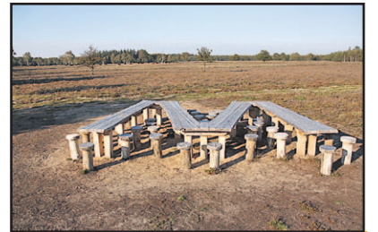
Mooi & in de streek