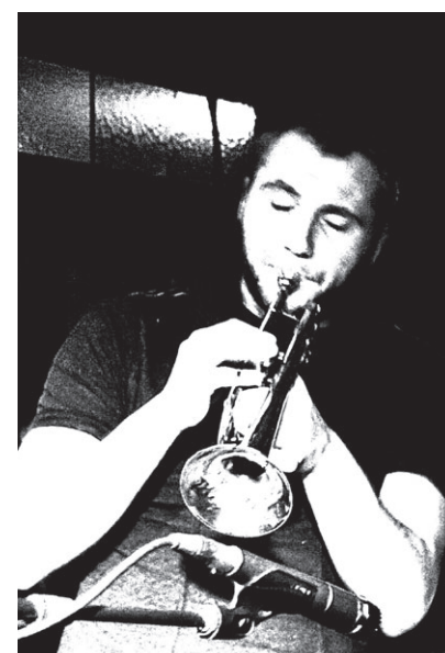
Zwanejam on tour

Zwanejam on tour Dit is een kindje van ZWANEJAM (jamsessie). 100% improvisatie! Zwanejam is een jamsessie die in Berlicum al een jaar of vijf loopt, elke eerste woensdag van de maand met gastmuzikant, laagdrempelig en voor iedereen toegankelijk. De vaste kern van de Zwanejam heeft enkele gastmuzikanten uitgezocht om ook op