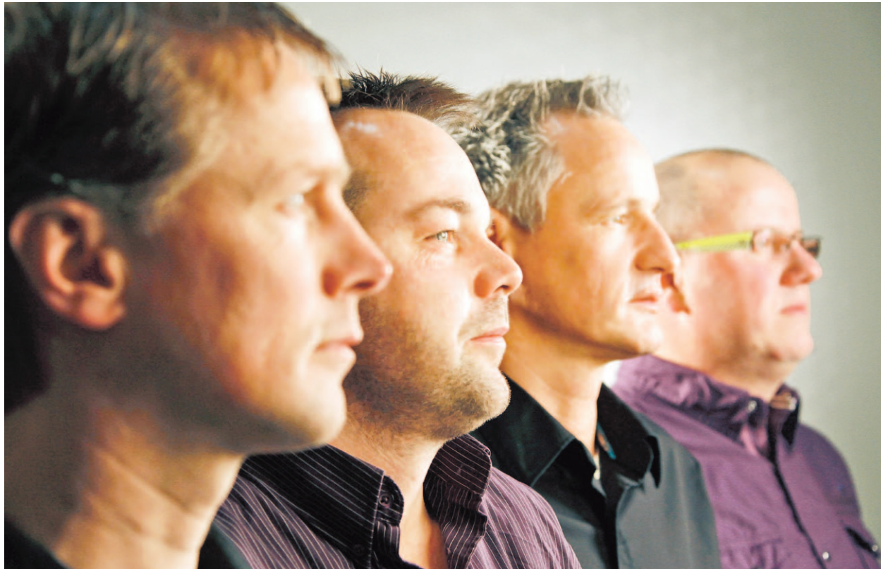
Tekst Hieke Stek

HEESWIJK-DINTHER - Het is best een stap om zelf muziek te componeren en liedteksten te schrijven. Er is lef voor nodig om dat ook nog eens op CD te zetten in eigen beheer. Maar DreamField kan bouwen op eerder succes: De CD Field of Dreams (2009). Trots presenteren ze aanstaande zaterdag 1 december hun nieuwe CD 'Lost' in Café de Toren in een avondvullend geheel eigen, muzikaal programma.