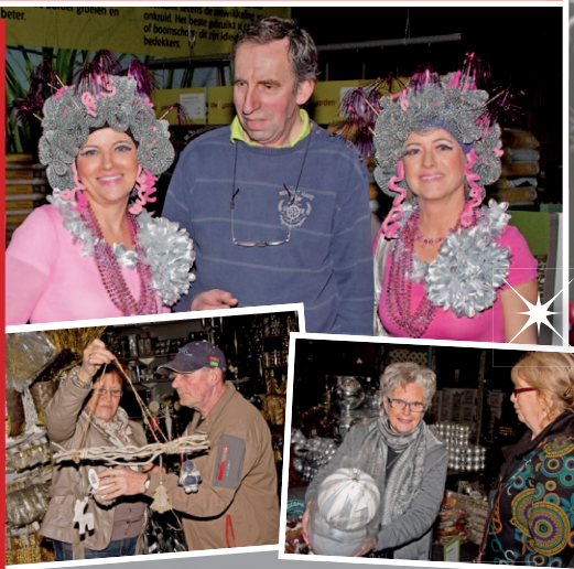
Enkele hoogtepunten van de Glamour Night