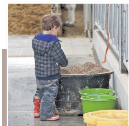
OPEN DAG WAAISTAP HD