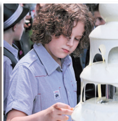
GALA 2012 NISTELRODE