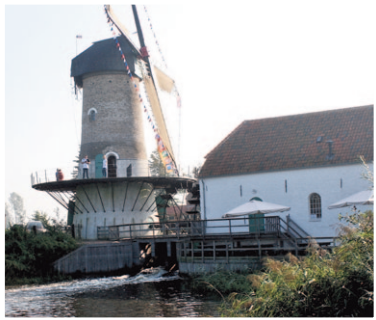
DE KILSDONKSE MOLEN