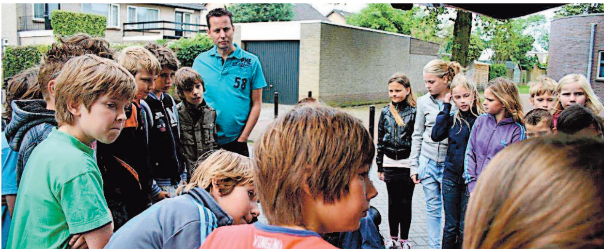
Tekst en foto: Esther van den Bogaart

"Wel allemaal naar de Paralympics kijken deze zomer!"