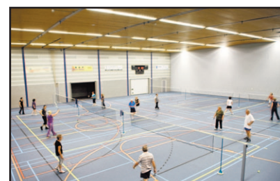
40 jaar badmintonclub