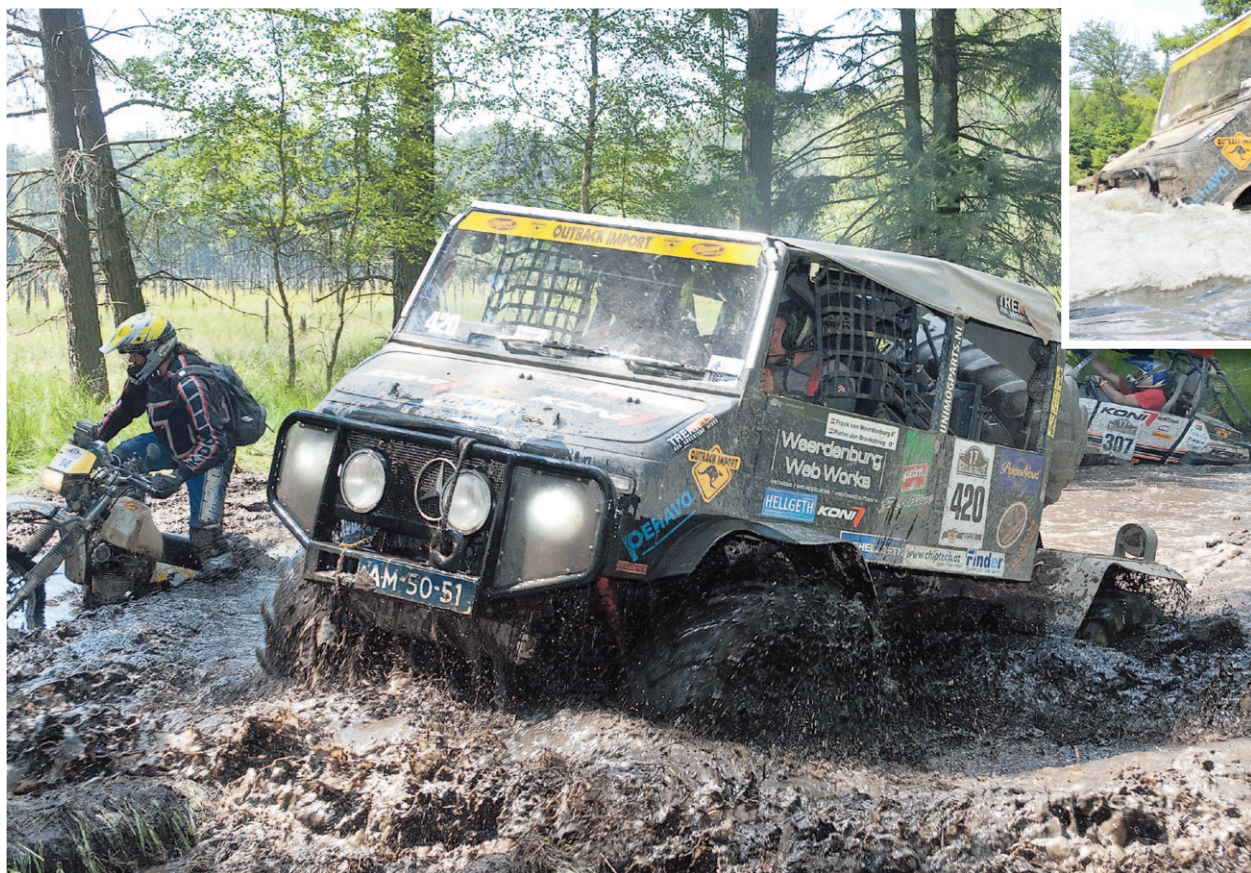
De proeven gaan over zandvlaktes en door moerassen