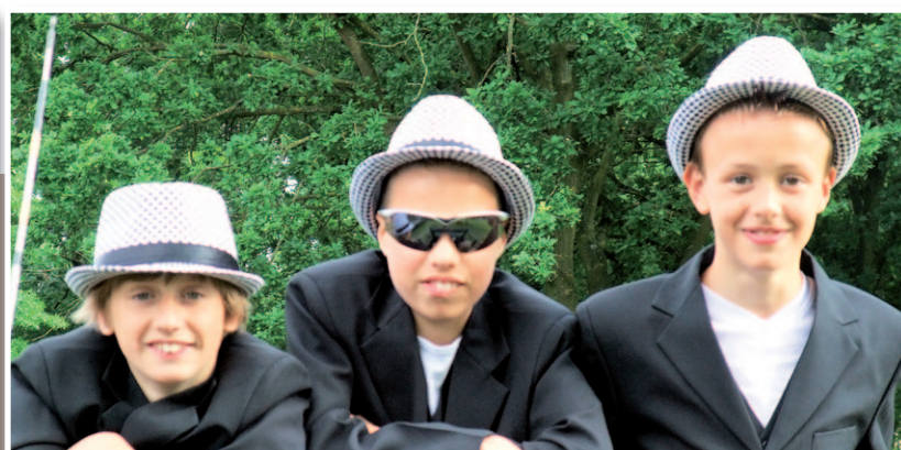
GALA 2012 NISTELRODE