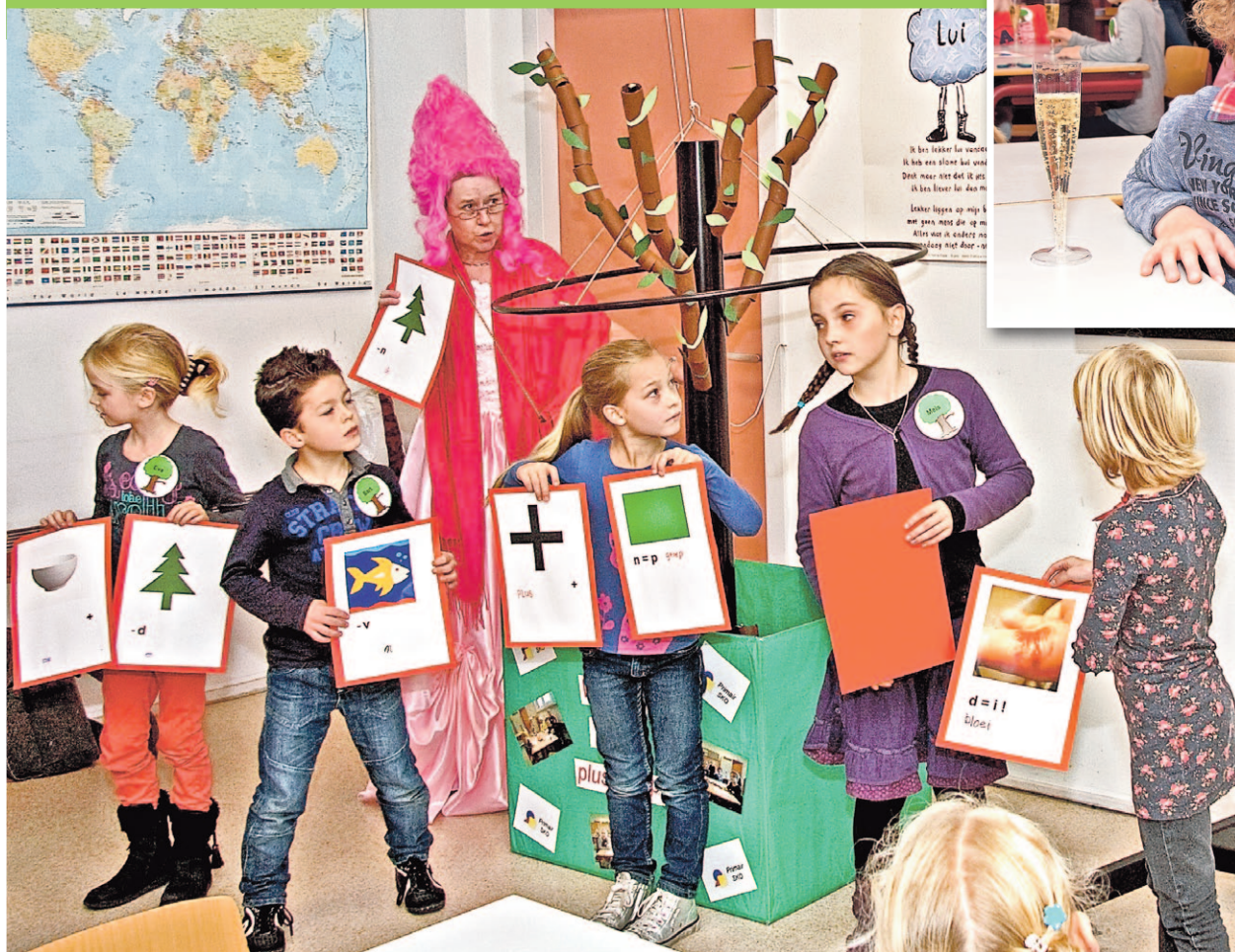
De woorden uit de opgeloste rebus vormden samen een zin