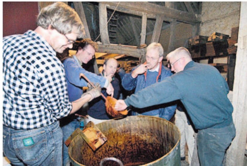
Een schone wijsvinger is belangrijk bij het proeven van de stroop

openluchtmuseum Eynderhoof en het stroop stoken. Na de pauze bekijken we een film van 20 minuten (Duitstalig) over stroop stoken. Aan het eind van de avond, kunnen we met een daarvoor geschikt stuk brood de stroop proeven. De lezing wordt gehouden in ons heemhuis Maxend 3 te Nistelrode. Niet-leden zijn ook van harte welkom; zij betalen € 2,50 incl. koffie of thee.