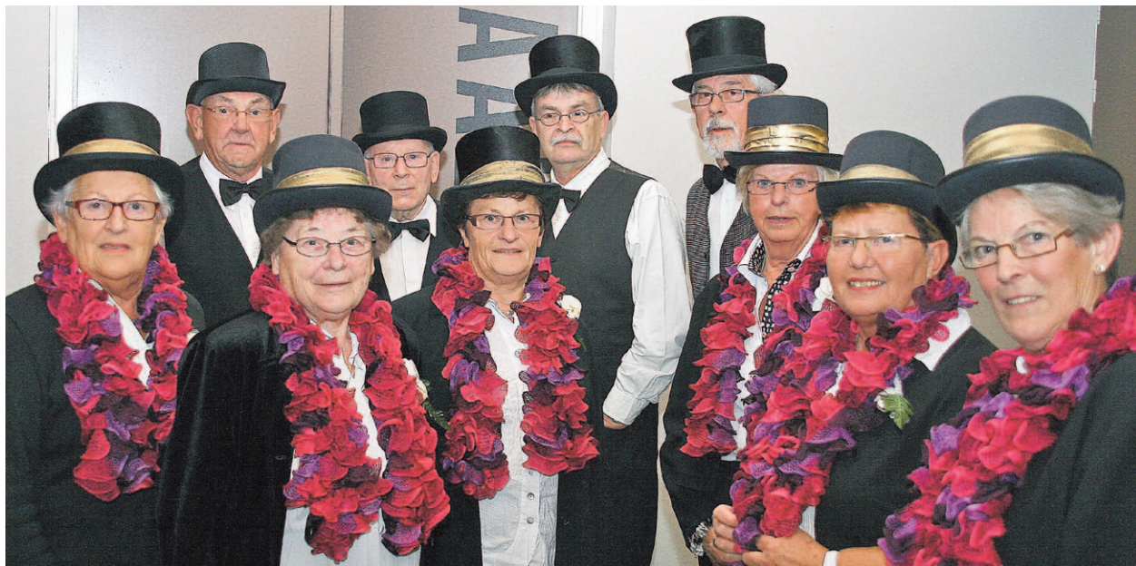
Cabaretgroep De Weverhōfkes staat er gekleurd op

Na 13 jaar plaats voor nieuwe 55+ talenten