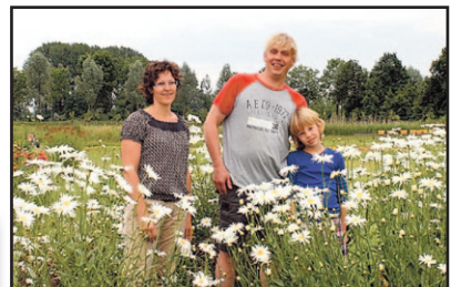
Op 't Erf