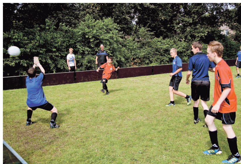
Het was een zeer geslaagde week

HEESCH - De eerste week van de vakantie is het wennen, schoolgaan hoeft niet en huiswerk evenmin. De voetbalweek georganiseerd door HVCH was dus een welkome activiteit. Liefst 165 jeugdige voetballers uit de klassen C, D en E meldden zich op het sportcomplex voor diverse op voetbal gebaseerde spelvormen zoals boarding-, kooi-, chaos-, honk- en pionvoetbal, afgewisseld met diverse trainingsvormen.