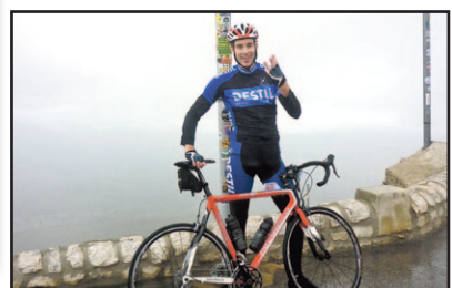
3x naar de top