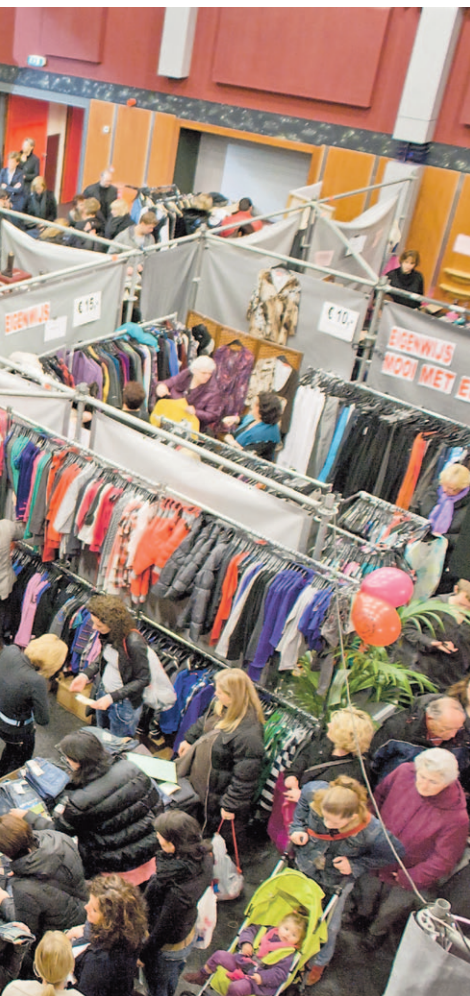
Outletbeurs 2011 was een groot succes

parkeermogelijkheden in de omgeving (let op de blauwe zone). De entree bedraagt € 2,- p.p. en kinderen tot 12 jaar mogen gratis naar binnen.