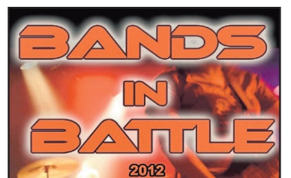
Bands in the Battle