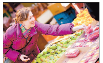
Mooi & op de Markt