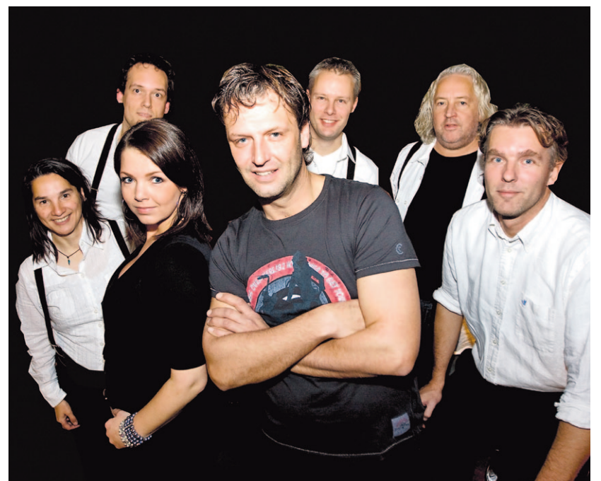
Feestband Giddy Limit

De officiële uitreiking start om 20.30 uur in de grote zaal. Dit is in een andere ruimte en op een later tijdstip dan in voorgaande jaren, zodat nog meer mensen in de gelegenheid zijn om hierbij aanwezig te zijn. Direct aansluitend zal rond