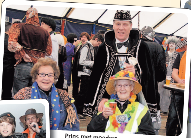
Prins met moeders