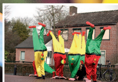
Heesch, pagina 14