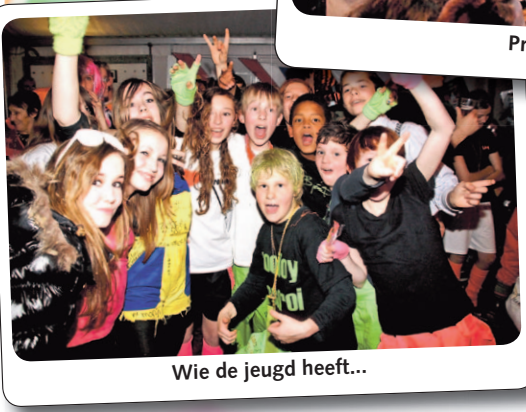
Wie de jeugd heeft...