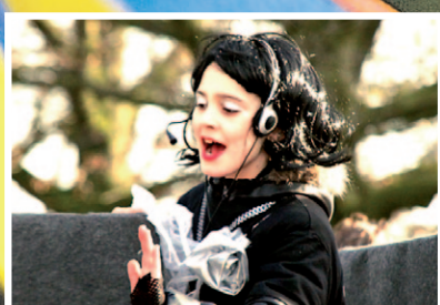
Vorstenbosch, pagina 12