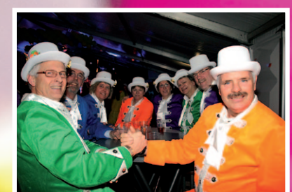
Nistelrode, pagina 18