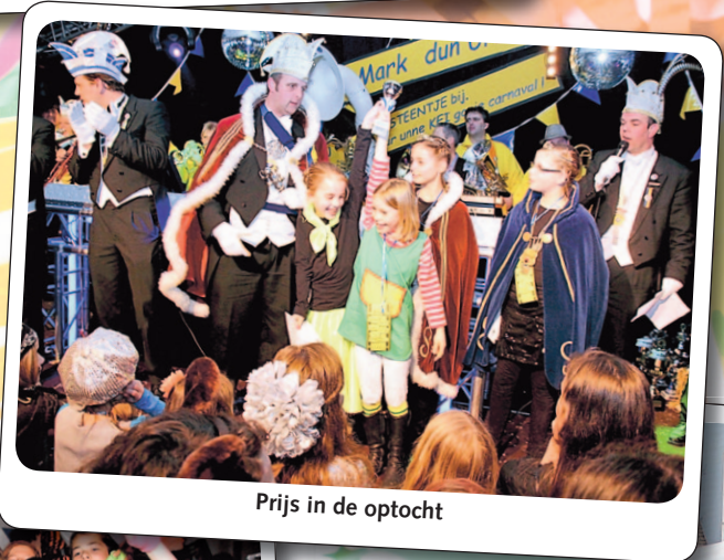
Prijs in de optocht