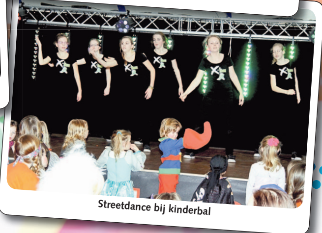
Streetdance bij kinderbal