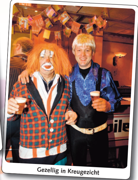
Gezellig in Kreugezicht