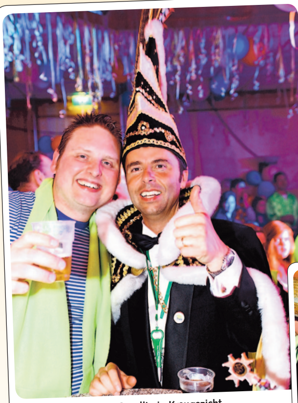
Gezellig in Kreugezicht