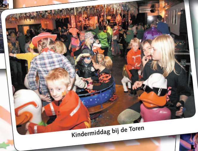
Kindermiddag bij de Toren