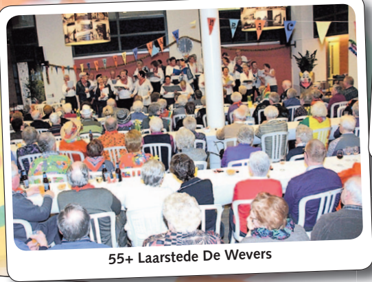
55+ Laarstede De Wevers