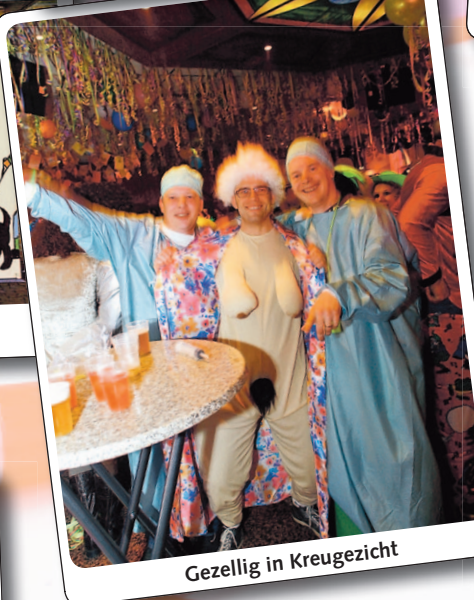
Gezellig in Kreugezicht