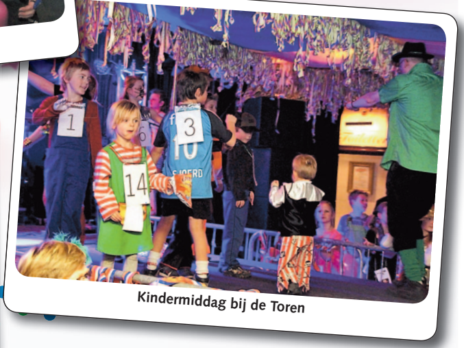
Kindermiddag bij de Toren