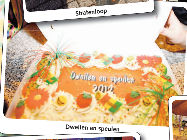
Dweilen en spelen