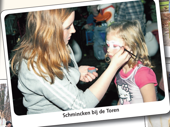
Schmincken bij de Toren