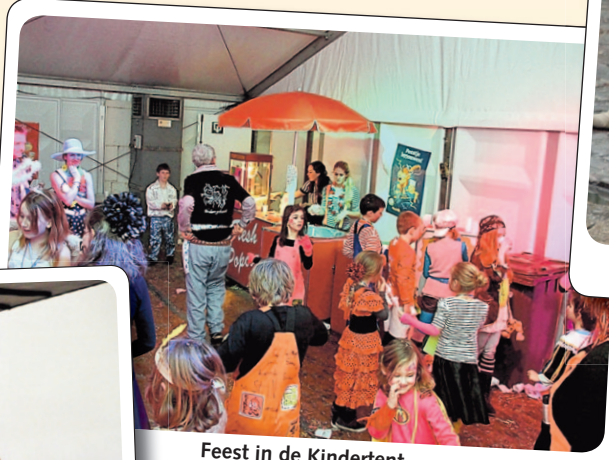
Feest in de Kindertent