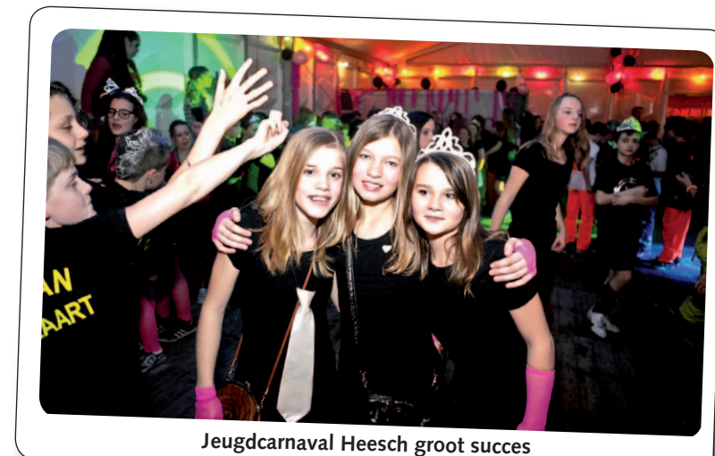
Jeugdcarnavaal Heesch groot succes

van 10.000 stuks en gaat het allerlaatste (gemeente) nieuws brengen van al de kerkdorpen die de gemeente rijk is. Behalve het laatste nieuws staat de krant ook boordevol interessante interviews en leuke columns. Alles geheel in de stijl van het DeMooiRooiKrant concept.