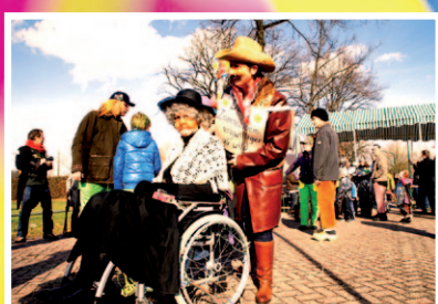
Loosbroek, pagina 11

De carnaval zit erop! Wanneer u deze krant in handen krijgt, heeft u vast de buik er van vol. De sleuteloverhandigingen, de versieringen, muziek overall wat anders te doen en alle mensen die 5 dagen gewerkt hebben en geen pap meer kunnen zeggen. Maar vandaag is het Afterparty, nog een keer met z'n allen haring happen, nog een keer proosten en heel hard meezingen met 'Mien waar is mijn feestneus' of 'nossa nossa assim voce me mata' of nog een keer de foto's kijken... Wij hebben een collage van Carnaval in Bernheze uitgezocht voor u. Of ga snel naar een van onze mooie sites, hebben we u ook gespot?