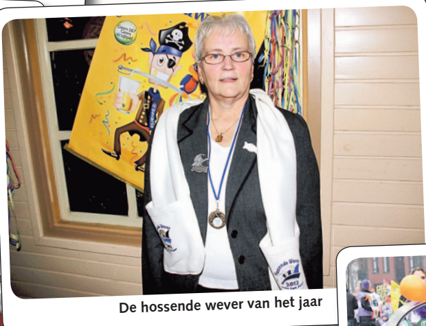
De hossende wever van het jaar