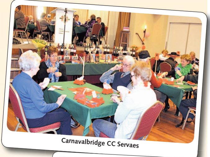
Carnavalbridge CC Servaes