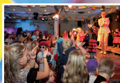
Heeswijk-Dinther, pagina 16