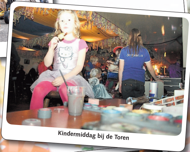
Kindermiddag bij de Toren