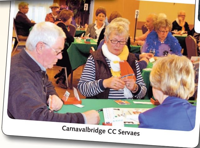
Carnavalbridge CC Servaes