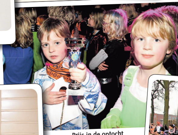
Prijs in de optocht