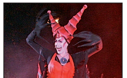
5 jaar MooiNisseroi.nl