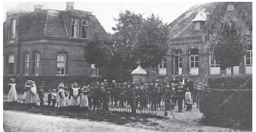
De jongensschool stond aan de Schoolstraat. De foto dateert van ±1900.

Het eerste deel is een boekje getiteld "Terugbladeren, beelden uit Dinther, Heeswijk en Loosbroek". Het bevat voornamelijk foto's, vaak in samenhang, waarbij in tekst een beknopte toelichting wordt gegeven.