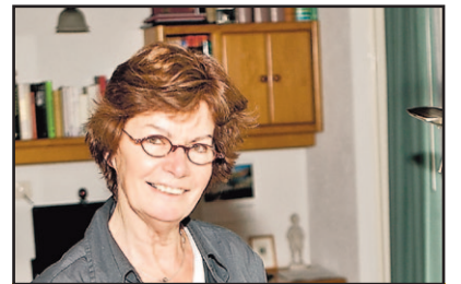
De koningin achterna

Je kunt je inschrijven tot 4 februari. Meer informatie over het carnavalsprogramma in Loosbroek is te vinden op www.dekreuge.nl