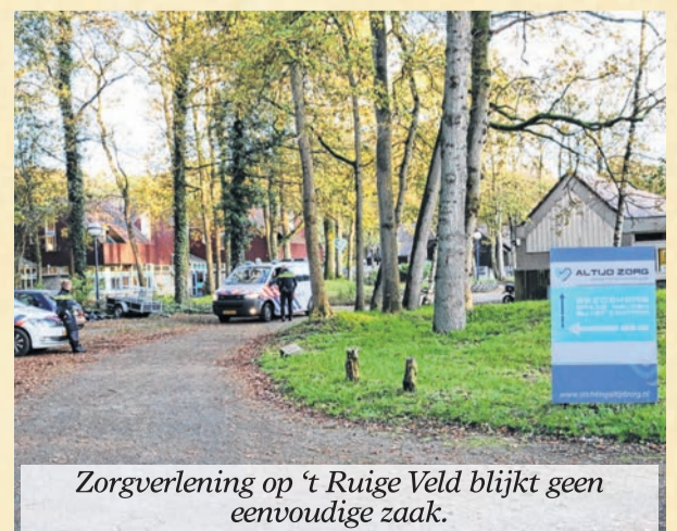
Zorgverlening op 't Ruige Veld blijkt geen eenvoudige zaak.