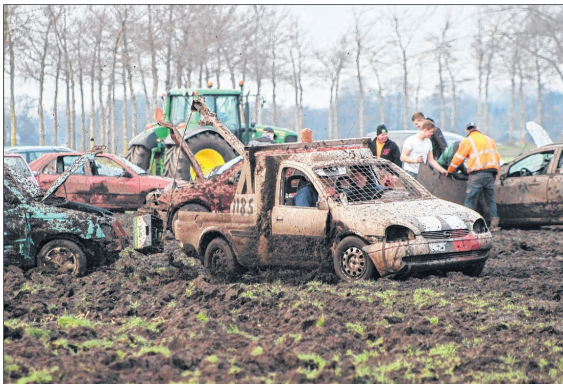
■ Keet Knuppelparadijs uit Eext viert met oude crossauto's een alternatief oudjaarsfeest bij Balloo.

Op de akker wordt een nieuw element aan het crossen toegevoegd. Eerst werd met een touw nog een leeg krat bier achter de auto voogetrokken. Het krat wordt vervangen door een kofferdeksel waar iemand op gaat zitten. De auto komt eerst moeilijk opgang in de modder om vervolgens toch flink gas te geven. De modder spuit alle kanten op. „Mud sliding of zo iets”, roepen de toeschouwers aan de kant, die volop van het schouwspel genieten. Een crossauto komt van het veld rijden en de coureur trapt laat op de rem, waardoor hij eens stilstaande crossauto niet meer kan ontwijken. Hij geeft nog eens extra gas, waardoor de auto's door de rookwolken niet meer te zien zijn. Oldersma kijkt genietend toe. „Het is een leuk alternatief, maar het echte oud-en-nieuwgevoel ontbreekt. Het is toch anders. En vanavond zal het ook