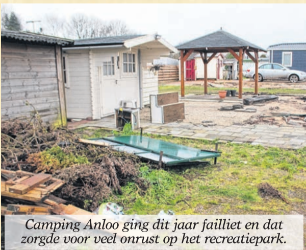
Camping Anloo ging dit jaar failliet en dat zorgde voor veel onrust op het recreatiepark.