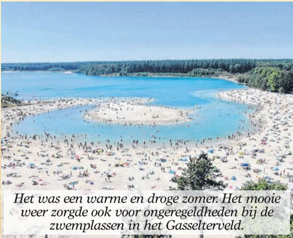
Het was een warme en droge zomer. Het mooie weer zorgde ook voor ongeregelheden bij de zwemplassen in het Gasselterveld.