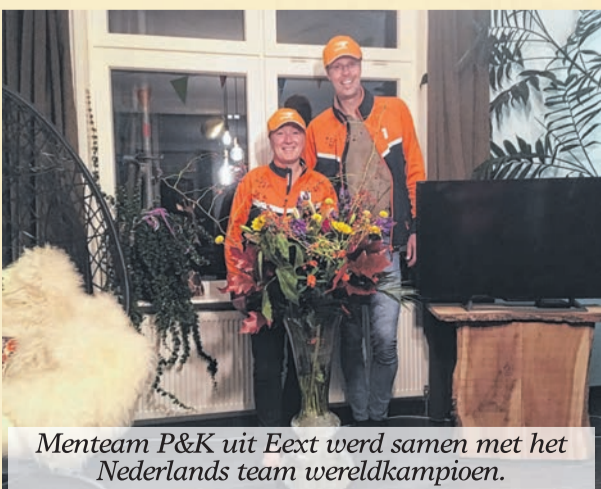
Menteam P&K uit Eext werd samen met het Nederlands team wereldkampioen.