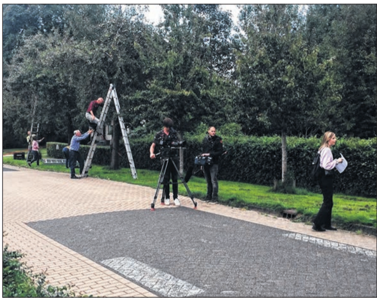
■ De cameraploeg van het tv-programma Het Dorp filmt de perenpluk in Gasselternijveen.

PAPENVOORT - Een bedrijfsbusje is bij Papenvoort op zondagmiddag in brand gevlogen. Het busje reed op het Oostereind richting Grolloo. Tijdens het rijden kwamen er rook en vlammen onder het dashboard vandaan. De inzittenden konden op tijd uit het busje komen en konden nog wat persoonlijke bezittingen veiligstellen. De brandweer van Borger heeft het busje geblust. Berger Hams-tra uit Tynaarlo heeft het voertuig opgehaald.