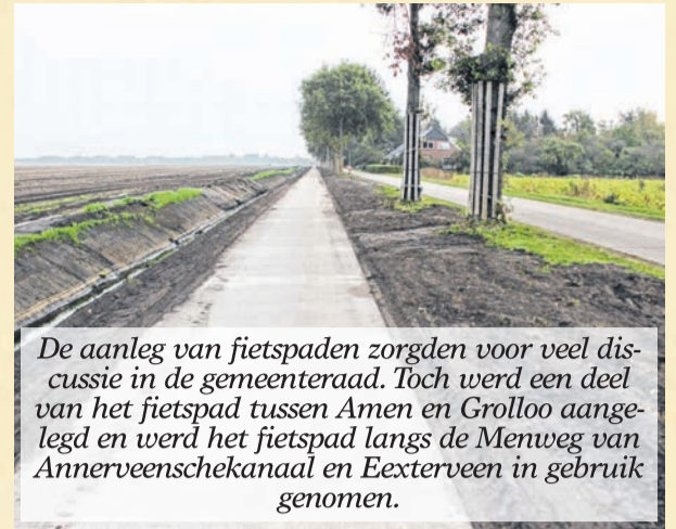
De aanleg van fietspaden zorgden voor veel discussie in de gemeenteraad. Toch werd een deel van het fietspad tussen Amen en Grolloo aangelegd en werd het fietspad langs de Menweg van Annerveenschekanaal en Eexterveen in gebruik genomen.