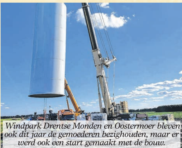
Windpark Drentse Monden en Oostermoer bleven ook dit jaar de gemoederen bezighouden, maar er werd ook een start gemaakt met de bouw.