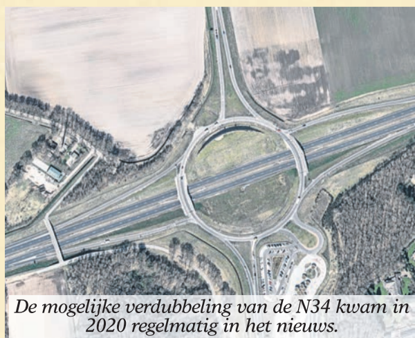
De mogelijke verdubbeling van de N34 kwam in 2020 regelmatig in het nieuws.