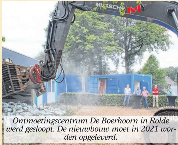
Ontmoetingscentrum De Boerhoorn in Rolde werd gesloopt. De nieuwbouw moet in 2021 worden opgeleverd.