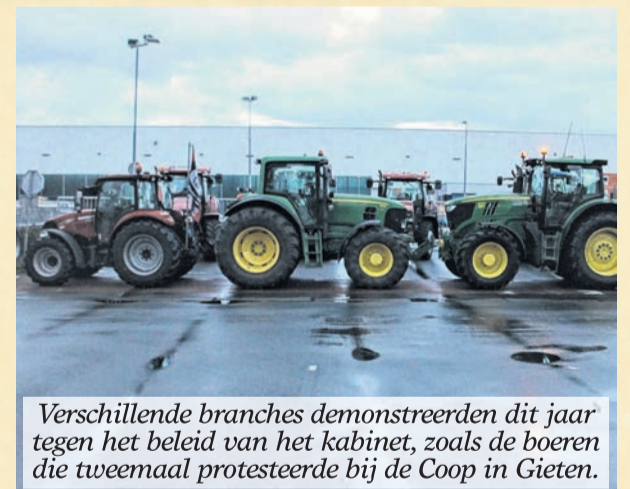
Verschillende branches demonstreerden dit jaar tegen het beleid van het kabinet, zoals de boeren die tweemaal protesteerde bij de Coop in Gieten.