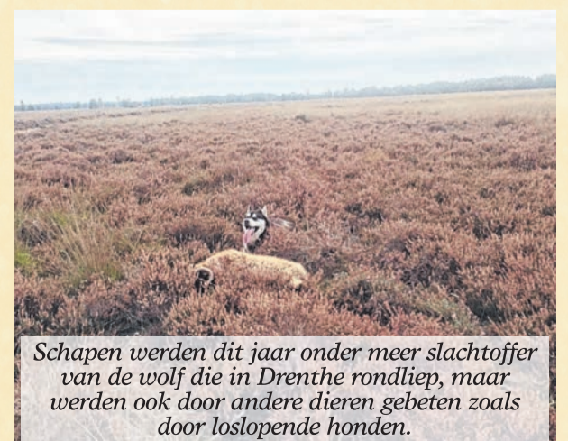
Schapen werden dit jaar onder meer slachtoffer van de wolf die in Drenthe rondliep, maar werden ook door andere dieren gebeten zoals door loslopende honden.