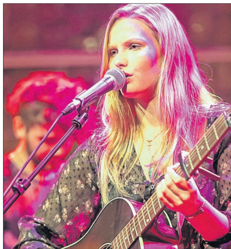
Singer-songwriter is een van de talenten die gebruik maakt van de Popvoucher.

MIDDEN-DRENTHE - De gemeente Midden-Drenthe vergadert weer in de raadzaal. In de afgelopen periode werd er vanwege het coronavirus digitaal vergaderd. Nu de maatregelen versoepeld zijn, kiest de gemeente ervoor om weer fysiek bij elkaar te komen. De eerste keer gebeurde dat op dinsdag 9 juni, toen de commissie Zorg en Welzijn vergaderde. Uiteraard is met de opstelling van de raadzaal rekening gehouden met de 1,5 meter regels. Inwoners kunnen de vergaderingen nog niet in de raadzaal volgen. Zij moeten het nog doen met de livestream op www.middendrenthe.nl .