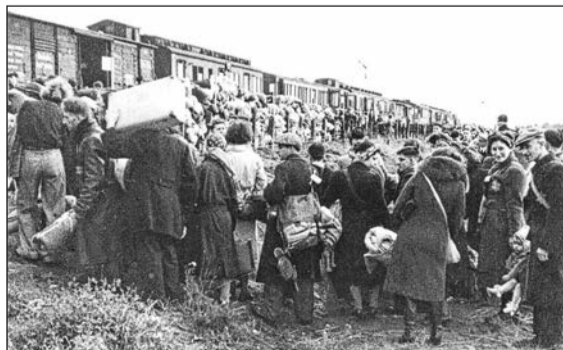
De foto van de deportatie van joden uit Kamp Westerbork.