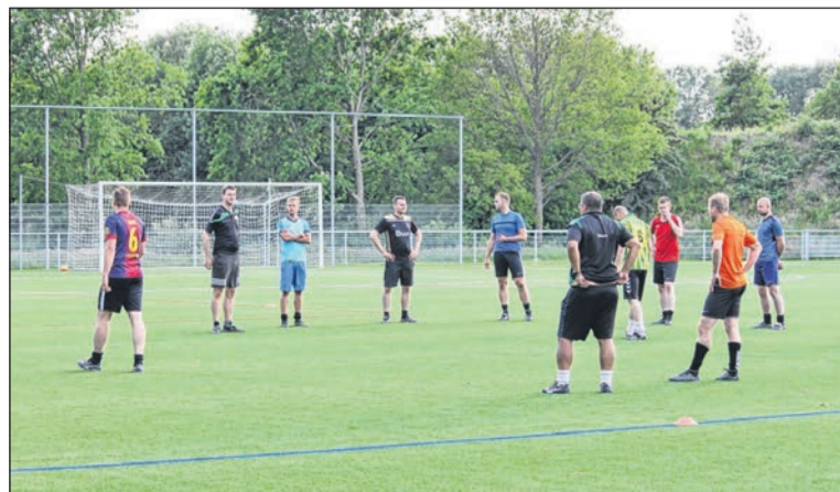
Een deel van de nieuwe selectie van FIT Boys krijgt instructies.