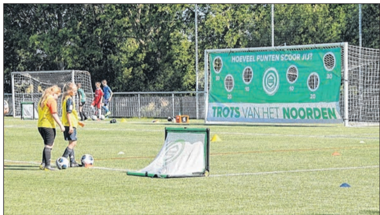
Jonge voetballers maken zich op voor het oefeningencircuit.

WESTERBORK - Landgoed Börkerheide in Westerbork heeft het voorzieningsniveau opgewaardeerd. Er is stabiel internet aangelegd, waarvan alle campinggasten gebruik kunnen maken. De capaciteit is voldoende om niet alleen e-mails te checken, maar het is bijvoorbeeld ook mogelijk om Netflix te streamen. Om overal op de camping goed bereik te hebben, zijn zes Wifi-accespoints met een hoge capaciteit geplaatst. Waar mogelijk is aangesloten op de glasvezelbekabeling, waardoor het geheel volgens de camping 'super stabiel' is. Hierdoor kunnen de campinggasten niet alleen genieten van de rust, maar ook contact houden met de buitenwereld.