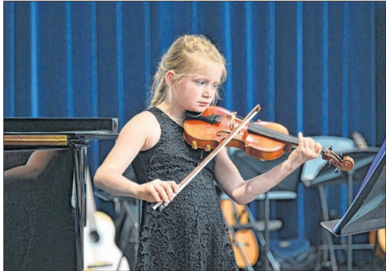
Een van de leerlingen van Klankrijk Drenthe in actie.

De livestream op YouTube (kanaal: Klankrijk Drenthe) is ook te vinden via de Facebookpagina en via de website www.klankrijkdrenthe.nl .