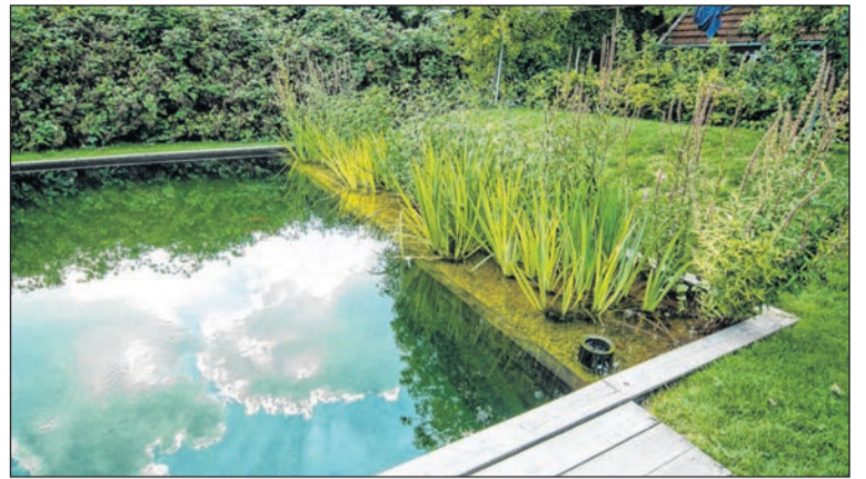
De subsidie van WDODelta op 'minder tegels, meer groen' is op.