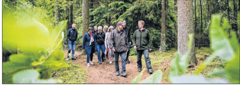
Staatsbosbeheer zoekt nieuwe vrijwilligers voor de boswachterij Emmen-Sleen.

De boswachterij ligt voor het grootste gedeelte op de Drentse