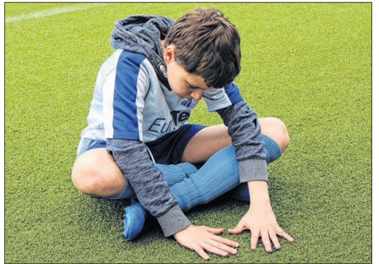
De gemeente Midden-Drenthe wil meer en betere jeugdhulp.

DOS traint elke woensdag van 18.00 tot 19.00 uur op de atletiekbaan aan de Westeinde 1A in Dwingelo. Vanaf 5 jaar mogen kinderen meedoen. Wie 12 jaar of ouder is, traint van 19.00 tot 20.00 uur. Voor informatie kan men e-mailen naar atletiektrainer@outlook.com .