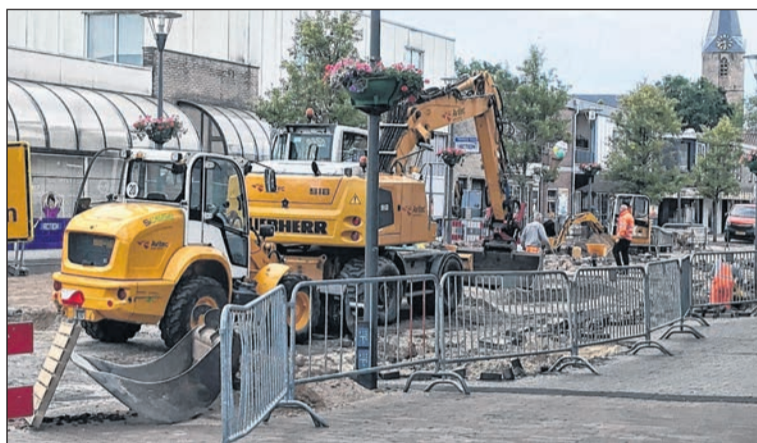
De werkzaamheden in het centrum van Beilen liggen op schema.

men snel verholpen worden. „Zowel de zakelijke markt alsook particulieren nodig ik van harte uit om gebruik te maken van mijn diensten. Zij kunnen mij inschakelen voor voor aankoopadvies en/of installatie van een compleet netwerk of een enkele computer of laptop. Wanneer zich een storing voordoet of er iets kapot gaat, dan wil men graag dat het euvel snel verholpen is. Ik ben snel ter plaatse en geef graag persoonlijk en duidelijk advies.” Meer informatie is te vinden op www.michel-it.nl . Bellen kan ook: 06 - 5764 1124.