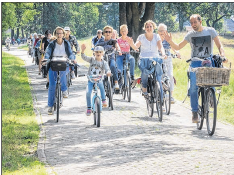
Er is een alternatieve Drentse Fiets4Daagse ontwikkeld.

Jongeren die nog een beroep op de regeling willen doen, wordt geadviseerd voor de zomer de aanvraag te doen, omdat het aanvragen en de behandeling van de voucher een paar weken in beslag kunnen nemen. De regeling is te vinden op www.provincie.drenthe.nl/@131130/subsidie-vouchers .