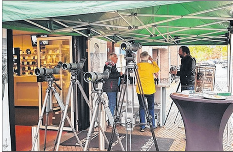
Vrijdag houdt de VerrekijkerShop de Kijk & Vergelijk dag.

Tot ziens vrijdag 19 juni aan de Brinkstraat 14 in Beilen, meer info: 0593-582524.