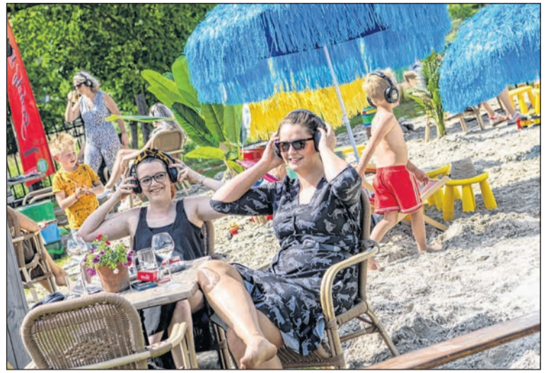
Stil protest op het terras van De Turfsteker.

De vakleerkrachten krijgen ondersteuning van het team Gezond in Midden-Drenthe. Op die manier kunnen ze nog meer kinderen bereiken en kunnen ze verschillende bewegingsactiviteiten met elkaar verbinden.