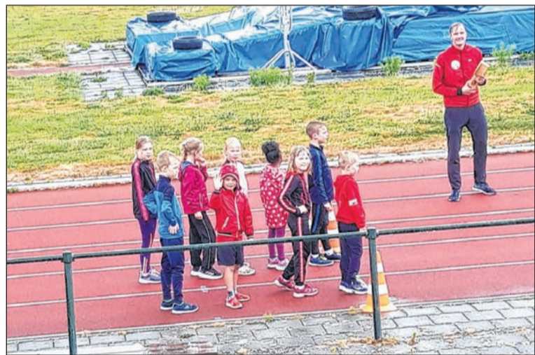
De jeugdleden van DOS in Steenwijk.

De atletiekunie heeft de wedstrijden voor het hele seizoen geschrapt in verband met het coronavirus. Daardoor worden de prestaties van de atleten niet