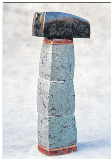
'Amphion', een van de beeldhouwwerken van Lucas Klein.

De expositie is tot en met 8 augustus te bezoeken op zaterdagmiddagen tussen 13.00 en 17.00 uur. Er zijn in verband met het coronavirus maatregelen genomen volgens de RIVM richtlijnen.