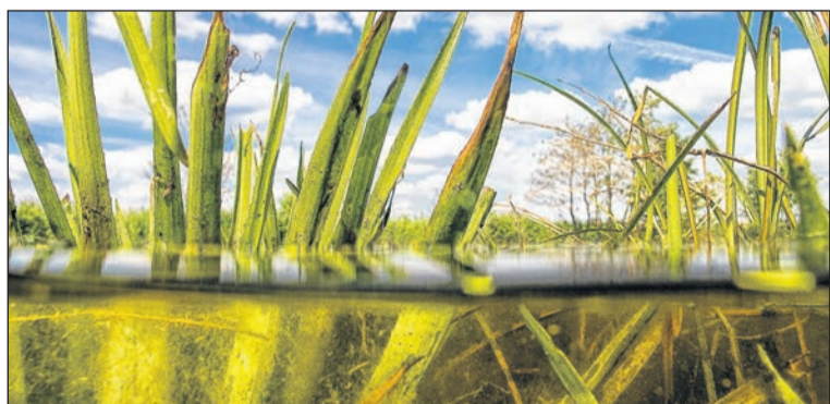
Waterschap WDO Delta heeft het waterpeil opgeschroefd tot boven het maximum.

Het waterschap volgt de weersverwachting nauwlettend om bij een weersomslag tijdig te kunnen anticiperen. WDO Delta heeft laten weten dat de neerslag van de afgelopen dagen, nagenoeg geen effect heeft op de droogtesituatie en de grondwaterstanden.