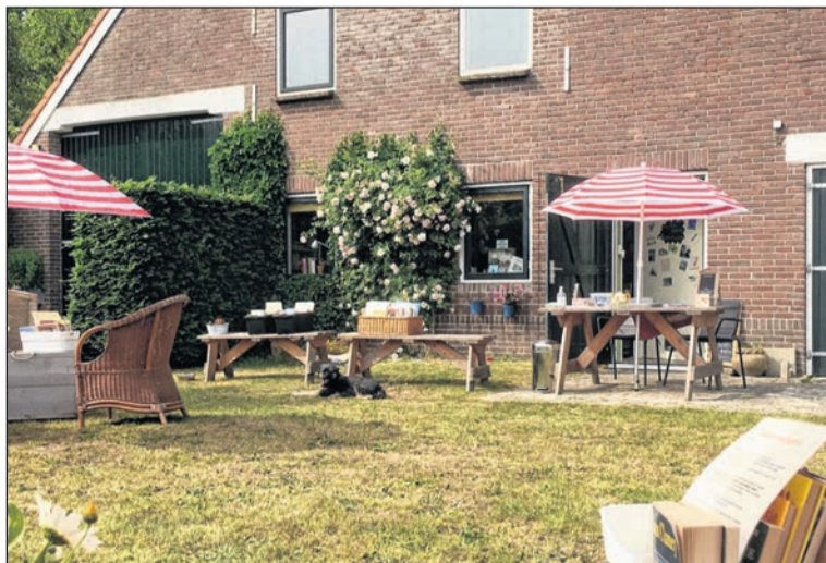
Leestuin Hond in de Kast is weer open.

voortgezet als leeswinkel, ook elke dinsdag. Het adres is Mr. J.B. Kanweg 20 in Witteveen. Meer informatie is te vinden op de website www.hondindekast.nl .