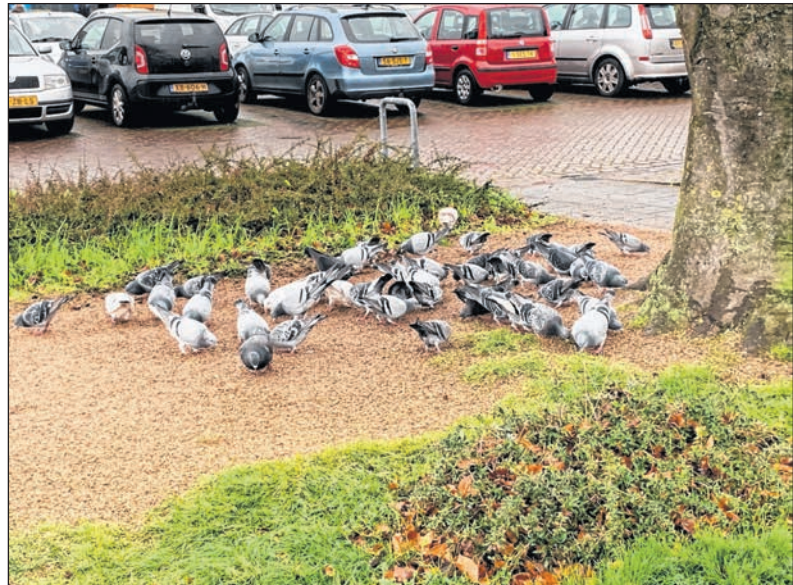
■ De duiven doen zich graag tegoed aan het gedumpte vogelzaad op de Oude Markt.