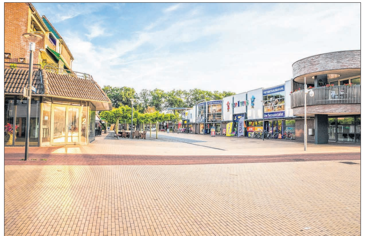
■ Het Molenplein in Ter Apel maakt onderdeel uit van het centrumplan.

De provinciale bijdrage komt uit de subsidieregeling Retailagenda, waarmee de provincie Groningen gemeenten ondersteunt bij de ontwikkeling van winkelgebieden.