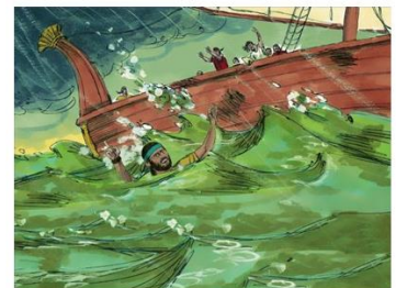
Jona overboord van het schip