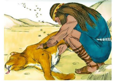
Simson met de dode leeuw