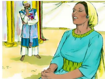
Hanna bij Eli in de tabernakel