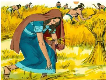
Ruth op de akker van Boaz