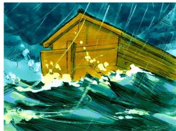
Noach en de ark