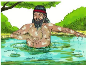
Naäman in de Jordaan