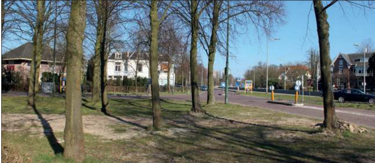
Voor een nieuw kruispunt om de Bilthovenseweg en de Dorpsstraat in verbinding te brengen met de Utrechtseweg wil de gemeente De Bilt 14 lindebomen kappen.