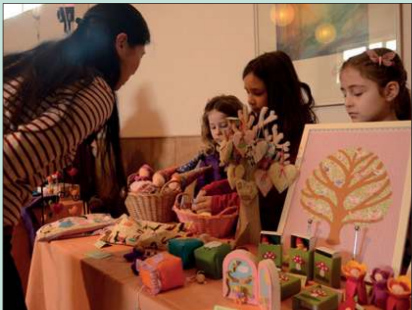
Creativiteit ten top op de lentemarkt in de Steinerschool.

De zesde klas verdiende weer bij voor haar schoolkamp door koffie en thee met een lekker stuk taart te verkopen. Vele (nieuwe) ouders kwamen sfeer proeven. Zaterdag 20 april is er weer een open ochtend van 10.00 tot 12.30 uur. Ook het Kindercentrum Weltevreden houdt dan haar open dag.