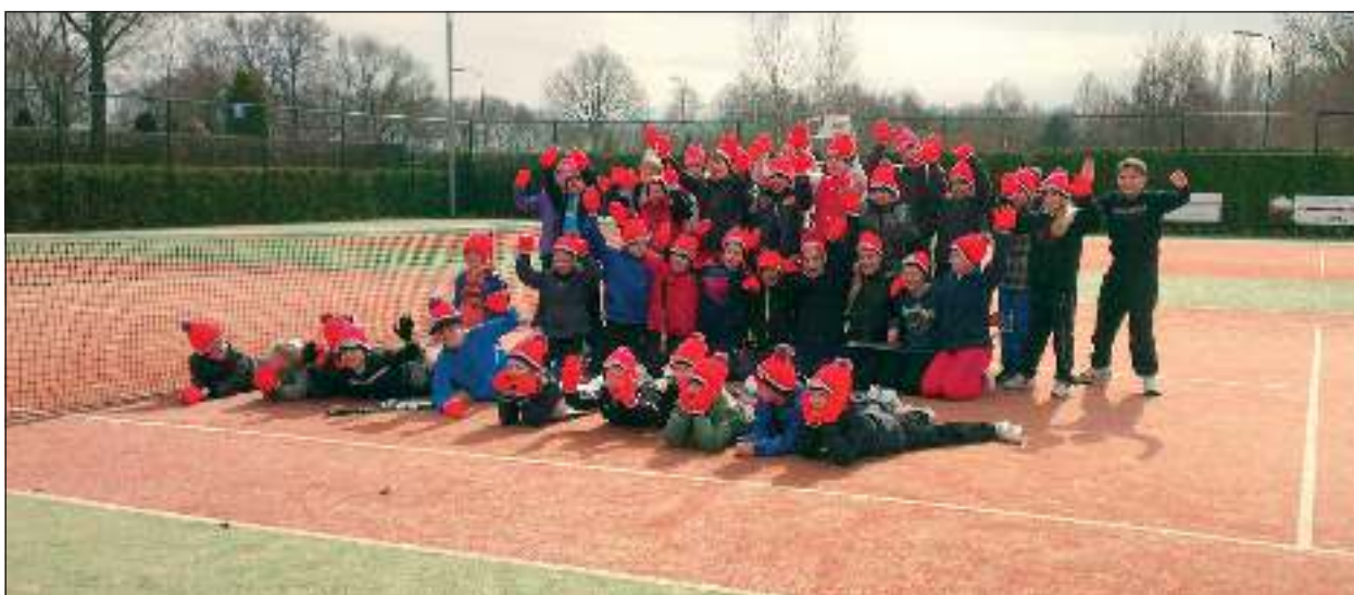
In een toepasselijke outfit werd het openingstoernooi van Tautenburg gespeeld.

volgende speelronde weer werd ingezet. Goed georganiseerd in een geweldige sfeer maakte het een prachtige tennismiddag. Wanneer tennis je ook wat lijkt kun je nu gebruik maken van een aanbieding die de club biedt: Nu lid worden en de eerste 3 tennissen gratis. Kijk op www.tautenburg.nl voor meer informatie.