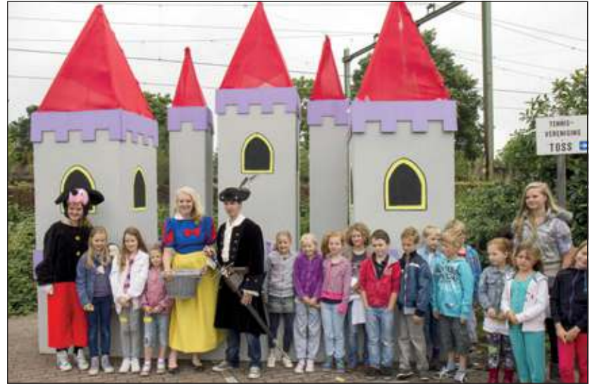
De opening van de Kindervakantieweek is altijd een hele happening, die gebaseerd is op een bepaald thema. Vorig jaar was dat Sprookjes Wonderland. Het thema van 2013 blijft nog even een verrassing. (foto WVT)

gen de kinderen ranja en tussen de middag een broodmaaltijd. De leiding streeft ernaar zoveel mogelijk kinderen de kans te bieden aan het reguliere programma deel te nemen, ook gehandicapte kinderen (rolstoelers) en kinderen die een dieet moeten volgen en/of medicijnen moeten gebruiken. Het is de bedoeling dat