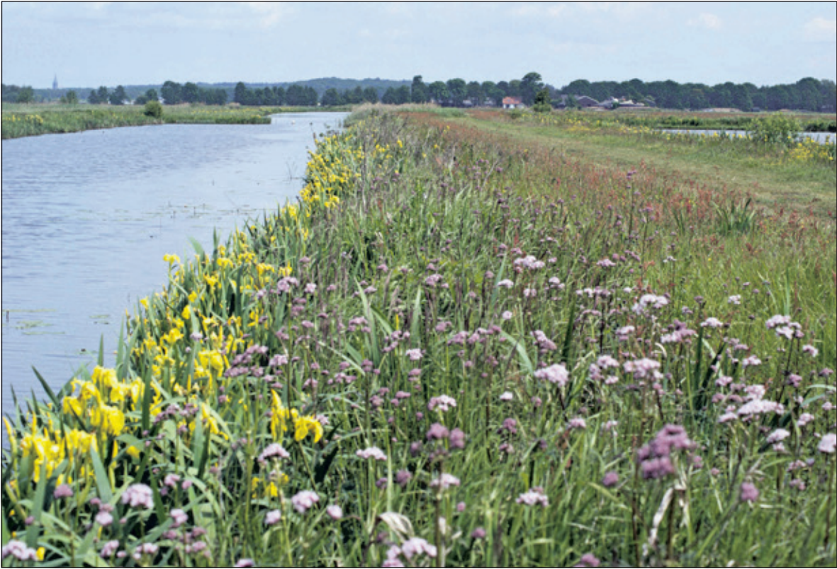
Het zoddengebied is via het Bert Bos-pad te betreden.

Laarzen zijn, zeker door in natte tijden, aan te bevelen; voor rolstoelen is het gebied helaas niet geschikt. Men kan van twee kanten het reservaat in; vanaf de Kerkdijk te Westbroek en vanaf de Graaf Floris V -weg te Hollandsche Rading. Bij elke in gang is een paneel geplaatst met informatie over de wandelroute en het planten- en dierenleven in de Westbroekse Zodden.