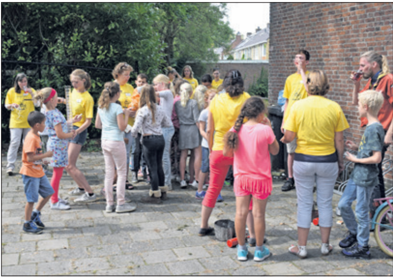
Dorst lessen in De Bilt.