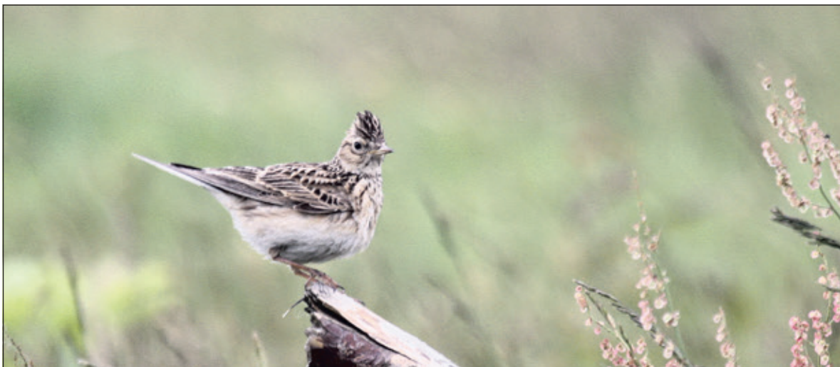
Veldleeuwvinken voelen zich prima thuis op de vliegbasis.

Utrechts Landschap is dé beschermer van natuur en monumentaal erfgoed in provincie Utrecht en viert dit jaar haar negentigjarig bestaan. Utrechts Landschap heeft momenteel 600 vrijwilligers, 23.500 Beschermers en 59 Bedrijfsvrienden.