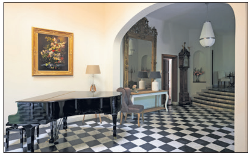
Tijdens OMD kan er een kijkje genomen worden in Rustenhoven.

De opengestelde monumenten zijn: de begraafplaats in Groenekan, de boerderij van Buijs in Bilthoven, De Oude School in De Bilt, gemeentehuis Jagtlust in Bilthoven, landgoed Eyckenstein in Maartensdijk, molen de Kraai in Westbroek, buitenplaats Persijn in Maartensdijk, buitenplaats Rustenhoven in Maartensdijk en Sandwijck in De Bilt.