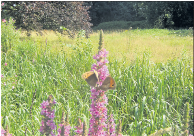
Voor vlinders is het goed toeven op Sandwijkstraat.

Als het vochtig weer is, zijn laarzen of hoge schoenen nodig. De rondleiding is gratis. Honden zijn (ook aangelijnd) niet toegestaan op Sandwijkstraat.