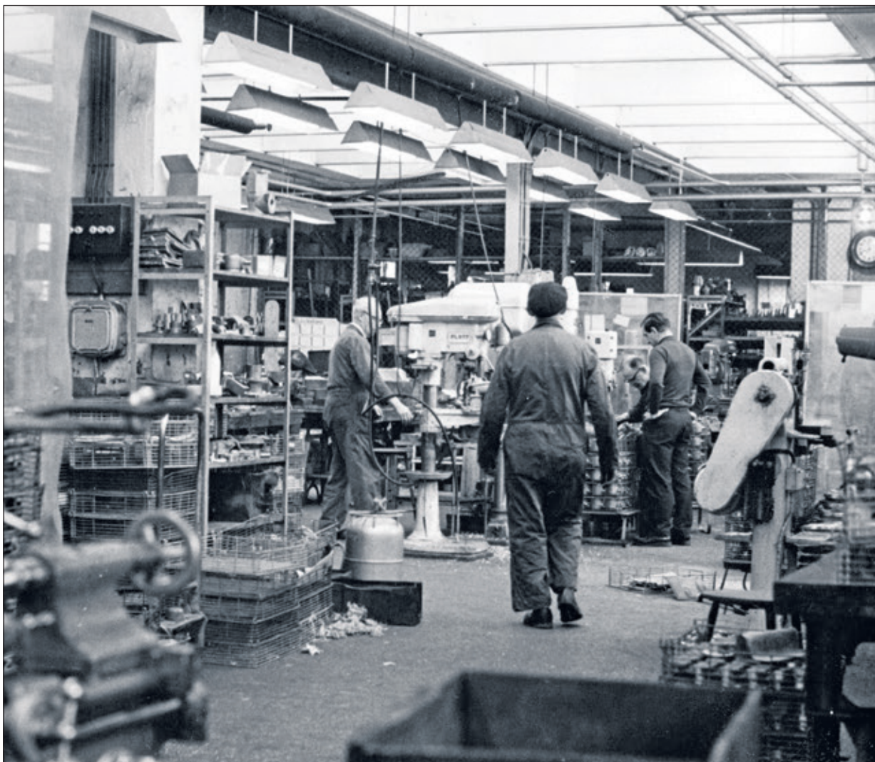
De ESKEM in bedrijf.