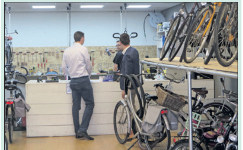
Twee Van Lodenstein-managers zoeken bij de fietsenwinkel naar informatie.

Sommige deelnemers gingen zo op in het spel dat ze deden of het echt was. Een bewoonster van de Sperwerlaan belde bij het horen van de opmerking 'Er is een meisje ontvoerd en wij zijn naar haar op zoek...', spontaan de politie. Die namen de zaak serieus en rukten met twee auto's uit. De ingesloten managers hadden heel wat uit te leggen. Het ontvoerde meisje werd later gevonden op de zolder van een schuur aan de Bantamlaan. [HvdB]