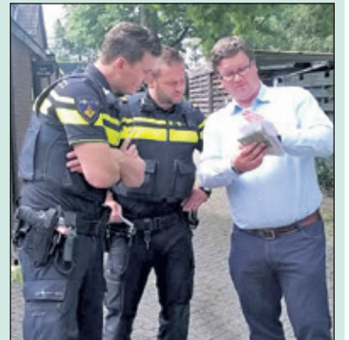
Eén van de teammanagers uit Kesteren heeft heel wat uit te leggen.