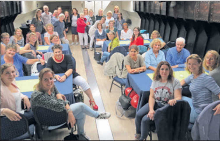
Het team van de Julianaschool op de Inspiratieboot in Amersfoort.