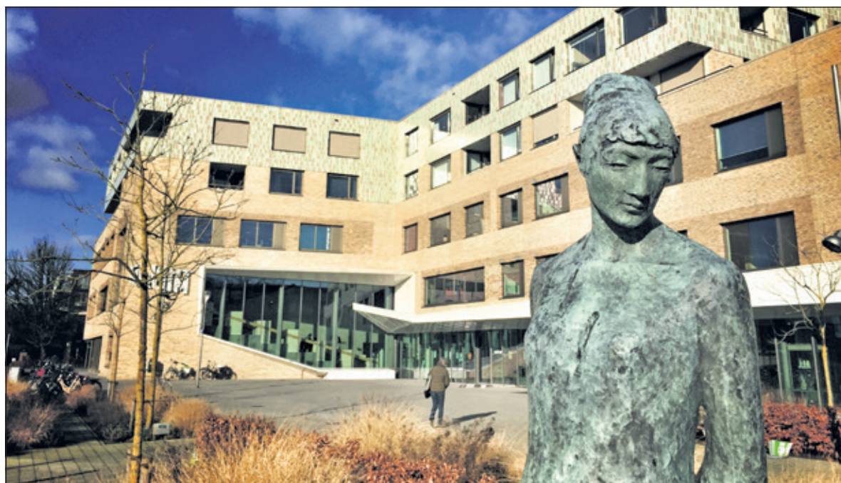
Het Lichtruim houdt open huis.

verschillende organisaties in de regio, die als gezamenlijk doel hebben cultuur toegankelijk te maken