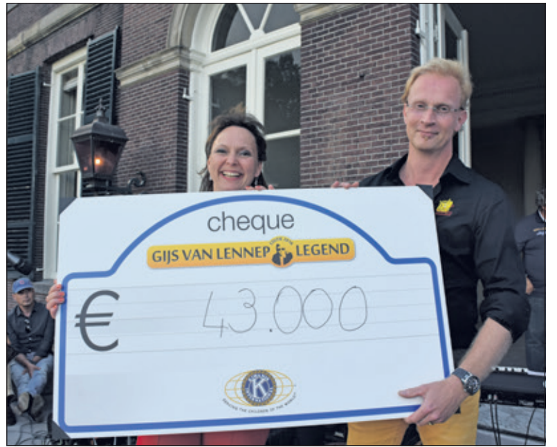
Met de veiling, inschrijfgelden en sponsoring werd in 2016 uiteindelijk bij de Gijs van Lennep Legend het recordbedrag van 43000 euro opgehaald voor ZonnaCare uit Den Dolder.

In de loop van de middag vindt de veiling plaats voor het goede doel, de Prinses Máxima Manege in Den Dolder. Zij bieden hippische activiteiten aan mensen met en zonder beperking om vooruitgang te bevorderen in hun welzijn en maat-