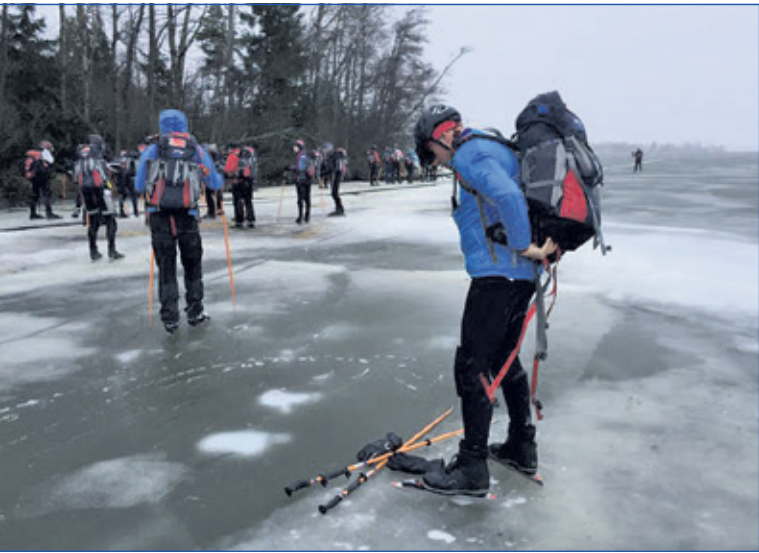
Schaatsen op natuurijs

het Biltsche Meertje. IJBM voelt zich dan ook zeer verbonden met deze plek. Onlangs hebben de gemeente en het Utrechts landschap voor een hernieuwde periode van 10 jaar vastgelegd dat op deze plek de gemeentelijke natuurijsbaan wordt gecontinueerd. Wij vertrouwen erop dat er genoeg schaatsvrienden opstaan om de organisatie van het ijsevenement veilig te stellen. In het najaar komen we bij u terug met concrete plannen.