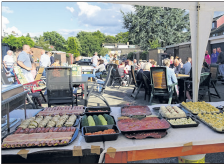
Ruim 80 bewoners genieten van het lekkers en de gezelligheid.