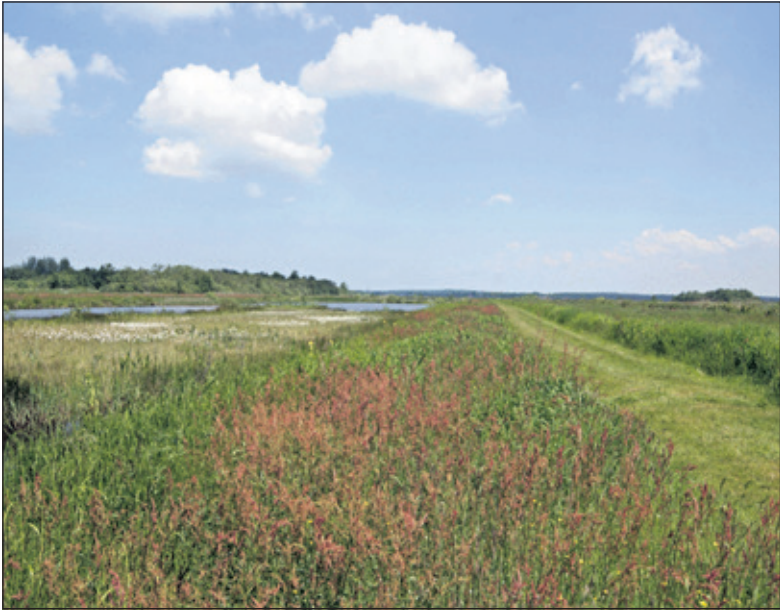
In het zoddengebied zijn unieke plantensoorten te vinden.

‘De laatste fase van de successie is het verschijnen van de houtachtige gewassen zoals wilg en els. Dit zijn de eerste bomen die verschijnen, omdat ze goed tegen water kunnen. Van deze bomen komen diverse inheemse soorten voor. De meest voorkomende wilg is de schietwilg; deze is in de winter te herkennen