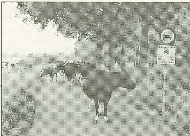
Ze moesten even aan de nieuwe borden wennen maar deze dames mochten gewoon doorlopen, landbouwverkeer is namelijk uitgezonderd

Wethouder Van Leeuwen kwam daarop met het voorstel om het sluipverkeer met een paaltje tegen te houden. De bewoners zouden dan de sleutel krijgen om het paaltje in te klappen. Maar daar voelden de bewoners niets voor. Dat zou te lastig zijn, vooral ook als iemand snel naar het ziekenhuis moet. Het plaatsen van borden bij het af te sluiten gedeelte werd een alternatief, precies zoals de bewoners van de Ruigenhoeksedijk het hadden voorgesteld.