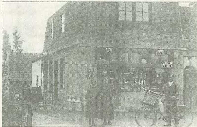
De winkel van Gijs Doornenbal met Gijs, zijn vrouw en dochter.

Over het werken in de smederij is niets te achterhalen. Er zijn geen doorvertelde verhalen over de familie Van Wiggen in het dorp bekend.