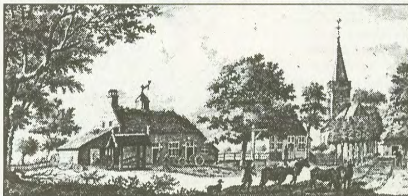
Tekening uit 1744 van De Beijer met links de smederij.

Soms kan een niet-gecamoufleerd rimpeltje terloops de werkelijke leeftijd van iemand verraden. Zo kan ook een oude balk of oude muur van een gerenoveerd pand verwijzen naar de historie van een huis.