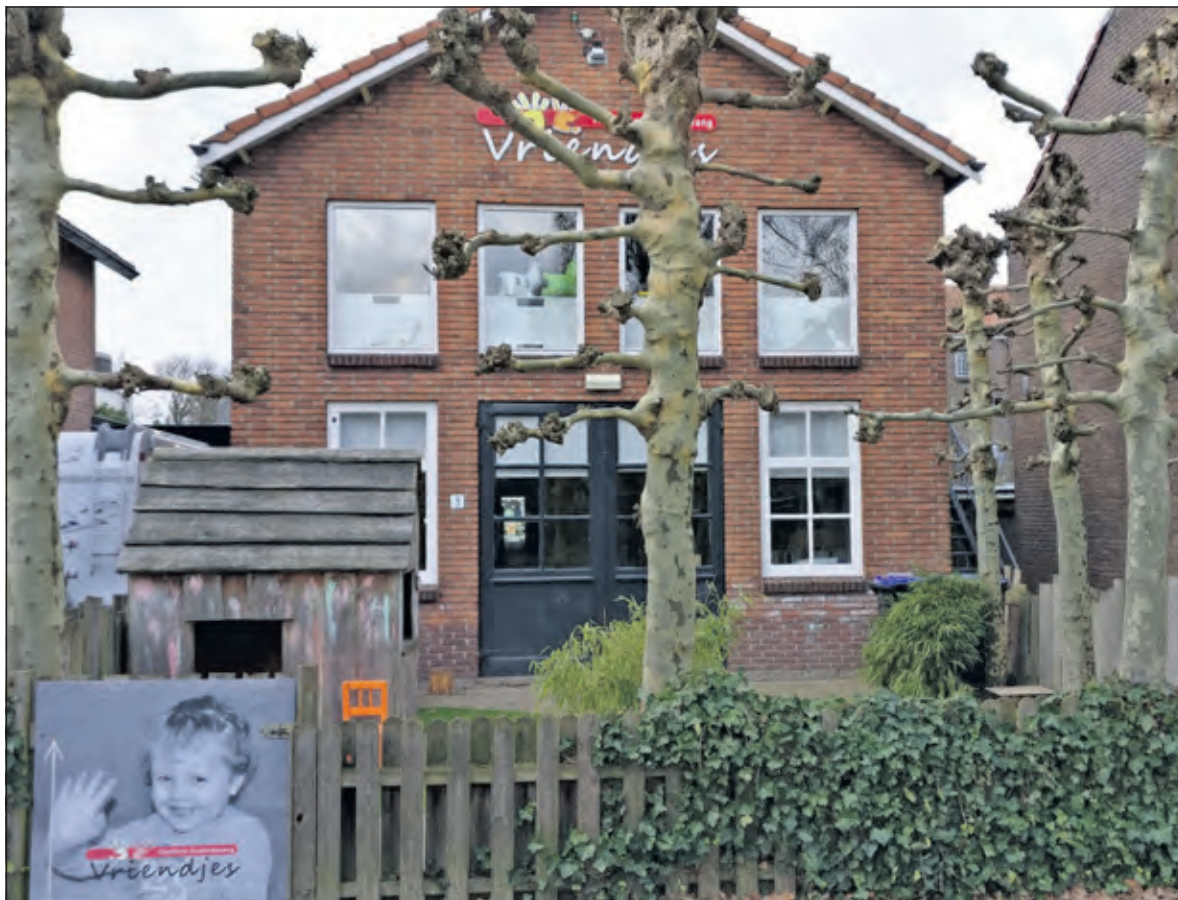
Op Tuinstraat 3 zullen twee appartementen komen (foto febr. 2019).

UWassistent regelt ondersteuning voor die inwoners van onze gemeente die nét een beetje extra hulp nodig hebben om zelfstandig te blijven. 'Een boodschap doen, een kappersbezoek of, op afspraak, een winkel bezoeken is niet voor iedereen vanzelfsprekend. Maar gelukkig is dat wel voor iedereen mogelijk. Wilt u er weer eens op uit? Wij gaan graag met u mee voor vervoer, begeleiding of gewoon om een fijne middag met u door te brengen', aldus de vaste contactpersoon van UWassistent Midden-Nederland, Heleen Aalders. Meer informatie? Kijk op www.uwassistent.nl of bel 06-41807676.