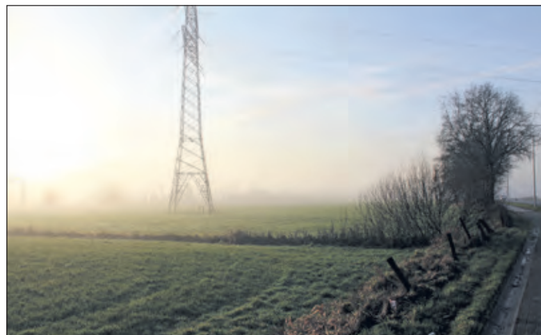
Een mogelijk zonnepanelenpark onder hoogspanning.

is beschreven dat de opgewekte energie zoveel mogelijk toekomt aan de directe omgeving. Initiatiefnemer heeft in dit verband getracht een samenwerking aan te gaan met een lokale energiecoöperatie maar is daarin niet geslaagd. Als argumenten noemt het College, dat het bouwplan voorzien is van een goede ruimtelijke onderbouwing, dat het bouwplan tegemoet komt aan de doelstellingen voor duurzame energieopwekking en dat de initiatiefnemer aanspraak maakt op een subsidie van het rijk. Om in aanmerking te komen voor die subsidie is een voorwaarde, dat de initiatiefnemer beschikt over de omgevingsvergunning van het bevoegd gezag, in dit geval van het College. Omdat deze subsidietermijn in het najaar sluit is het van belang om de besluitvorming uiterlijk in april 2021 af te ronden. In het geval de gemeenteraad op 22 april besluit om geen verklaring van geen bedenkingen af te geven, moet het College de gevraagde omgevingsvergunning weigeren. Ook in dat geval start de inzagetermijn van het ontwerpbesluit, waarna het College daarna opnieuw de gemeenteraad zal inschakelen voor het afhandelen van de te verwachten zienswijzen en het vastleggen van het definitieve besluit.