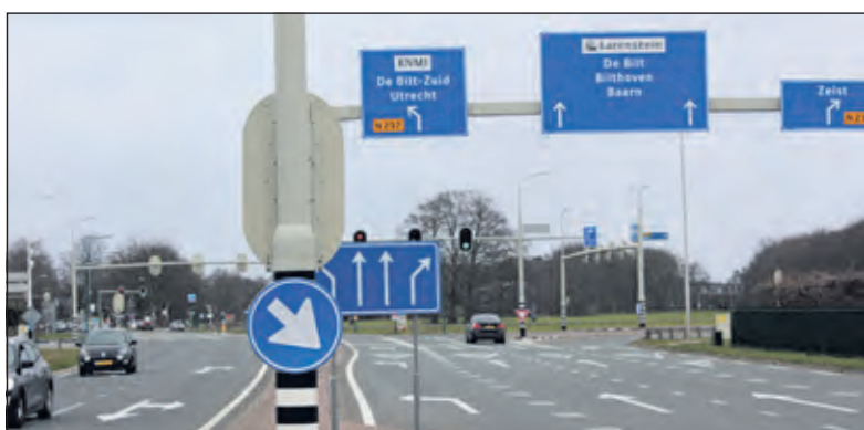
De N412 begint op de aansluiting Utrecht-De Uithof en telt hier 2 x 2 rijstroken.