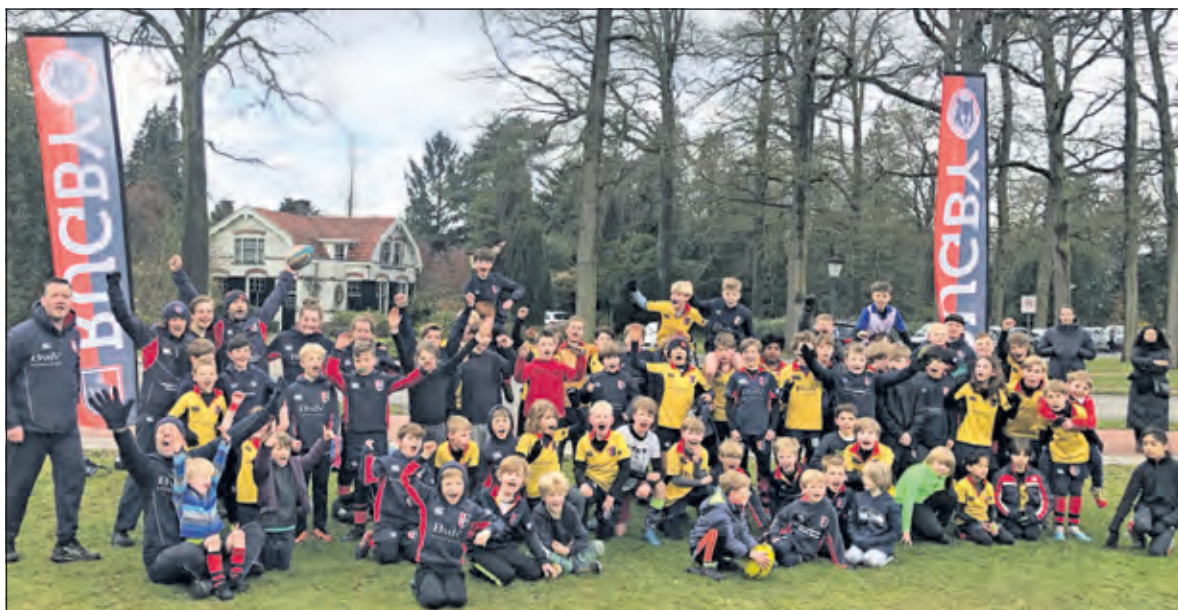
Succesvolle afsluiting van eerste proeftraining van dit jaar met tussen de geel en blauwe shirts ook veel nieuwe kleuren van stoere proefleden