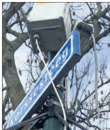
De camera in Westbroek doet 't even niet.