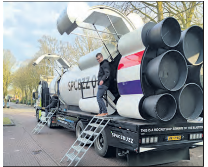
Met de SpaceBuzz kunnen schoolkinderen virtueel door de ruimte reizen.

op weg naar de maan'. Onderweg wordt uitgelegd wat de satellieten doen en wat er op het ISS (International Space Station) gebeurt. Tot slot gaat de raket nog een rondje om de maan om weer terug te vliegen naar de aarde.