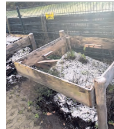
Een van de moestuintjes op het schoolplein is kapot.