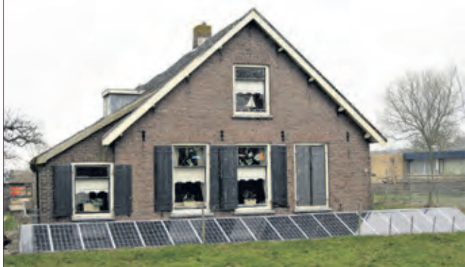
Zonnepanelen voor een huis in Maartensdijk.

BENG! is de onafhankelijke energie-coöperatie van en voor inwoners van De Bilt. Kijk op www.beng2030.nl voor andere avonden en activiteiten.