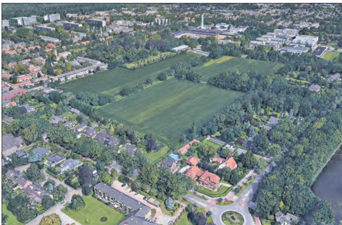
Luchtfoto van het gebied rond de Schapenweide.

de gemeente in dat traject ook een rol en kan dan een stevige regierol hebben door te sturen op kwaliteit en ervaring van een ontwikkelaar. Allereerst worden ontwikkelaars geselecteerd die ervaring hebben met binnenstedelijke ontwikkeling in een mengvorm van wonen en werken. Dan vallen er al een heleboel ontwikkelaars af en uiteindelijk kan er ook op de kwaliteit van de plannen geselecteerd worden. Dat zijn belangrijke stappen die in zo'n traject ingebouwd kunnen