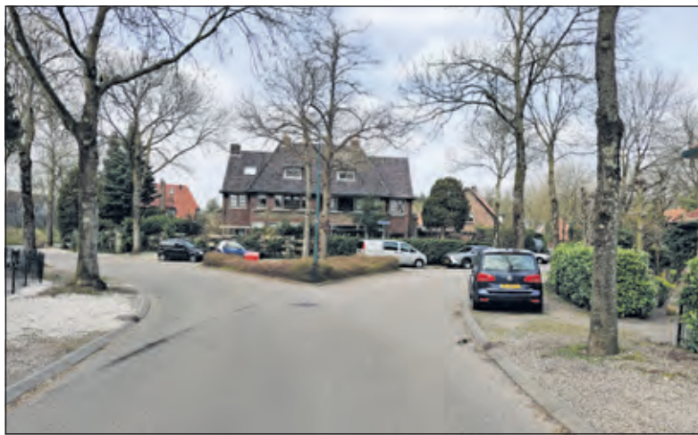
Hoe kan de gemeente met oog op vergrijzing de voorzieningen op peil houden in de kleine kernen om de leefbaarheid te waarborgen?

Over Klimaatadaptatie schrijft het rapport: 'Het is een opgave om de ruimtelijke omgeving van de gemeente klimaat-adaptief in te richten. Met het oog op klimaatverandering is het voor een toekomstbestendige woon- en leefomgeving nuttig na te denken over mogelijke maatregelen tegen hittestress, wateroverlast en droogte. De vraag is waarmee de gemeente kan bijdragen aan de ambities uit de Regionale Energietransitie (RES), met oog voor kansen en beperkingen in zowel het landelijk als stedelijk gebied. Hierbij moet bovendien rekening worden gehouden met waardevolle landschapselementen, toekomstige technische mogelijkheden en infrastructuur en planologische beperkingen van de ondergrond'. Bekijk de Basisverkenning op www.doemeedebilt.nl/documenten .