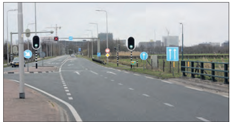
Een blik op de kruising N412 (Universiteitsweg) en de N437 (Utrechtseweg).

Vanaf maandagavond 19 april tot donderdagochtend 22 april is de N412 gedurende de avonden/nachten afgesloten ter hoogte van de werkzaamheden. De afsluitingen beginnen om 21.00 uur 's avonds en lopen door tot 06.00 uur de volgende ochtend. Tijdens de avond-/nachtafsluitingen wordt het door-