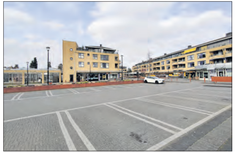
Hoe kunnen centrumgebieden levendig worden gehouden, rekening houdend met de veranderde functie ervan, waarbij sfeer, beleving en andere niet-winkel-functies steeds belangrijker worden?

Het rapport vermeldt over woningbouw: 'Er ligt een opgave om voldoende woningaanbod te creëren, passend bij de behoefte. Bij woningbouw moet de gemeente kijken naar de mogelijkheden van intensivering en verdichting in relatie tot de gewenste identiteit en ruimtelijke kwaliteit van de kernen. Daarnaast ligt er de opgave om de kwalitatieve woonbehoefte goed af te stemmen op het woningbouwprogramma, bijvoorbeeld vanwege vergrijzing en bijbehorende vraag naar passende zorgvoorziening. Momenteel is bijvoorbeeld de doorstroming erg laag, omdat er onvoldoende seniorenwoningen zijn. Hierdoor zijn er ook onvoldoende betaalbare woningen voor jonge vestigers en gezinnen, waardoor de vitaliteit van kernen op termijn onder druk komt te staan.