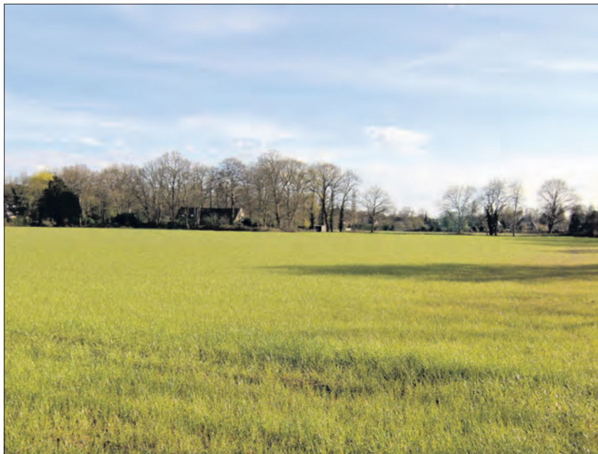
Een deel van de Schapenweide (hier gezien vanaf de Antonie van Leeuwenhoeklaan richting het zuiden) in Bilthoven.