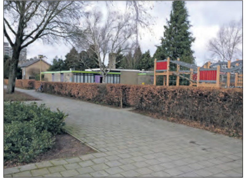
'Vriendjes' is voortgezet op de Prof. Dr. T.M.C. Asserweg 2 (foto febr. 2019).

Om de bestemming te wijzigen is het nu ter vaststelling voorliggende bestemmingsplan opgesteld. Vanaf augustus 2020 heeft het ontwerpbestemmingsplan gedurende zes weken ter inzage gelegen. Gedurende de inzageperiode is één zienswijze ontvangen welke geen aanleiding heeft gegeven om wijzigingen door te voeren ten opzichte van het ontwerpbestemmingsplan.