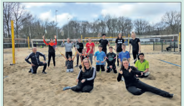
Een nieuwe ervaring voor de jeugdige zaalsporters om op de beachvolleybalvelden van SV Irene badminton te spelen.

Na ongeveer 3,5 maand niet te hebben gebadmintond, was het wel weer even wennen voor deze zaalsporters. Buiten badmintonnen betekent dat er rekening moet worden gehouden met wind, het zand uiteraard, de zon en de temperatuur. Maar dat alles namen de zaalsporters voor lief want na zoveel tijd vonden ze het vooral heerlijk om elkaar weer te zien en te werken aan hun conditie.