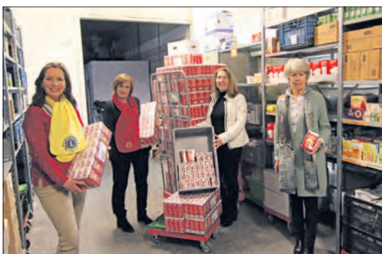
Vorig jaar leverde de actie nog 876 pakken koffie op. Dit jaar werden er maar liefst 1360 pakken DE-koffie aan Voedselbank De Bilt overhandigd.

Afgelopen maanden hebben Lionsclub Utrecht Kromme Rijn en Lionsclub Bilthoven 2000 een inzamelactie georganiseerd voor Voedselbank De Bilt. Bij diverse winkels stonden verzameldozen voor DE-waardepunten en vreemd en oud geld.