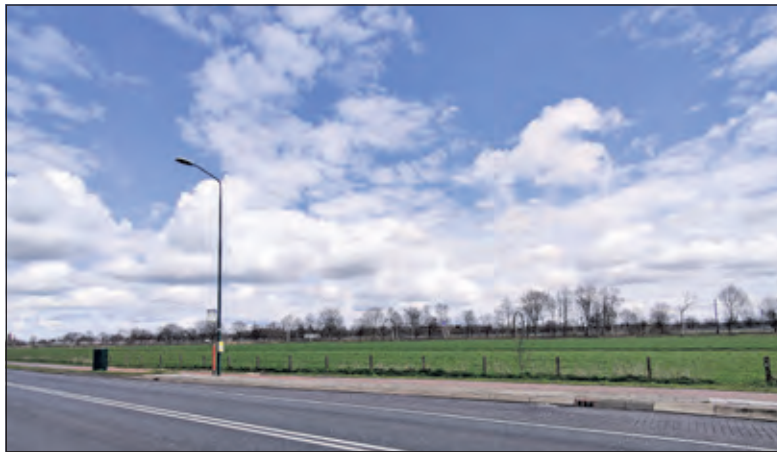
Vanaf Landgoed Persijn in oostelijke richting gezien.

Landgoed Persijn schrijft hierover op haar website: 'Aangezien natuur en ecologie voor ons een cruciaal onderdeel zijn van een prettig leef- en werkklimaat, zijn wij vóór de energietransitie. Er bestaan heldere en goede lokale initiatieven, waarvan zowel de lokale ondernemers als omwonenden profiteren. Tegen het onderhavige plan hebben wij een aantal bezwaren: Het is geen lokaal initiatief. Buren en omwonenden hebben geen belang bij het zonnepark en daarmee ontbreekt ook de maatschappelijke grondslag. Een goede oplossing zou zijn wanneer er meer dan 50% van de opbrengst daadwerkelijk terugvloeit naar burenen en omwonenden. Daarnaast is het behoud en verdere ondersteuning van de ecologie van cruciaal belang. Op en rond het landgoed Persijn en daarbuiten is een absoluut unieke ecologische structuur. De huidige plannen van dit zonnepark verstoren deze ecologie. Een betere oplossing is om het zonnepark anders in te passen in de huidige natuur. Dit zou bijv. kun-