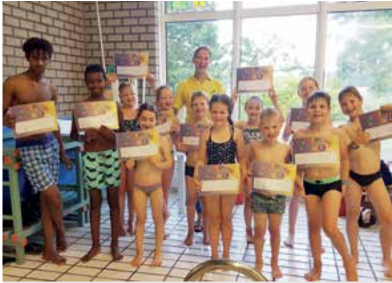
Gefeliciteerd met jullie C-diploma!