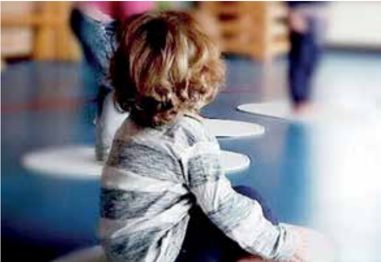
Niets is zo belangrijk als de ontwikkeling van je kind(eren).

zodat het zich kan versterken op lichamelijk en emotioneel gebied.