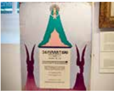
Een advertentie van het Brunogebouw, gemaakt door Joan Praetorius.