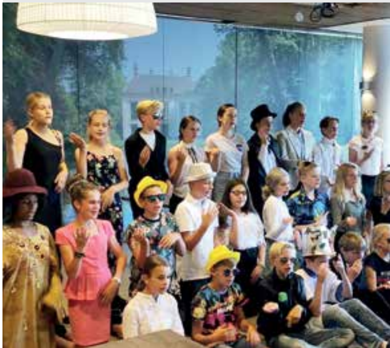
Groep 8 van Meander treedt op bij De Loet

HEILOO - Met het nummer Rock&Rollator swingden de leerlingen van basisschool Meander woensdag 3 juli op het podium van wooncentrum De Loet. Dit is een van de nummers die de groep deze week ten gehore gaat brengen tijdens de afscheidsmusical ‘Wie heeft de rol’, waarmee groep 8 definitief afscheid neemt van de basisschool. De kinderen vonden het heel leuk om op te treden voor de bewoners. Daarnaast konden ze alvast wennen aan optreden voor publiek. De bewoners waren allemaal superenthousiast en rockten met of zonder rollator de zaal uit.