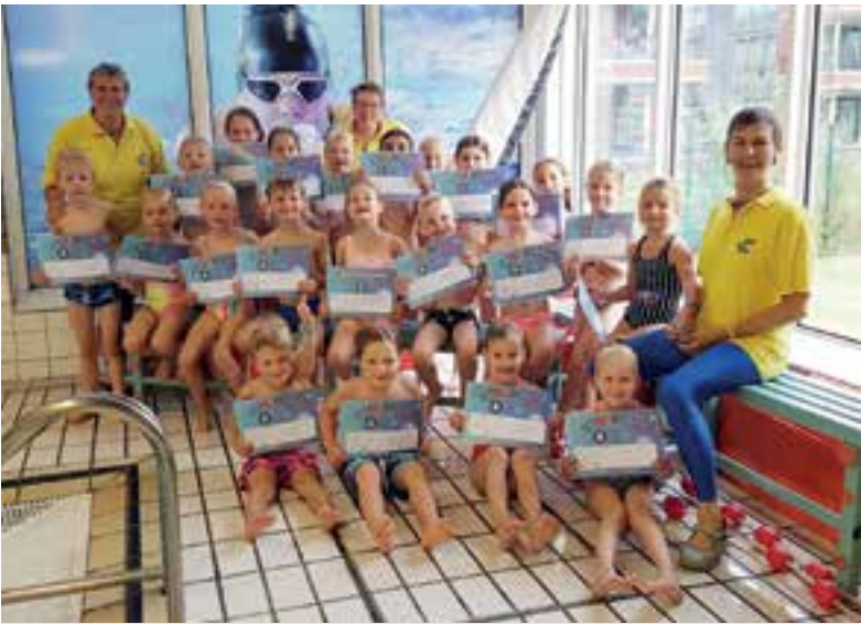
Allemaal een A-diploma!