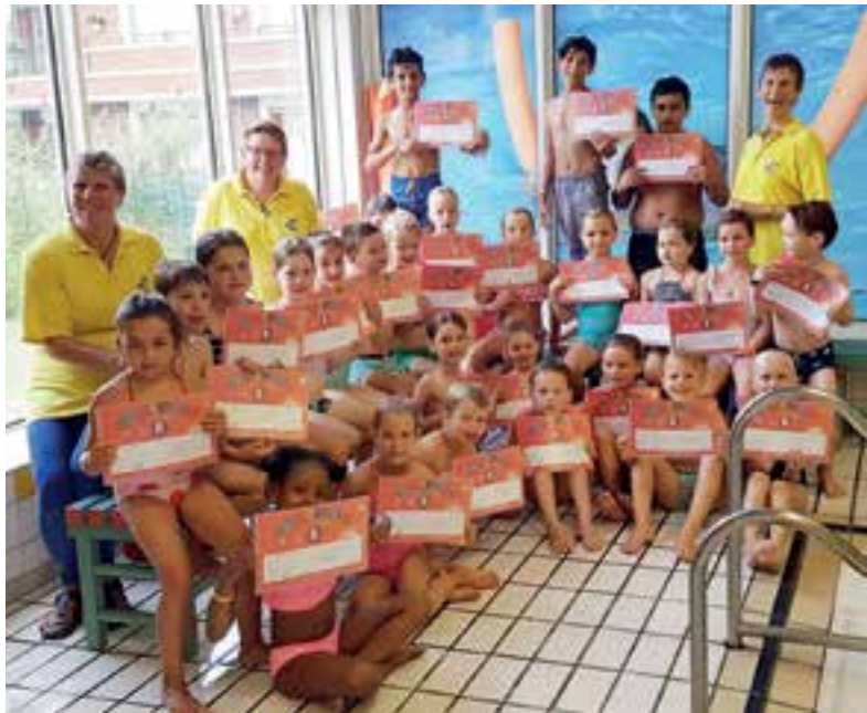
Hoera voor deze kanjers!