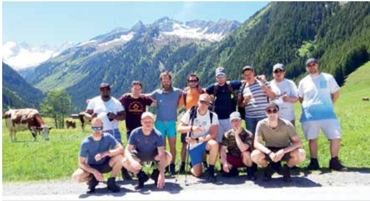
De groep heeft afgezien, grenzen verlegd en vooral ontzettend genoten in de Alpen.