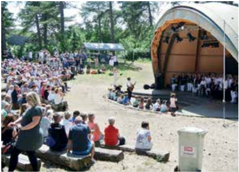
Het door De Skulpers georganiseerde festival trok veel bezoekers.

Het is druk in onze kringloopwinkel en zonder inzet van vrijwilligers zijn deze donaties niet mogelijk. Heeft u zin om ons te komen helpen? U bent van harte welkom! Kringloopwinkel Keer op Keer, Rijksweg 127 in Limmen, tel. 072-5325962. Openingstijden: dinsdag, donderdag en zaterdag van 10.00 tot 15.00 uur.