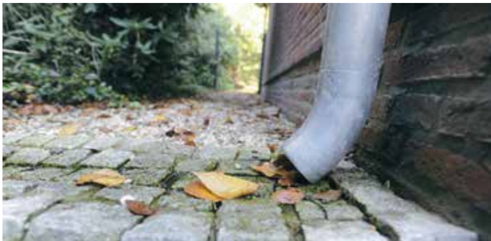
Het scheelt als regenwater in de tuin kan lopen in plaats van in het riool.

De gemeente kan het effect van klimaatverandering niet alléén opvangen. Om wateroverlast na flinke regenbuien te beperken zijn maatregelen op eigen terrein van inwoners en ondernemers ook nodig.