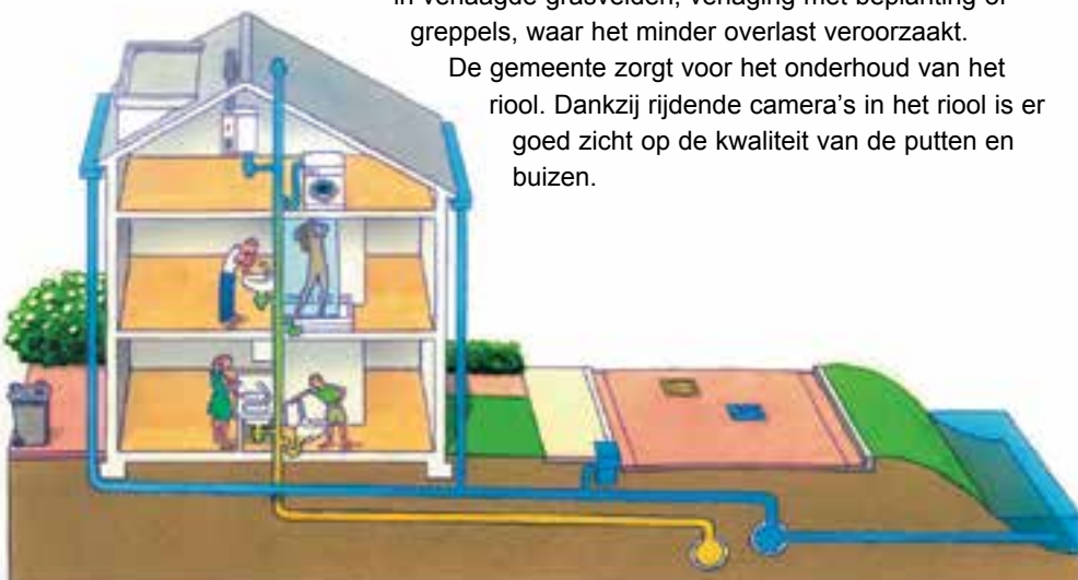
Regenwater en afvalwater worden apart afgevoerd. (Illustratie Rioned)

De gemeente zorgt voor het onderhoud van het riool. Dankzij rijdende camera's in het riool is er goed zicht op de kwaliteit van de putten en buizen.