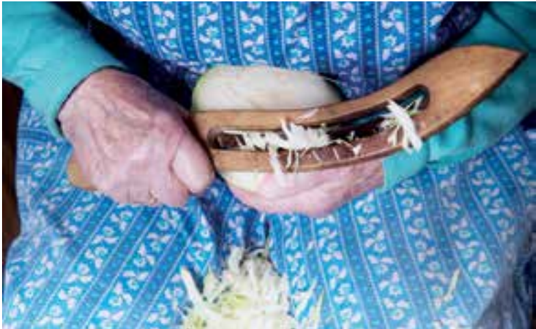
Wanneer vertelt u elkaar nog verhalen over vroeger?

Het thema is: Het bos, het duin en de moestuin. 15 juli in Theeschenkerij De Trog van 14.00 tot 16.00 uur. Deelname € 7,50 inclusief koffie & thee. Aanmelden bij VVV De Verhalenkamer. info@verhalenkamerwillibrordus.nl of 06-22795336.