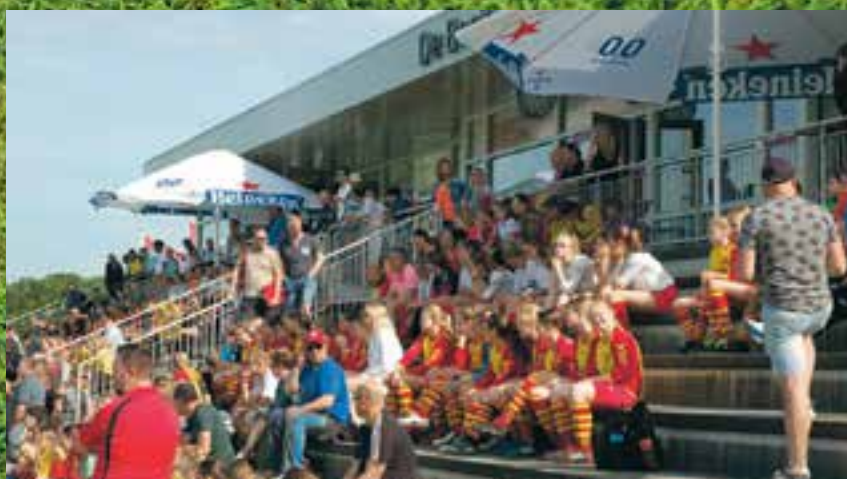
De meiden van HSV en De Foresters zitten gezellig naast elkaar tijdens het Mona Burgering Toernooi 2019.