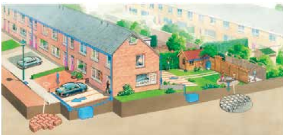
Speciale bestrating en planten helpen het regenwater in de tuin te houden. (Illustratie Rioned)

Hoe meer regenwater rechtstreeks in de grond kan stromen, hoe minder het riool onder druk komt te staan. Waar veel huizen of bedrijven staan, is dat vaak moeilijker: straten en terreinen zijn geplaveid en het regenwater vindt vooral via het riool zijn weg. Wat helpt is in deze gebieden ruimte voor regenwater te scheppen. Door groen te planten bijvoorbeeld.