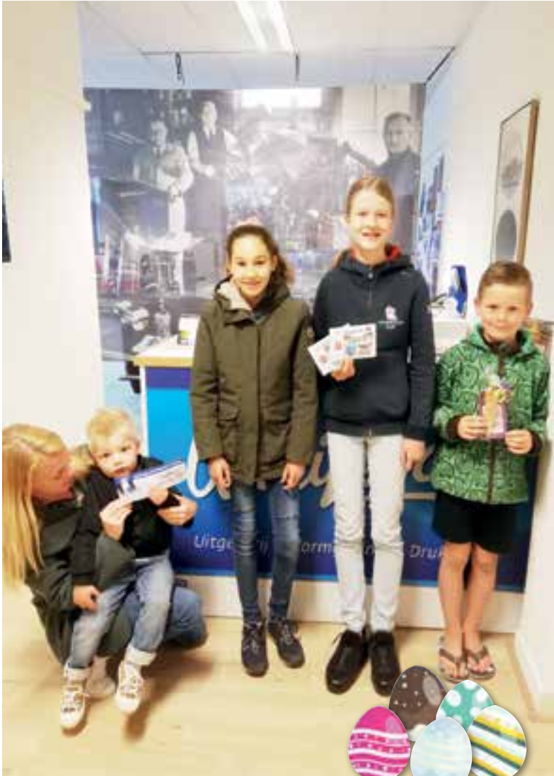
De prijswinnaars voor de balie van Uitkijkpost. Aangeleverde foto