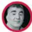
Ararad, (Kinder) osteopaat