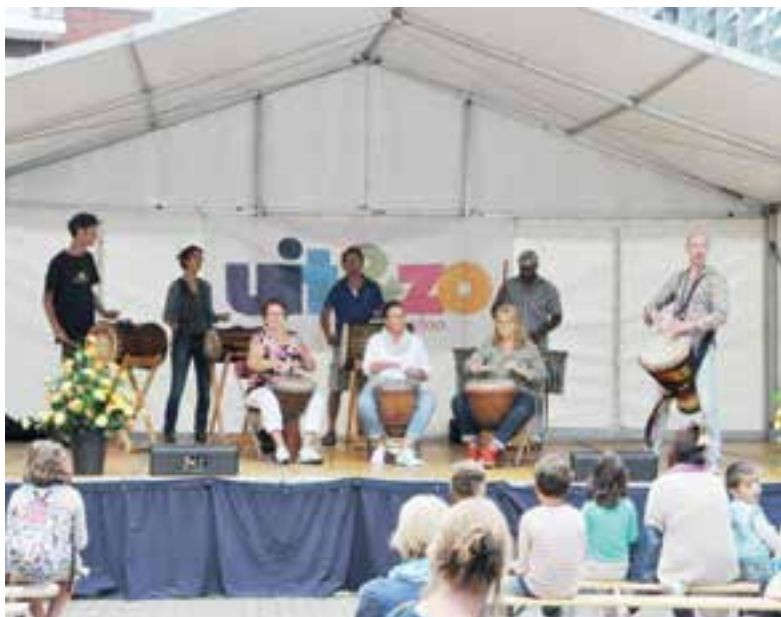
Dit jaar een Open Podium, dus laat je zien aan de andere inwoners van Heiloo!