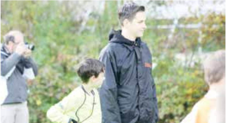
Een opkikker voor de opleiding van jeugdige scheidsrechters.

mulier downloaden via www.stichtingxopx.wordpress.com of ophalen in onze kringloopwinkel Keer op Keer, Rijksweg 127, Limmen. Openingstijden: dinsdag, donderdag en zaterdag van 10.00 tot 15.00 uur, tel. 072-5325962.