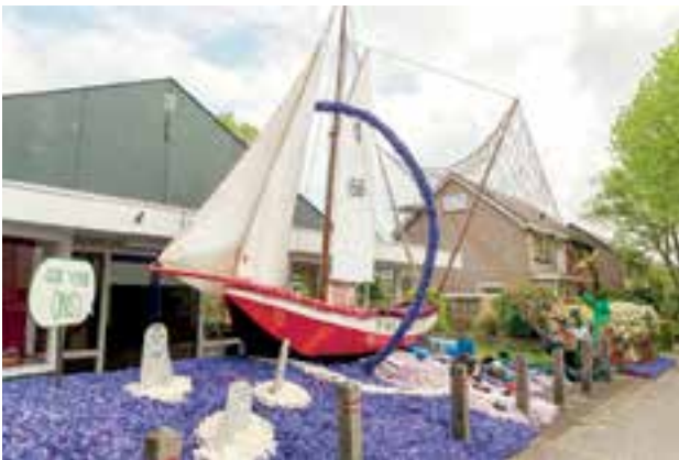
Er is weer veel moois te zien dit jaar.