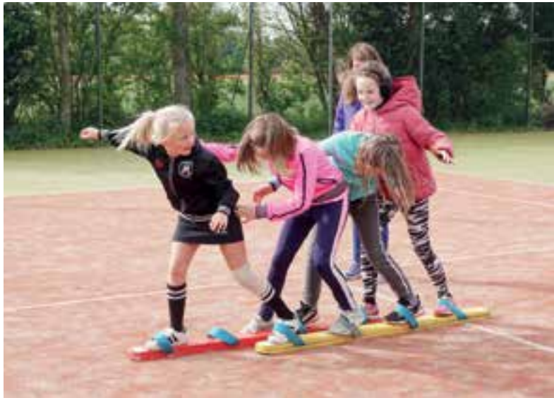
Lol met leuke spelletjes.

won in de 'Vrije categorie' de bronzen narcis voor hun kunstwerk over de plastic soep. Zaterdagavond was de prijsuitreiking waarbij het tot het laatste moment spannend bleef. Een luid gejuich steeg op toen de hoofdprijs bekend werd gemaakt. De zaal in Heeren van Limmen zat stampvol en iedereen was in opperbste stemming. De twee nieuwe prikploegen hebben nu al aangegeven dat ze volgend jaar zeker weer meedoen.