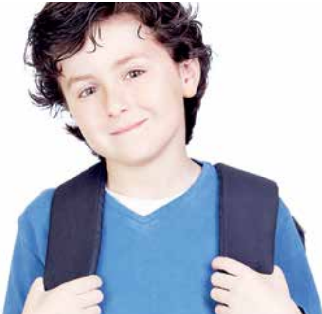
Vol zelfvertrouwen naar de brugklas!

De workshop van Forte Kinderopvang en Happy Homework vindt plaats in Alkmaar en wordt tegen een sterk gereduceerd tarief aangeboden. Voor 30 euro (excl. 2,95 servicekosten) in totaal kunnen de kinderen 4 sessies volgen. De robotfun is hierbij inbegrepen! De workshop wordt aangeboden op woensdag 15 mei t/m woensdag 5 juni, of op woensdag 12 juni t/m woensdag 5 juli. Koop snel je kaartjes voor deze workshop, want vol is vol! Meer informatie en tickets via fortekinderopvang.nl/experience .