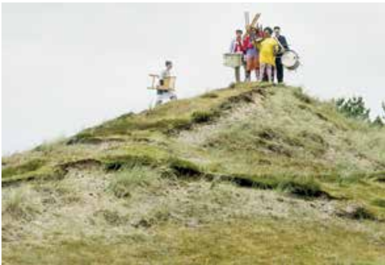
Het Karavaan Festival komt naar Heiloo.

Het festivalhart is dit jaar in het groene Victoriepark Alkmaar, hier kom je dagelijks voor gratis straattheater, livemuziek, het pop-up restaurant ‘Tineke Kookt’, workshops en Tentjestheater. Kijk voor info op karavaan.nl .