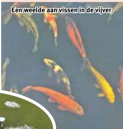
Een weelde aan vissen in de vijver.