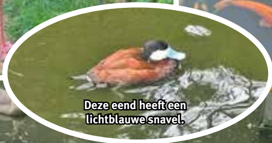
Deze eend heeft een lichtblauwe snavel.