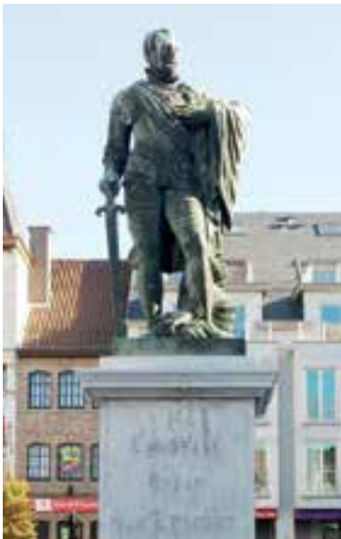
Het beeld van Lamoraal in Zottegem.