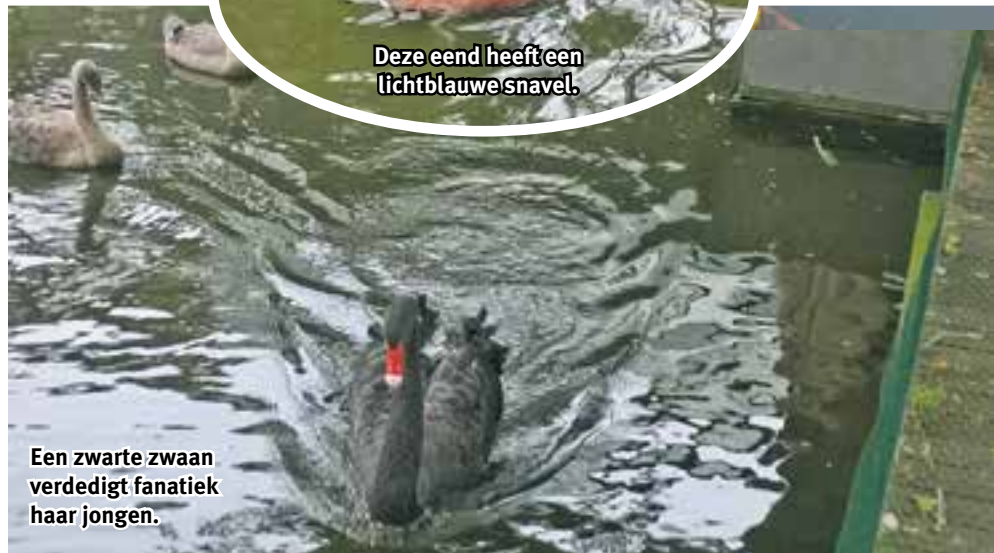
Een zwarte zwaan verdedigt fanatiek haar jongen.