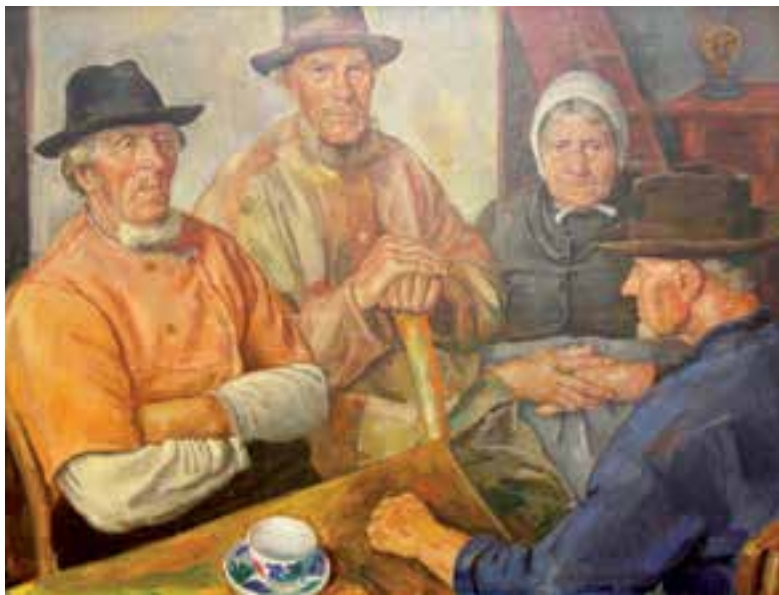
'Egmonders', 1933. Schilderij van Roeland Koning.

De lezing vindt plaats in bezoekerscentrum Huys Egmont (Slotweg 46) en begint om 20.00 uur. Kaarten kosten € 5,- en zijn te reserveren via de website www.huysegmont.nl/agenda of telefonisch op 06-51689620 (Martijn). Koffie is bij de lezing inbegrepen.