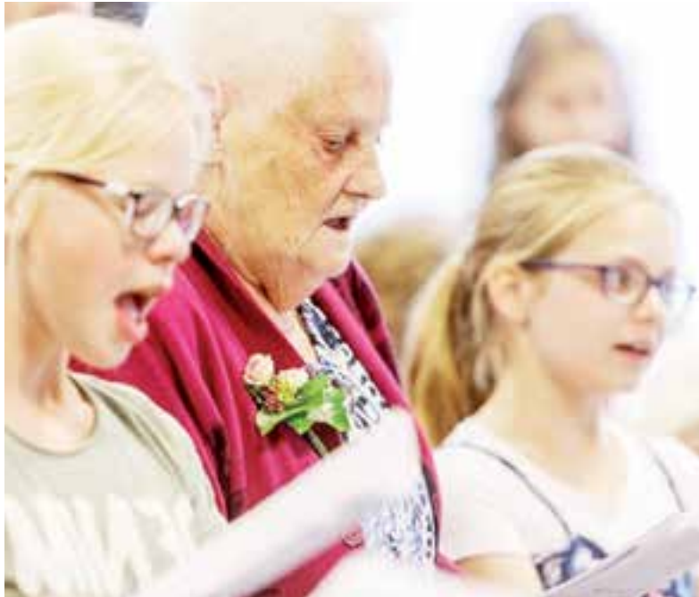
Alle generaties zingen!