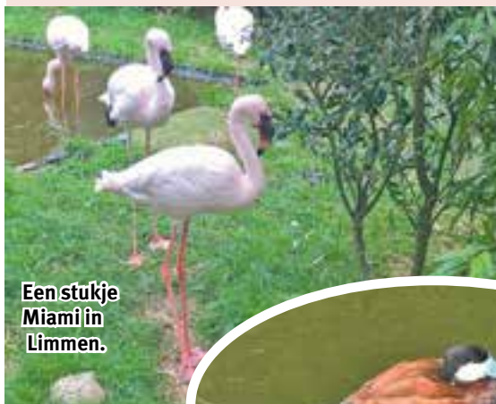
Een stukje Miami in Limmen.

der Velden in een van de vele heerlijke zithoeken in de tuin onder een kakofonie van getijl en inheemse geluiden. Mevrouw Van der Velden maakt als hobby glazen kunstwerken die ook pronken in het zonnetje in de weelderige tuin. Met talrijke volières, watervalletjes en niet te vergeten de drie schattige teckeltjes is het een bijzonder gezellige beestenboel bij de familie.