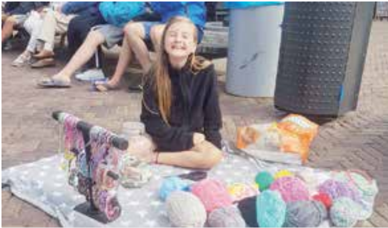
Liv in actie.

Volgens (onbevestigde) bronnen ontstond de brand donderdagmiddag op het terras van De Klok tijdens het verwisselen van gasflessen van de terrasverwarming. Meerdere mensen probeerden tevergeefs met brandblussers het vuur te bestrijden, de vlammen verspreidden zich razendsnel. In no time stond het hele restaurant in vuur en vlam, evenals de bovenliggende appartementen. Twee mensen raakten tijdens de brand lichtgewond. Veel