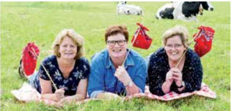
De drie boerinnen heten u van harte welkom.

De dames heten je graag van harte welkom! Deelname € 2,50 per persoon. Voor meer informatie en inschrijven zie www.boerentoertje.nl . Schrijf je snel in want vol is vol!