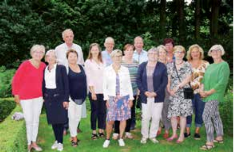
De vrijwilligers van Stichting Vrijwilligers Palliatieve Terminale Zorg Heiloo. Aangeleverde foto

De koffie en thee staan voor u klaar. Hopelijk tot ziens op 23 of 28 augustus. Kijk ook op www.terminalezorgheiloo.nl . Tel. Coördinator: 06-17967389.