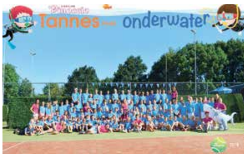
De deelnemers van het open jeugdtoernooi.

De organisatie wil alle deelnemers bedanken voor hun enthousiaste en sportieve deelname en hoopt iedereen volgend jaar tijdens de eerste week van de zomervakantie weer te zien!