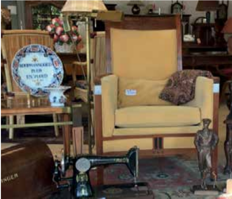
Een greep uit de enorme collectie.

te fotograferen voor de online verkoopsites. Dochter Hetty heeft dit op zich genomen en hoort leuke reacties: “Bijvoorbeeld het jongetje dat langsfietste en tegen zijn vader riep: kijk pap, het is net een museum”. Bezichtigen kan op afspraak. U kunt mailen naar h.corazon@hotmail.com of whatsappen naar 06-54708018.