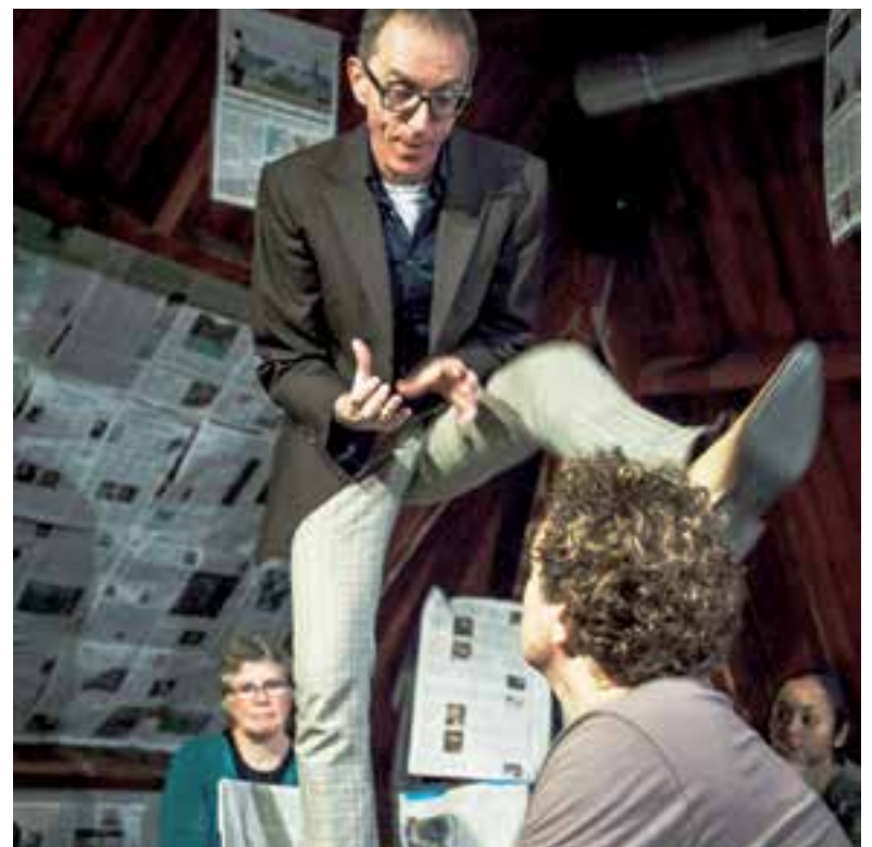
Voorstelling ZOT! (2013) van De Theaterbeweging.