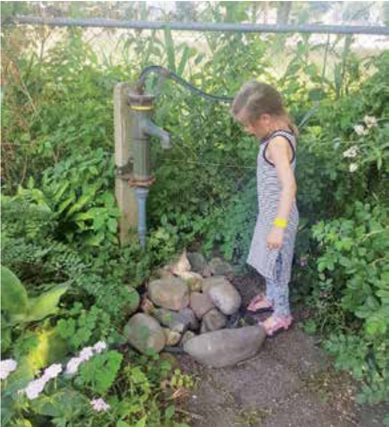
De activiteiten staan in het teken van de natuur. Aangeleverde foto

Meer informatie of uw kind(eren) deze vakantie nog inschrijven voor één of meerdere dagen? Neem gerust contact op met de centrale administratie van Kits Oonlie op 072-5323576 of via info@kits-oonlie.nl.