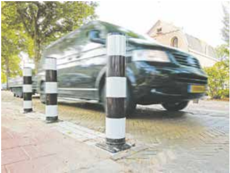
De paaltjes aan de Stationsweg.

Kortom, zoals er op Facebook staat geschreven - de paaltjes blijven. Of men daar nou tevreden mee is of niet; de aangepaste versmalling op de Stationsweg is veiliger voor fietsers. De woordvoerder van de gemeente spreekt: "We blijven de situatie kritisch monitoren. En grijpen in of nemen passende maatregelen, indien noodzakelijk."