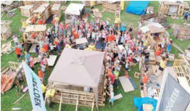
Timmerdorp Heiloo, een onvergetelijk evenement.

Wilt u ook in aanmerking komen voor een donatie? U kunt het formulier downloaden via www.stichtingxopx.wordpress.com of ophalen in onze kringloopwinkel Keer op Keer, Industrierrein Oosterzij 17 (hoek Nijverheidsweg), Heiloo. Openingstijden: dinsdag, donderdag van 10.00 tot 15.00 uur en zaterdag van 10.00 tot 14.00 uur, tel. 072-5325962.