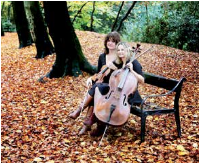
Prima Donna Musica.

contant geld meeneemt! Datum: zondag 19 augustus van 15.00 - 16.00 uur. Locatie: de Comédie op Landgoed Nijenburg, ingang vanaf Heiloo gezien het pad dat achter het eerste hek begint, rechts van het hoofdhuis. Er is geen tribune, neem zelf een kleedje, kussentje of laag stoeltje mee om op te zitten. Bij erg slecht weer wordt het concert een week opgeschoven. Check kort van tevoren de website van Natuurmonumenten nog even!