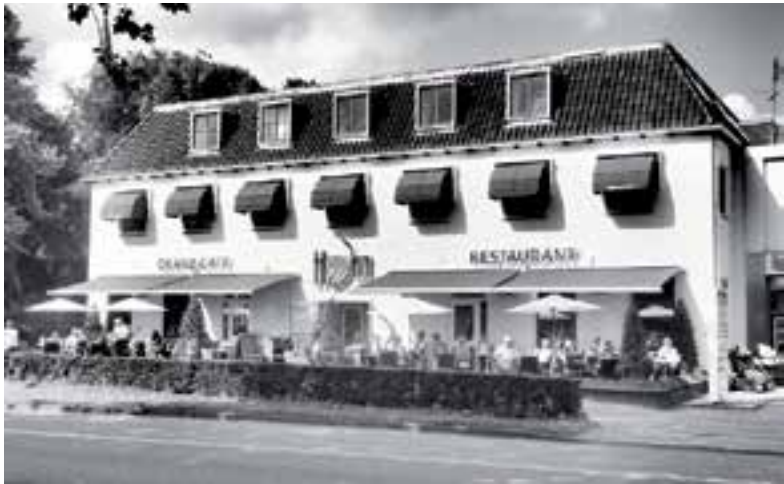
Het fraaie terras van Herberg Jan, daar fiets je voor om!