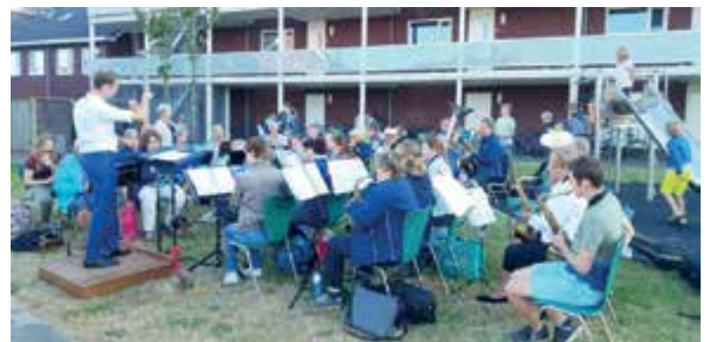
Het optreden vorig jaar bij De Melksuiker.

Van de leerlingen kunt u een aantal korte, afwisselende nummers uit de reeks 'The Zoo Ball' verwachten. Het grote orkest van De Harmonie zal verschillende nummers laten horen die het zomergevoel zeker zullen laten ontbranden. Het concert start om 19.00 uur.