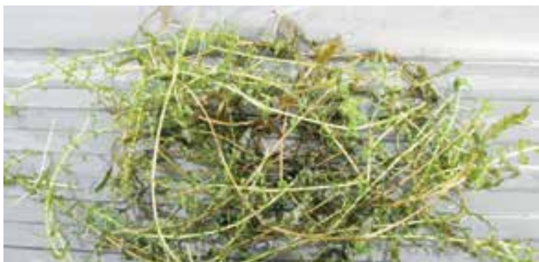
De waterplanten worden gemaaid.