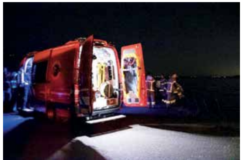
Brandweer en andere hulpverleners kwamen in actie.

Hulpdiensten kwamen massaal in actie nadat een melder twee noodsignalen had gezien vanaf Akersloot in de richting van De Woude. Volgens een agent was er ook geschreeuw vanaf het water gehoord. Een politieboot, twee brandweerboten, duikers van de brandweer uit Velsen en een politieheliokopter kwamen ter plaatse. Later werden ook de brandweervrijwilligers van Uitgeest gealarmeerd om uit te varen met de brandweerboot. Er werd een zoekactie op touw gezet om te achterhalen wie er in nood was. Nabij het schiereiland Sakerlei in het Alkmaardermeer werden twee boten aangetroffen waarvan de