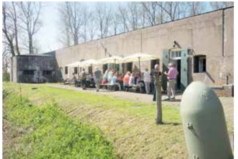
Fort aan den Ham in Uitgeest.