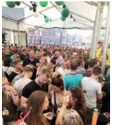
Het was in 2018 volle bak tijdens het deuren. Dit jaar weer?