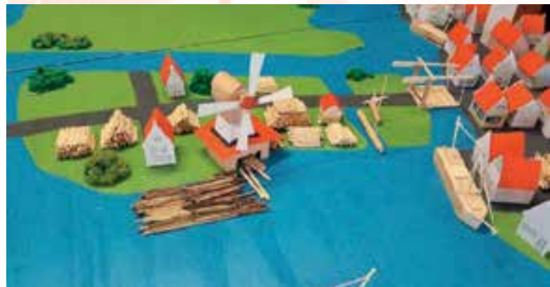
Een maquette van het jaar 1600.