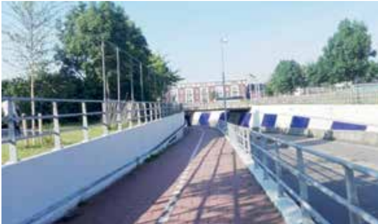
De Kleistunnel in Uitgeest.