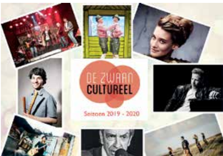
De Zwaan pakt uit in het nieuwe seizoen.

Naast dit kleurrijke programma heeft De Zwaan Cultureel een compleet vernieuwde website. Naast de nieuwe lay-out is de belangrijkste verandering dat kaartjes voor alle voorstellingen voortaan online gereserveerd en direct via iDEAL betaald kunnen worden.