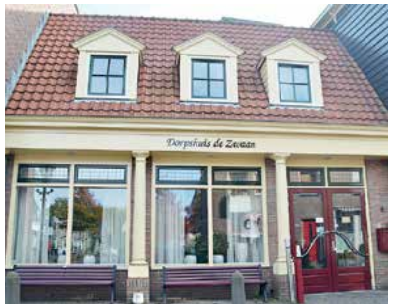
Dorpshuis de Zwaan.

Op woensdag 10 juli is er geen viering in de kapel i.v.m. de kermis.