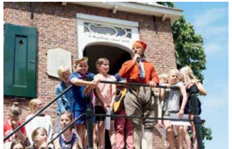
Cornelis Corneliszoon Dag bij Het Regthuys in Uitgeest.

De leerlingen zongen over Corneliszoon, ze toonden een maquette van Uitgeest in 1600 en vertelden over het belang van de uitvinding van de houtzaagmolen. De zon op dit historische pleintje, het verhaal van de kinderen en het toegestroomde publiek maakten het geheel tot een succes. Volgend jaar is er voor alle basisscholen in Uitgeest lesmateriaal over Corneliszoon beschikbaar en kunnen andere scholen deze Corneliszoon Dag vormgeven.