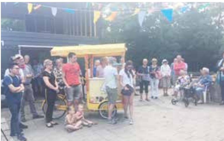
Veel belangstelling voor de viering van het 55-jarig bestaan.