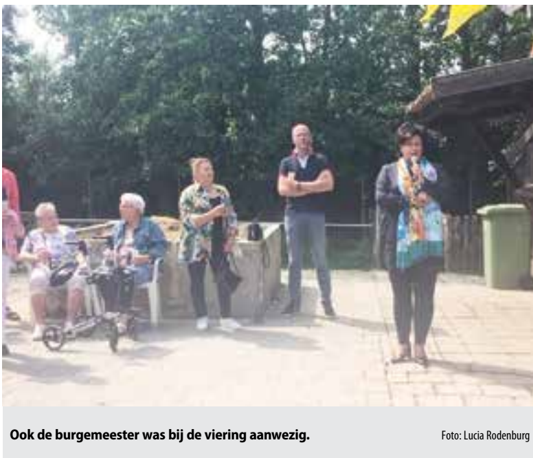
Ook de burgemeester was bij de viering aanwezig.