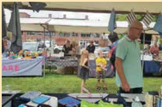
De zomerbraderie is zeer goed verlopen.

De nieuwe locatie op het gras naast boekhandel Schuyt viel gelukkig in de smaak bij de standhouders, de organisatie en de bezoekers van de zomerbraderie. "Erg sfeervol, zo op het gras", aldus een van de bezoekers. De belangstellenden liepen gezellig in het zonnetje tussen de kramen door en de standhouders deden goede zaken.