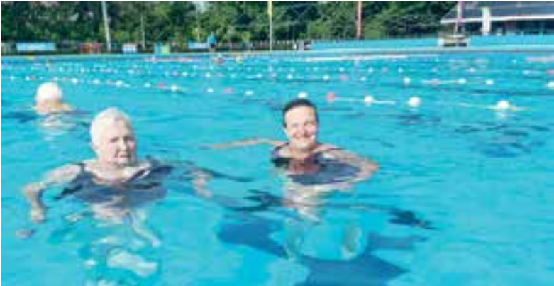
Zwemvierdaagse groot succes.

https://www.uitgeester.nl/pagina/privacy