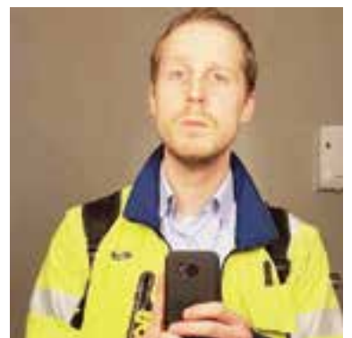
'De Meester', zoals iedereen hem kent via zijn Facebookpagina.

Zijn vijfde blog ging weer viral, hij schreef deze op 18 maart. De ov-staking die op deze dag stond gepland, werd overschaduwd door de aanslag in de tram in Utrecht. Het eerlijke verhaal van de bloggende machinist werd wederom opgepikt door de media. Zelfs de redactie van de talkshow van Eva Jinek liet van zich horen, maar door het drama later op de dag werd zijn tv-debuut uitgesteld. Maar wat niet is kan nog komen, 'De Meester' en zijn blogs zijn hot en heel Nederland heeft zijn pijlen op hem gericht. Lees verder op pagina 7.