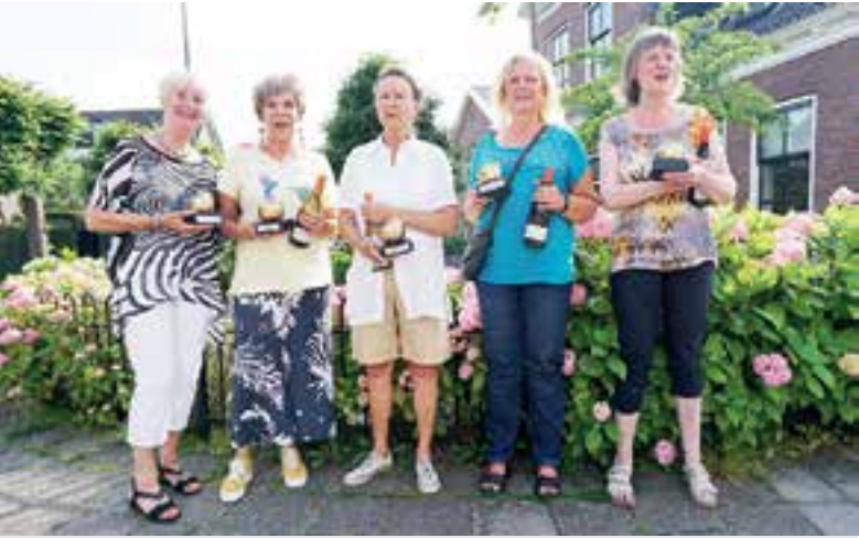
Op de foto ontbreekt de winnaar van de publieksprijs in de categorie 'Schilderijen', mevrouw Gre Beemer.

het dagelijks bestuur van de AHB Uitgeest zeer veel dank daarvoor.