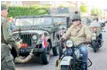
De oude voertuigen trokken veel bekijks.