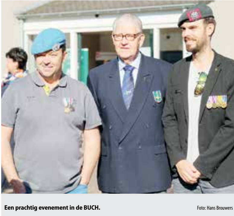
Een prachtig evenement in de BUCH.

De regionale Veteranendag is bedoeld om (hernieuwd) kennis te maken en bij te praten met mensen die dezelfde ervaringen delen. Naast de onderlinge kennismaking staat de dag natuurlijk in het teken van waardering voor het bijzondere werk van de veteranen. De regionale Veteranendag wordt jaarlijks georganiseerd, een week voorafgaand aan de Nederlandse Veteranendag. De stoet historische legervoertuigen trok op zaterdagochtend door Uitgeest en Castricum. De colonne begon om 09.00 uur in Uitgeest en via de omliggende dorpen eindigde de rit bij het gemeentehuis van Castricum. Lees verder op pagina 4.