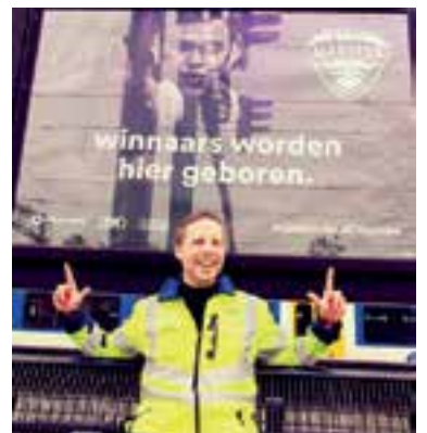
'De Meester' op zijn favoriete treinstation.

Jumbo opent op wo 3 juli om 9.00 uur UW JUMBO VERBETERT