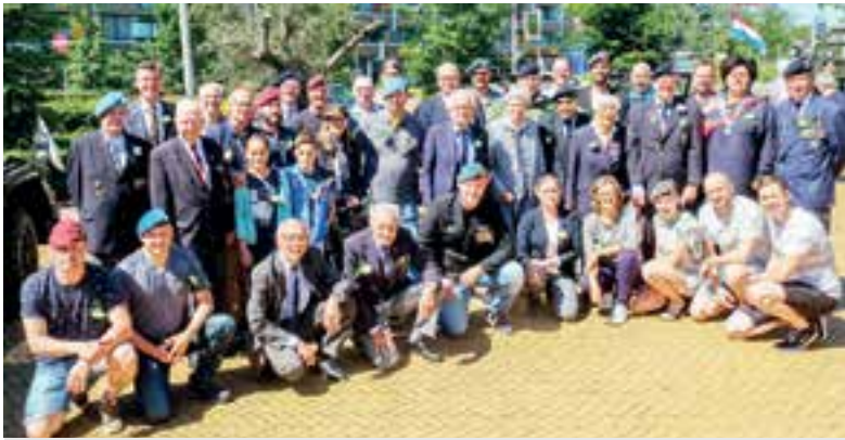
Alle deelnemers van de lokale Veteranendag.

"Sommige gemeenten organiseren de dag wat minder uitvoerig, maar hier in Uitgeest en Castricum wordt er uitgebreid aandacht aan besteed en wordt er echt uitgepakt, mag ik wel zeggen. Dat waarderen wij zeker."