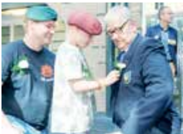
Jong en oud was aanwezig tijdens de lokale Veteranendag.