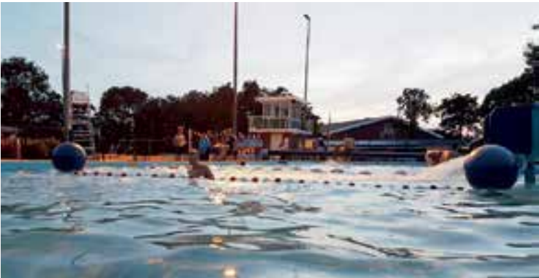
De Zien in Uitgeest.