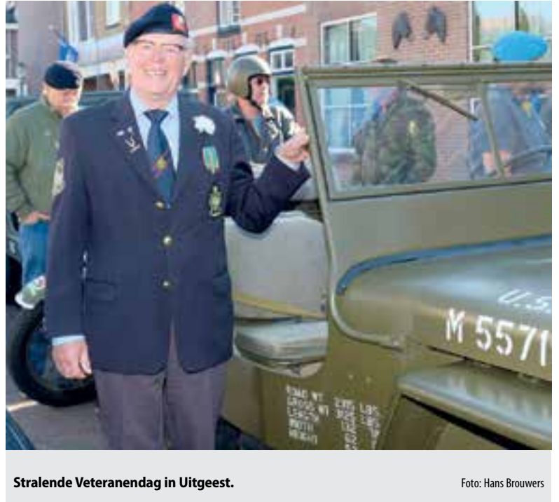
Stralende Veteranendag in Uitgeest.