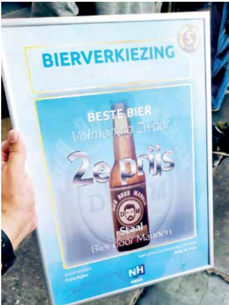
De prijs voor de bierbrouwers uit Uitgeest.