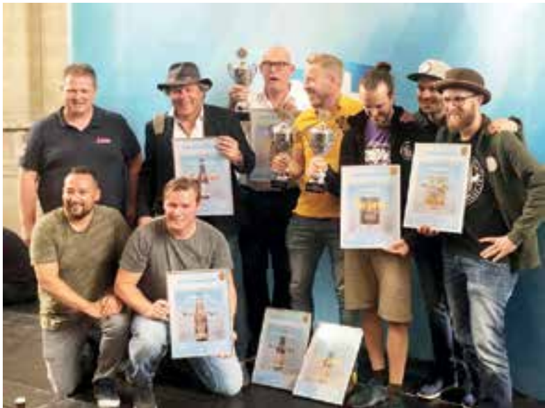
Alle winnaars van de Noord-Hollandse Bierwedstrijd.

Nadat na maanden brouwen in de keuken het recept was vastgesteld besloten de mannen de stoute schoenen aan te trekken. "We zijn naar De Noord-Hollandse Bierbrouwerij in Uitgeest gegaan. Daar hebben we ons idee uitgelegd en we konden er in een groot volume brouwen," vertelt Roderick. Eind augustus 2018 heeft het drietal ruim 500 liter bier gebrouwen. "Dat was in paar weken uitverkocht.