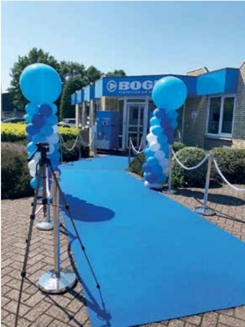
Het pand van Boge Kompressoren.