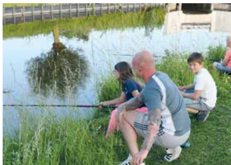
De vangst was goed tijdens de derde jeugdvisdag.

Maandag 25 juni vindt alweer de laatste jeugdwedstrijd plaats. Ieder kind mag gewoon meedoen, ook als hij de voorgaande wedstrijden heeft gemist. Zoals altijd worden op de slotdag de grote bekiers uitgereikt. De nummers 1 tot en met 3 van het algemene klassement mogen een mooie trofee in ontvangst nemen. Mis de grote finale dus niet. Deelnemen kost slechts € 1.