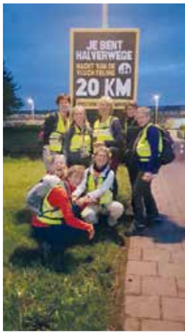
De dames zijn op de helft.

"De loop start altijd om klokslag 12.00 uur 's nachts en dat is om aandacht te creëren voor het lot van de vluchtelingen. Ook zij lopen vaak 's nachts. Wij weten nog waar we heen moeten maar vluchtelingen weten dat niet, ze weten niet hoe lang het gaat duren en ze trainen er ook niet voor. Het is dus ook bedoeld als een stukje