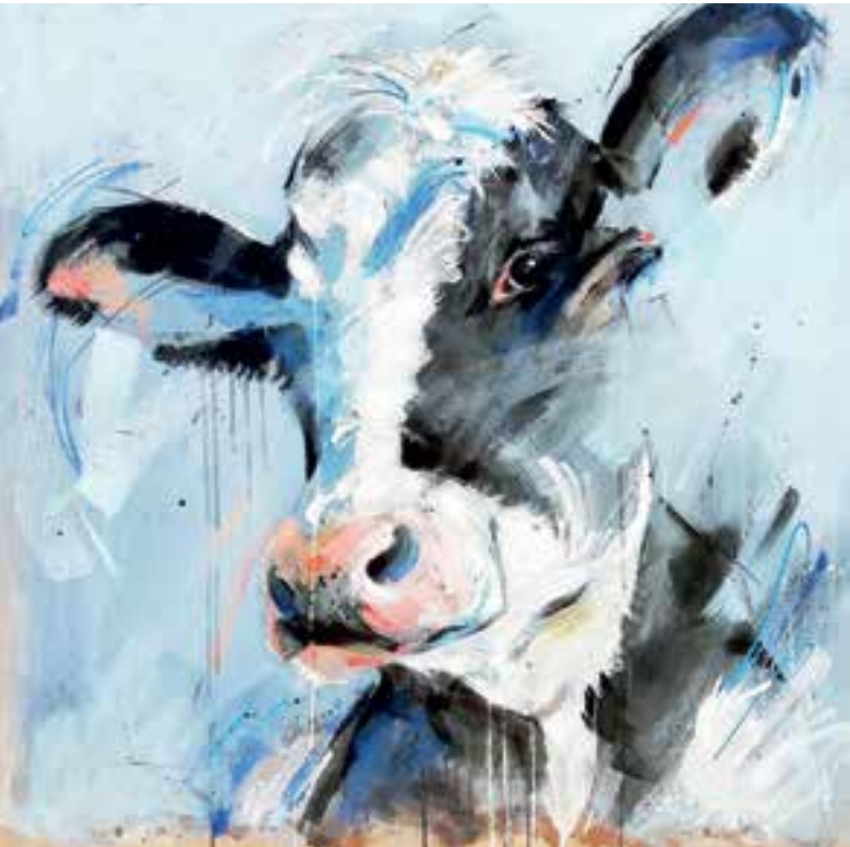
Werk van Kitty Meijering.

Tijdens uw bezoek wordt u in de gelegenheid gesteld om uw waardering over de tentoongestelde werkstukken kenbaar te maken. De werkstukken zijn hiertoe in twee