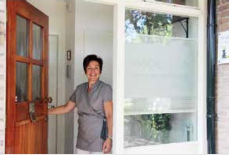
Zomer bij Mooier DAN.

Uw favoriete producten mee op vakantie? Dat kan, ik heb