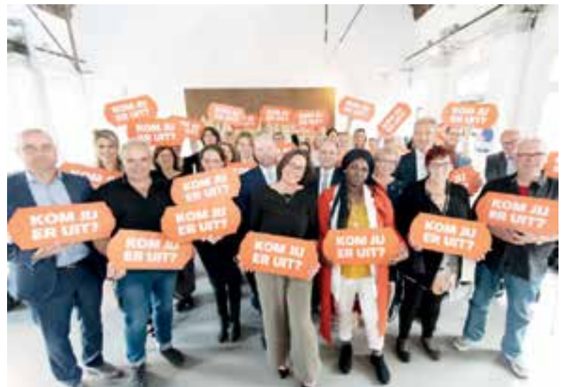
Uitgeest sluit aan bij de campagne 'Kom uit je schuld'.