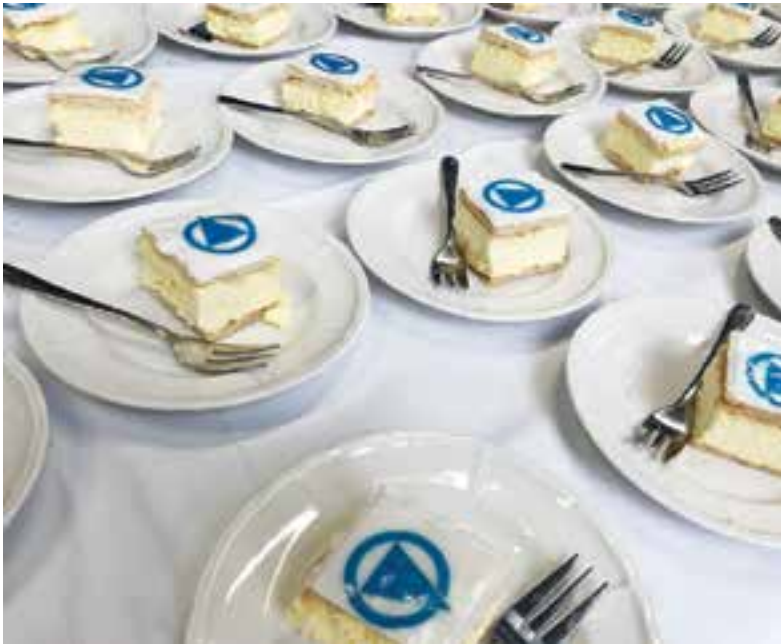
De feestelijke gebakjes stonden klaar.

Waar hij er in Groot-Brittanië vier jaar over deed om zijn bedrijfspan te verhuizen was dit in Uitgeest in nog geen halfjaar gepiept. "Het hoofdkantoor in Duitsland zag ook gelijk de potentie van het pand op het mooie bedrijventerrein in het centraal gelegen Uitgeest. De vergunningen waren ook snel geregeld, de samenwerking met de gemeente verliep prima," aldus de General Manager Northern Europe van Boge Kompressoren BV.