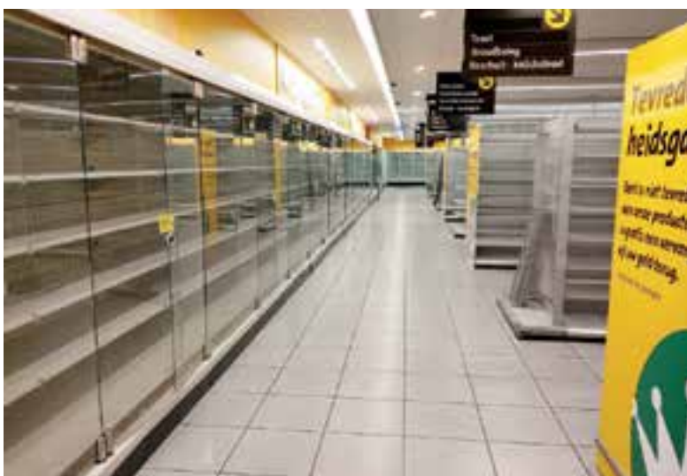
De winkel was zaterdagavond compleet leeg en verlaten.

De komende twee weken ondergaat de supermarkt een complete metamorfose. Woensdag 3 juli gaat de vernieuwde en verbouwde supermarkt weer open voor het publiek.