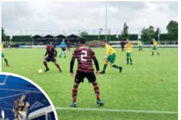
Balbezit Flamengo maar Lester duikt er gelijk op af.