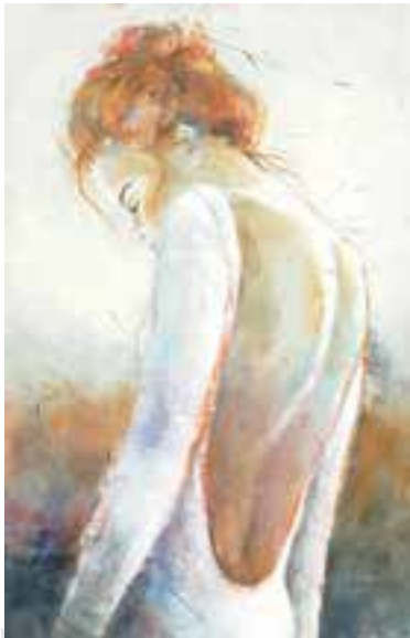
Werk van Kitty Meijering.

dynamisch effect, waarmee zij een brug weet te slaan tussen klassiek en modern. Haar schilderijen zijn allemaal geschilderd met acrylverf op linnen doek of paneel. Wellicht bent u het werk van Kitty ook weleens tegengekomen in het buitenland. Van een aantal van haar schilderijen worden kunstdrukken en ansichtkaarten wereldwijd verspreid. Haar werk heeft ze al in vele galleries kunnen exposeren. Momenteel worden enkele doeken geëxposeerd in Los Angeles. Ze neemt regelmatig deel aan verschillende kunstbeurzen en kunstmarkten door het hele land. Een leuk weetje is dat Kitty dit najaar zal starten met het geven van teken- en schilderles bij stichting de Nieuwe Kuil in Uitgeest. De lessen zullen worden gegeven op woensdagochtend en woensdagmiddag. Tijdens de kunstroute exposeert Kitty in Het Regthuys. www.kittymeijering.nl .