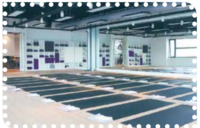
Hot Yoga bij Victorie Plaza.

Spieren zijn flexibeler, er is minder kans op blessures en door de warmte ontdoet je lichaam zich van afvalstoffen. Probeer ons proefabonnement voor slechts 27,50 en ontdek welke yogavormen jou het best liggen. Yoga is voor iedereen: jong, oud, man, vrouw, lenig, stijf, energiek, vermoeid of zwanger. Iedereen is welkom! www.victorieplaza.nl