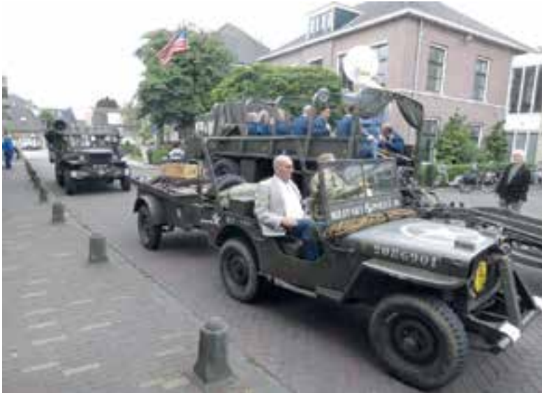
Regionale Veteranendag komt er weer aan.

https://www.uitgeester.nl/pagina/privacy