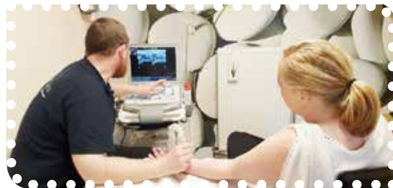
Bij Fysioview kunt u terecht voor een echografieconsult.

Wij nemen contact met hen op om de vraagstelling duidelijk te krijgen en zullen u na afloop een