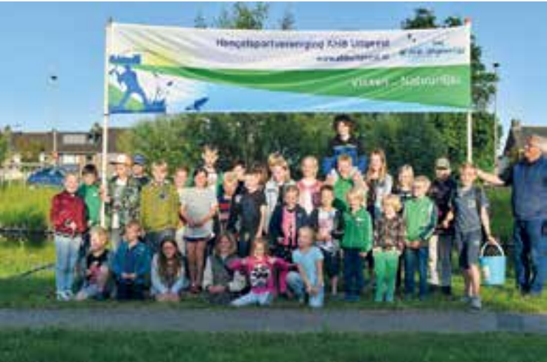
Aangemoedigd door familie en kennissen maakten de kinderen er een spannende strijd van.

Amsterdam werd natuurlijk niet overgeslagen: de Brazilianen gingen vrijdag cultuursnuiven in de grote stad, en ook dat was een heel avontuur voor de mannen. Ze genoten van de architectuur en waren vooral onder de indruk van de bouwstijl van het Centraal Station. Ook vielen de fietsende mensen op. Dit vonden ze echt heel grappig, ze associëren fietsen met de gezonde leefstijl van de Nederlanders. Terwijl de Brazilianen door de straten van Amsterdam liepen roken ze een lucht waar de stad in het buitenland bekend om staat: de geur van nederwiet. "Wij zijn dat niet gewend, blowen is illegaal in Brazilië. We hebben de spelers van tevoren gewaarschuwd voor de gevaren van softdrugs. It's big trouble for sport," vertelt Arthur streng maar toch vermakelijk. Zondag stonden het Anne Frank Huis en de Heineken Experience op het programma, daar kwamen ze vrijdag niet meer aan toe.