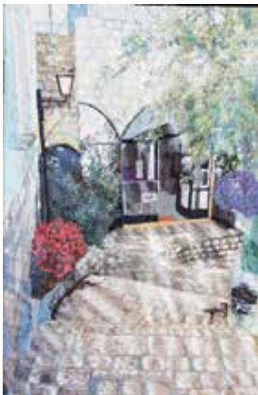
Werk van Saskia Weishut-Snapper.

verrassende effecten vertoont. Ritme, structuren, kleur, verbeelding en sfeer zijn de voornaamste kenmerken van mijn werk. Geliefde onderwerpen zijn onder andere fantasiegebouwen en -landschappen. Ook maak ik vaak 'Spielereien' met diverse materialen, kleuren en vormen. Ik wil mijn publiek afleiden van de ellende overall ter wereld. Gebruikmakend van een arsenaal aan garens, allerhande stoffen en acrylverf schep ik met mijn naaimachine textiele landschappen, fantasiegebouwen en meer. Ik exposeer regelmatig in binnen- en buitenland en heb diverse prijzen gewonnen. In het Joods Museum Berlijn staat een huwelijksbaldakijn die ik vervaardigde voor de permanente collectie traditionele voorwerpen. U bent van harte welkom in de protestantse kerk. www.saskia.weishut.com .