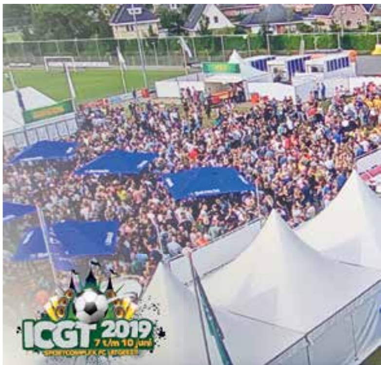
Zo'n 12000 bezoekers op Sportpark de Koog tijdens het ICGT 2019