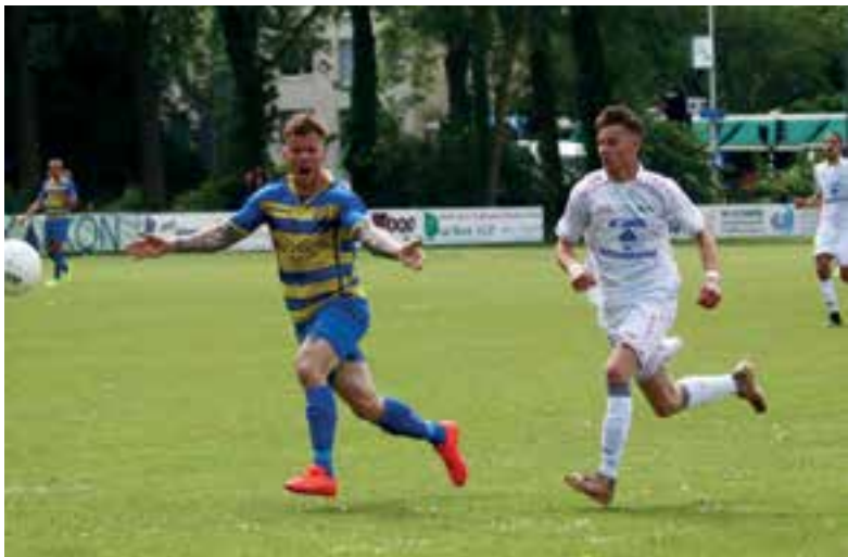
FC Uitgeest in actie tegen FC Boshuizen.