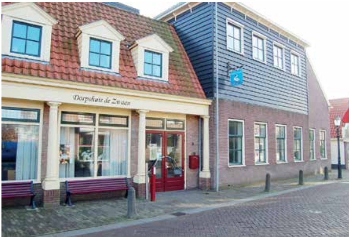
Het gebouw van De Zwaan in Uitgeest.

De gemeenteraad besloot op 28 februari om drie opties te laten onderzoeken. Lees verder op pagina 4.