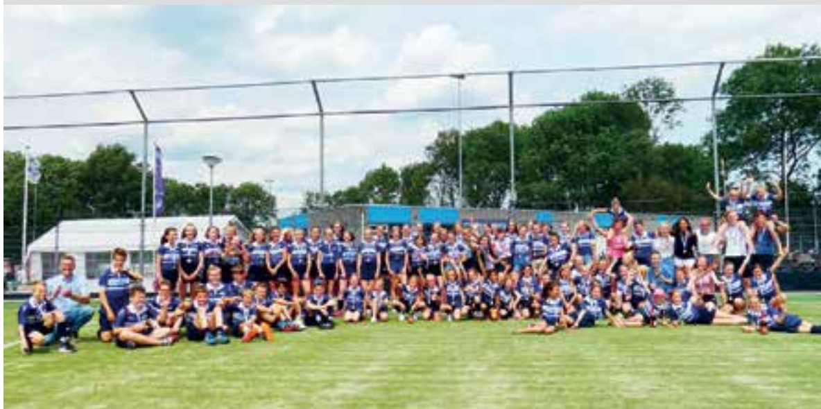
Heel veel kampioenen bij MHCU.