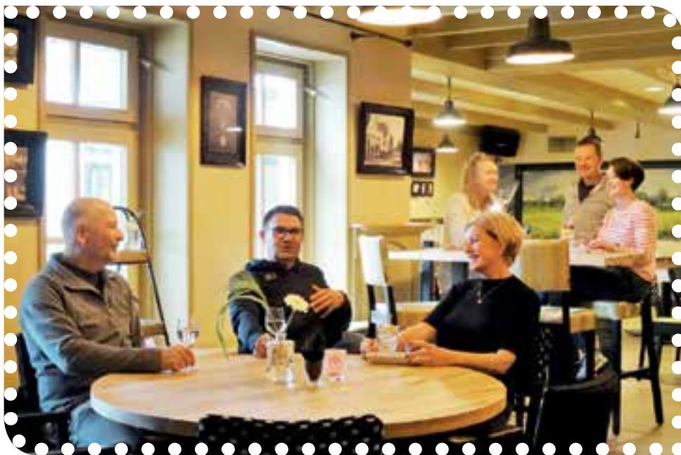
Sfeervolle metamorfose van 't Achterom.