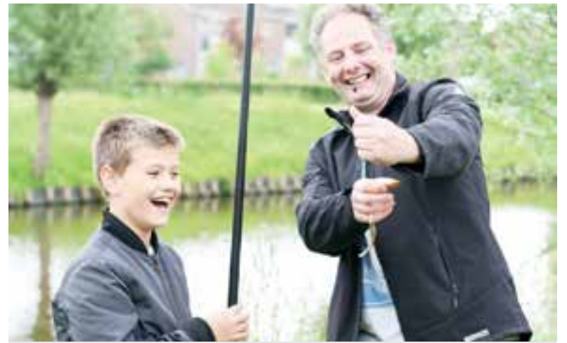
Veel plezier tijdens de eerste jeugdviswedstrijd in Uitgeest.

De werving van een nieuwe ondernemer is een initiatief van Recreatie Noord-Holland, de beheerorganisatie van het recreatiegebied Alkmaarder- en Uitgeestermeer. Geïnteresseerde ondernemers kunnen hun visie indienen. Na beoordeling wil Recreatie Noord-Holland in juli bekendmaken met welke partij(en) deze visie(s) verder worden uitgewerkt. De uiterste datum voor het indienen van een visie is 8 juli 2019 voor 12.00 uur.