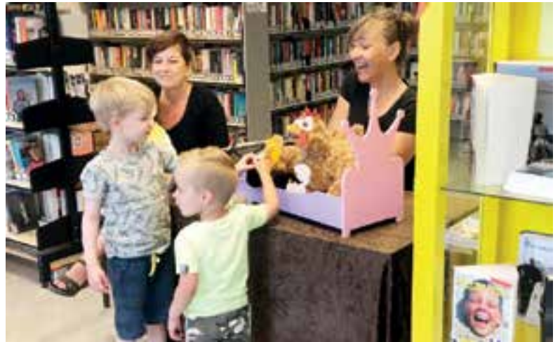
De kinderen vermaken zich prima.

Zo werd er ditmaal spaghetti gekookt in Lees Lokaal, werden er wollen truitjes gebreid, en werd er zelfs een kuil gegraven voor het ei waarna het met water werd besproeid. Alles om er maar voor te zorgen dat het kuikentje zo snel mogelijk uit het ei zou komen. Dat geen van deze pogingen succesvol was zal niemand verbazen, maar genieten van het verhaal deden de kinderen wel. Toen Kip uiteindelijk uitgeput in slaap viel gebeurde er een klein