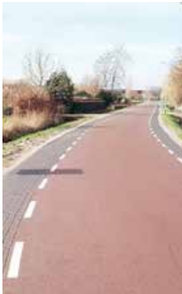
De vernieuwde Uitgeesterweg.

Het bericht leidde tot verontwaardigde reacties. Uit de meeste reacties bleek dat weggebruikers dit een onveilige situatie vinden..