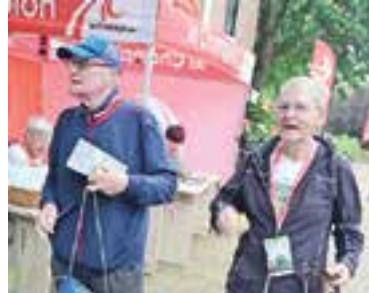
De twee oudste deelnemers.

bolletjes uit en dit werd erg gewaardeerd. Het was een gezellige drukte met een muzikale omlijsting en je kon frisdrank, thee of koffie bestellen. Ook het Regthuys werd veel bezocht. Het wandelweer was volgens vele lopers ideaal.