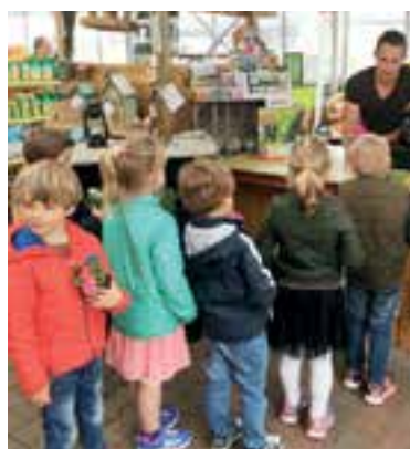
De Wissel op bezoek bij het tuincentrum.

Iedereen was ijverig op zoek naar een plantje met hun lievelingskleur. Het leukste moest nog komen: zelf afrekenen bij de kassa. Als klap op de vuurpijl kregen alle kinderen nog een geranium mee naar huis met daaraan een zakje zaadjes van bloemen die bijen aantrekken. Thuis aan de slag dus met zaadjes planten!