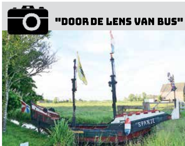
Ger Bus: "Iets te vroeg uit Spanje, wel lekker op tijd..." Gezien langs de Hoogedijk in Uitgeest.

De volledige opbrengst van de badeendjesrace wordt verdeeld over vier kleinschalige, particuliere initiatieven in onze eigen omgeving: 1. De Kindervakantiedag 2019, georganiseerd door Rotary Heemskerk-Uitgeest, 2. Stichting Bij Elkaar Heemskerk, een woonvoorziening voor meervoudig gehandicapte jongeren, 3. Thuisbij Uitgeest, dagopvang voor dementie ouderen en 4. Het 'Kaasvrouwje', zij kookt in verzorgingshuizen en steunt daarmee de Voedselbank IJmond.