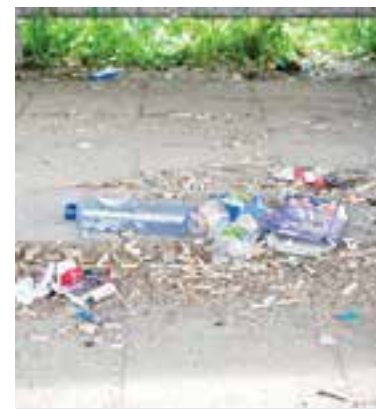
Gaait het zwerfafval toenemen?

incontinentiemateriaal te kunnen deponeren moet alleen wel een brief of verklaring van de apotheek of arts overlegd worden aan de gemeente. Voor wie liever niet met deze materialen over straat wil bestaat de mogelijkheid om 10 keer per jaar kosteloos dit restafval in de grijze container aan te bieden. Of, bij hoogbouw, 60 inworpen in de ondergrondse container.