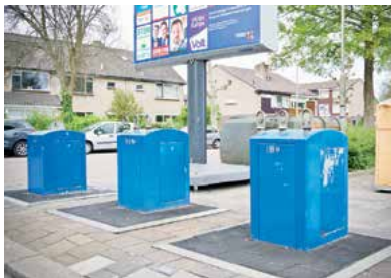
De milieuparkjes zullen uitgebreid worden.

De milieuparkjes krijgen een opknapbeurt. De gemeente Uitgeest is namelijk van plan om 8 containers bij milieuparkjes te plaatsen voor opk (oud papier en karton). Als inwoners het opk-afval makkelijker weg kunnen brengen is het best mogelijk dat verenigingen veel minder papier en karton gaan ophalen dan nu het geval is. Maar niet alleen de nieuwe containers gaan minder papier opleveren voor de ophalers. In het nieuwe grondstoffenplan staat ook dat de inwoners om huis-aan-huisbladen en reclame te ontvangen een sticker op de brievenbus moeten plakken. De omgekeerde situatie van nu. Geen sticker plakken betekent dat de inwoner geen huis-aan-huisblad