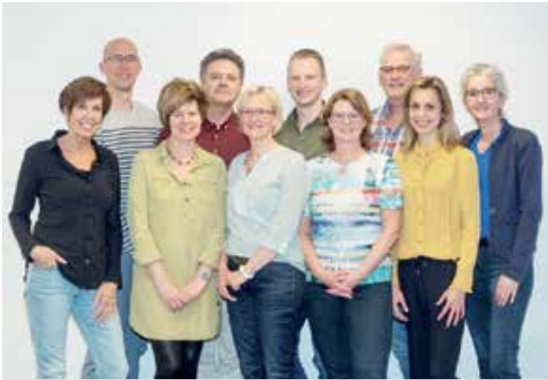
Het team van Fysio Uitgeest.