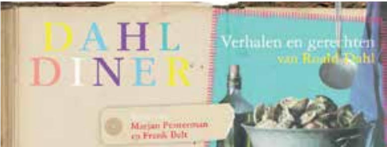
Illustratie gemaakt door Henk Kuiper.

De bus vertrekt om 11.45 uur vanaf Sportpark De Koog en gaat rond 17.00 uur weer terug. Supporters die niet de beschikking hebben over eigen vervoer of die het gewoon leuk vinden worden van harte uitgenodigd mee te reizen. Er geldt wel: "wie het eerst komt, het eerst maalt". Steun uw club en ga mee of kom naar Leiden.