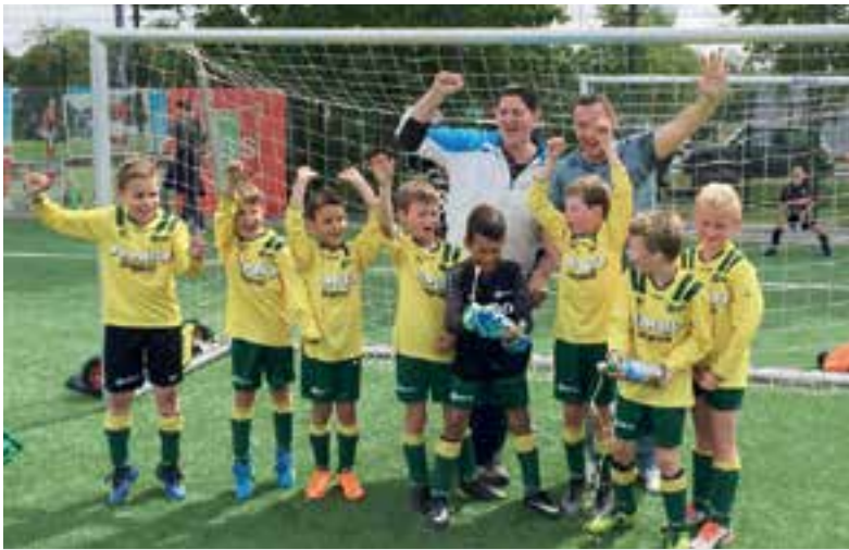
FC Uitgeest JO8-1 kampioen.