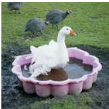
De 'bruidssluiergans' in een badje met water tijdens de herfstdagen. Eromheen tekenen van de modderige ondergrond.

UITGEEST - Sommige inwoners van Uitgeest rijden er wel vier keer per dag langs: het hertenpark aan de Geesterweg. Dit jaar viert het park zijn 55-jarig bestaan.