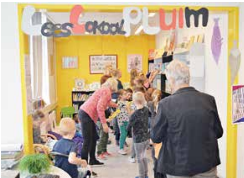
De Pluimen werden uitgereikt door de wethouder.