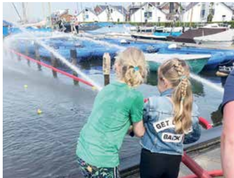
De eendjes werden naar de finish gespoten.