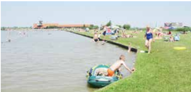
Zomers genieten bij het Alkmaarder- en Uitgeestermeer.

Er zijn zandstrandjes bij recreatieterrein Zwaansmeer en bij Dorregeest in Uitgeest. Kinderen vermaken zich altijd uitstekend aan deze zandstrandjes langs het water waar ze mooie zandkastelen kunnen bouwen. Op de recreatieterreinen staan veel verschillende speeltoestellen en een toiletgebouw. De strandjes zijn hiermee een goed alternatief voor de kust en dichtbij dorpjes in een groene omgeving. Behalve de zandstrandjes liggen er ook grasvelden langs de zwemplekken, hierop kun je heerlijk zonnen en spelen, zonder onder het zand te komen. En op De Hoorne in Akersloot is er zelfs alleen maar gras. Op het water kun je lekker met luchtbedden en