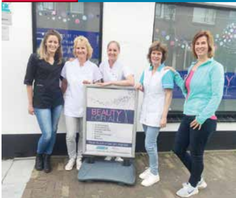
De dames van Beauty for All.

In deze rubriek wordt een bedrijf in het verspreidingsgebied van de Uitgeester en omgeving belicht. De kosten voor Bedrijf Belicht zijn € 145,- ex btw. U kunt zich aanmelden door een e-mailbericht te sturen naar verkoop@uitgeester.nl