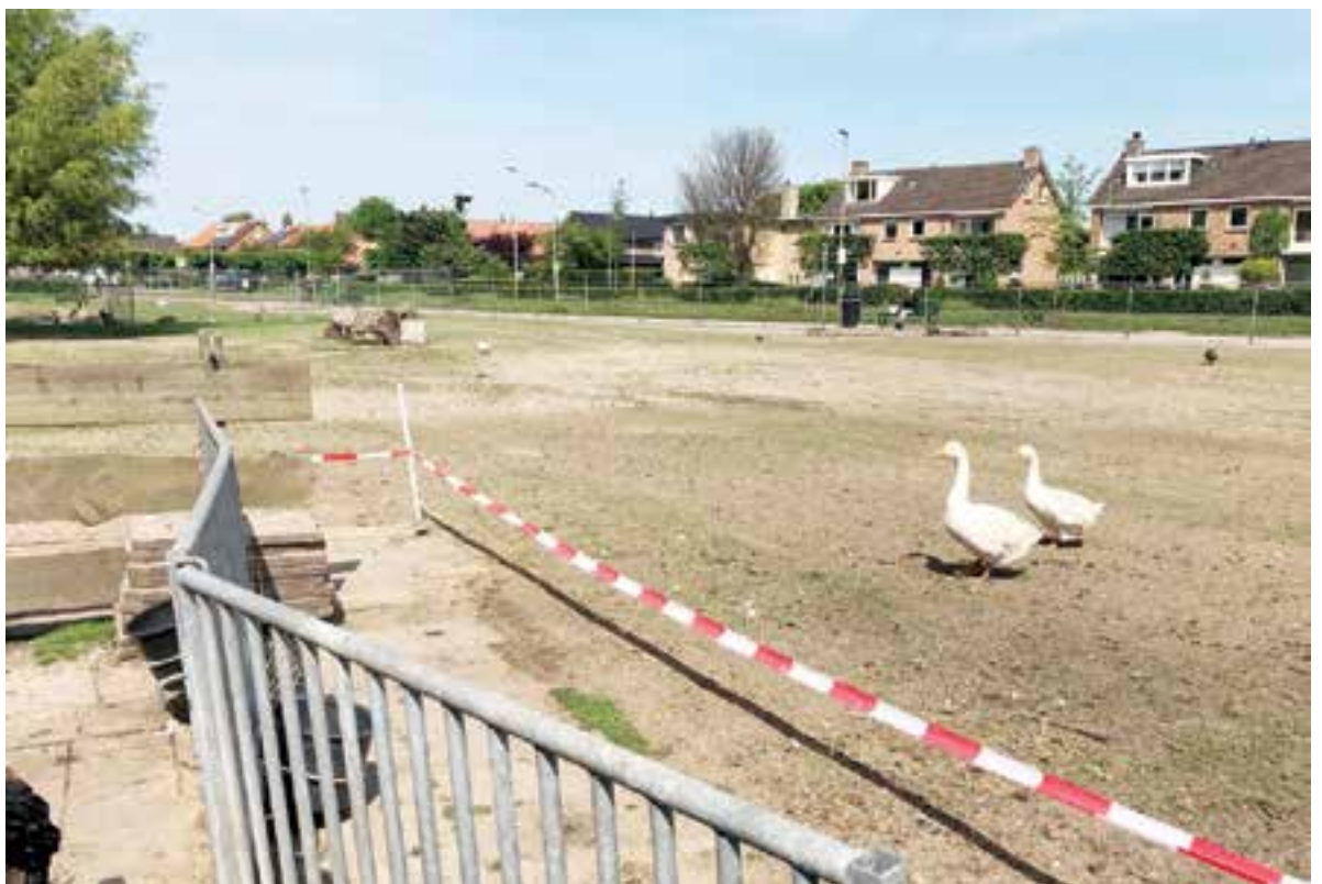
De 'bruidssluiergans' op het afgevlakte en pas ingezaaide grasveld.

Het Hertenspark krijgt een make-over en De Uitgeester was benieuwd hoe het ervoor staat. Meer hierover leest u op pagina 4.