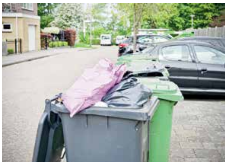
De overvolle grijze container voor restafval is binnenkort verleden tijd.

veranderingen zijn en de eventuele gevolgen. Lees het vervolg op pagina 7.