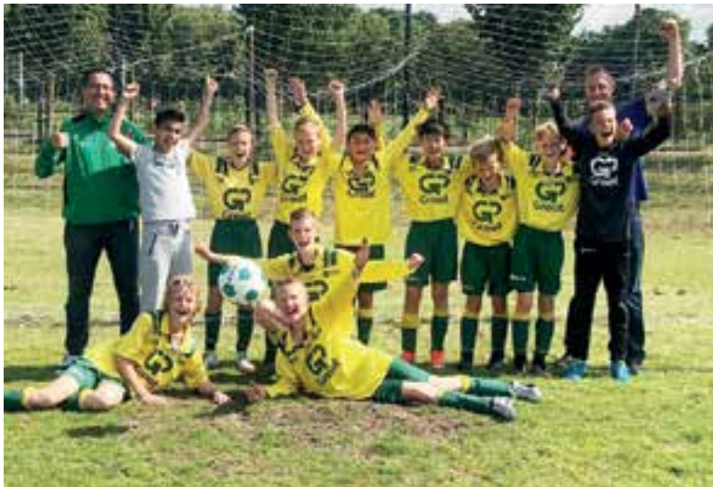
Feest na het winnen van het kampioenschap.