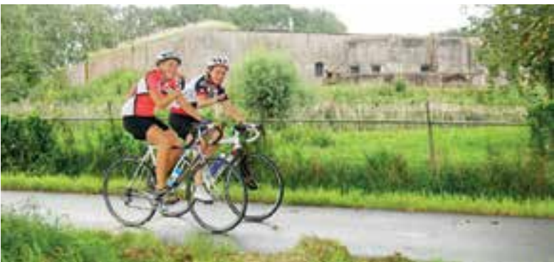
Fietsen voor het goede doel.