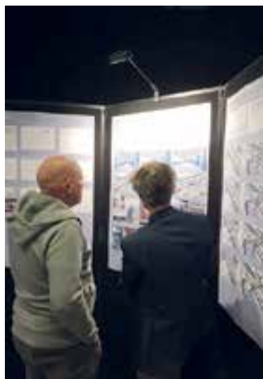
Op panelen waren de diverse varianten te zien.

Op verschillende panelen in de zaal werden de varianten en plannen getoond, waarbij medewerkers van de gemeente en ProRail uitleg gaven. De bezoekers konden al hun vragen stellen. Na afloop mochten de bezoekers via een formulier hun voorkeuren aangeven.