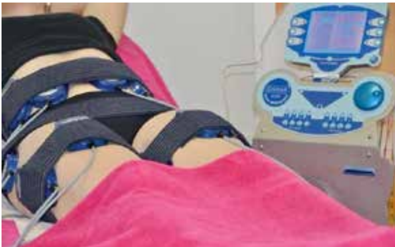
Via de pads op het lichaam worden vetcellen gelegeerd en spieren getraind.