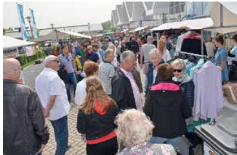
Veel belangstelling voor de Open Watersportdag.

lekkere Caribische muziek van de Amigos Latinos gingen de voetjes van de vloer. Buiten stonden andere bezoekers gezellig een biertje te drinken en ook het terras van Bistro 't Schippersrijk zat gezellig vol.