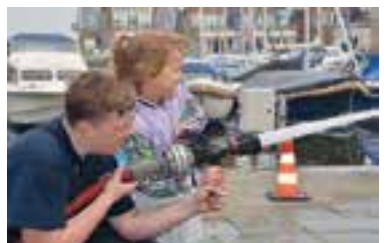
Ook de kinderen mochten spuiten met de brandweerslang.