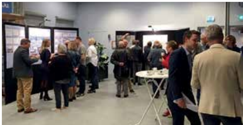
Veel belangstelling voor de inloopavond over het stationsgebied.

door de jeugdbrandweer spoot zij met de brandweerslang onder luid gejuich van het publiek het eerste eendje door het poortje. Meer over de Open Watersportdag leest u op pagina 7.