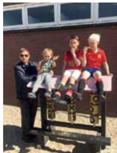
Na anderhalf uur voetballen pakken deze voetballers even hun rust.

Zichtbaar nerveus meldden de kinderen zich bij binnenkomst aan bij de organisatie, en ook sommige ouders staken hun zenuwen niet onder stoelen of banken. Nina van