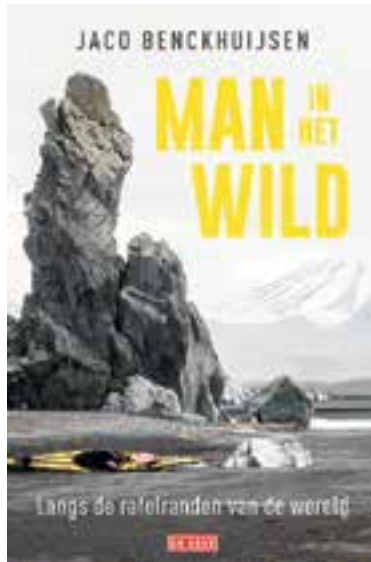
Muzikant Jaco Benckhuijsen geeft een lezing in Uitgeest.

Benckhuijsen vertelt erover op donderdag 16 mei in boek- & kantoorboekhandel Schuyt in Uitgeest. Aanvang 20.00 uur. Vrij entree.