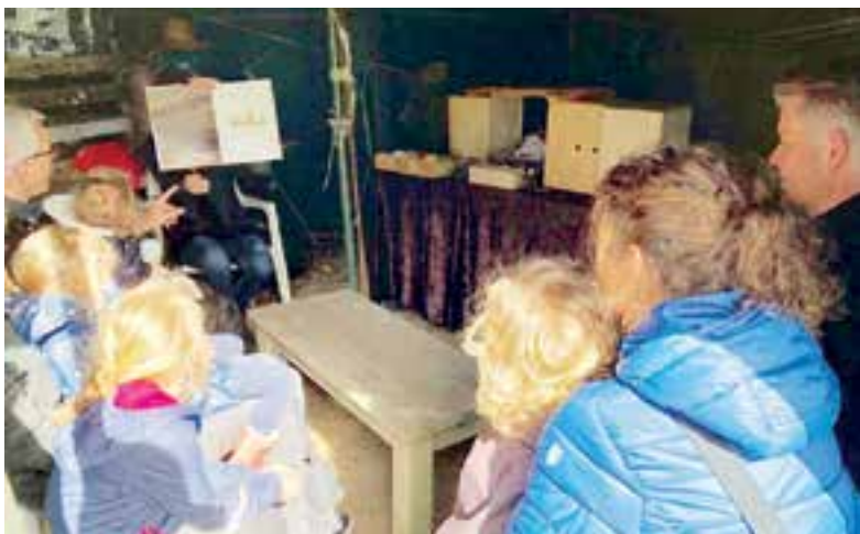
Knus Voorleestheater in de Milieutuin Uitgeest.

Zaterdag 1 juni is het Voorleestheater weer gewoon om 10.15 uur in Lees Lokaal zelf.