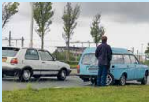
Zo werd deze Volvo plots een 'driewieler'.

De oldtimer uit 1972 kwam abrupt tot stilstand op de N203 bij Uitgeest. Beteuterd moest de eigenaar van de wagen wachten op de sleepdienst. De 47-jarige bolide is door de lokale Volvodealer opgehaald voor reparatie. Gelukkig hebben er zich geen persoonlijke ongelukken voorgedaan. (Bron: 112-Uitgeest.nl)