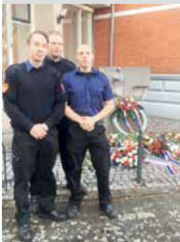
Voor de jongemannen van de brandweer betekent vrijheid dat iedereen kan doen en laten wat hij wil. "Bijvoorbeeld dat onze kinderen gewoon lekker buiten kunnen spelen."