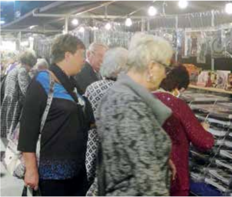
Er is weer veel te doen tijdens de creabeurs in De Zien.