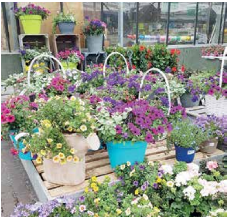
Grote bloemenzee bij Tuincentrum Tuinaanleg Frits Janssen.

Hiervoor is men bij Tuincentrum Tuinaanleg Frits Janssen aan het juiste adres; er is weer een mooie en uitgebreide sortering bloemenpracht samengesteld. Eenjarige planten, van boerengeraniums tot kuipplanten en hanging baskets; ze zijn in groten getale aanwezig. Voor elk budget is er volop te kiezen. Zo staan er ook leuke opgemaakte potjes klaar voor een kindvriendelijk prijsje. Maar dat is nog niet alles. Er is nog veel meer moois te krijgen voor moeder bij Tuincentrum Tuinaanleg Frits Janssen. Van mooie manden en potten tot leuke tuinaccessoires. Wie niet kan kiezen, laat het over aan moeder zelf en schenkt een fraai verpakte cadeaubon. Leuk om te geven en om te krijgen! Uiteraard kan men hier ook terecht voor allerlei hovenierswerkzaamheden, gereedschappen, vijverartikelen,