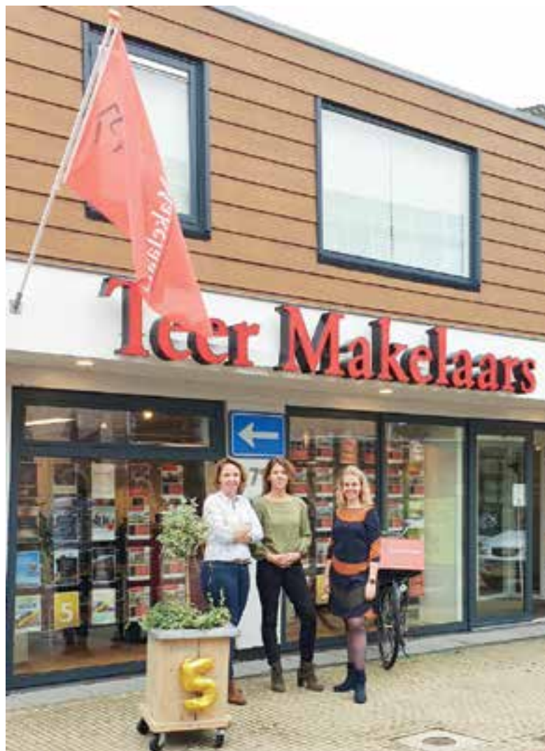
De dames van Teer.

Wie jarig is trakteert, maar Teer Makelaars Uitgeest doet dat met een twist. Wilt u uw huis verkopen? Als mogelijke toekomstige klant trakteert u de makelaar op koffie bij u thuis en u krijgt van Teer een duidelijke en gratis offerte met een advies vraagprijs. Laat u Teer Makelaars daarna helpen met de verkoop van uw huis dan hebben zij uiteraard ook nog een feestelijke verrassing voor u: in de maanden mei, juni en juli neemt Teer de kosten voor de woningfotograaf geheel voor haar rekening.