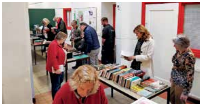
De boekenmarkt in het Lees Lokaal werd druk bezocht.

De overgebleven boeken worden bewaard in het magazijn en zullen volgend jaar, wanneer 75 jaar bevrijding wordt gevierd, ongetwijfeld goed van pas komen. Save the Children helpt kinderen die om welke reden dan ook op de vlucht zijn geslagen, met het vinden van een veilige plek en een beter zicht op hun toekomst.