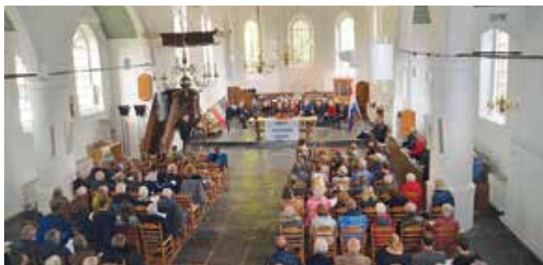
Veel mensen woonden de plechtigheid bij in de hervormde kerk.

Ze sloot af met de oproep om straks gezamenlijk twee minuten stilte in acht te nemen: "Opdat wij dit nooit mogen vergeten en opdat wij nooit mogen berusten". Lees verder op pagina 4.