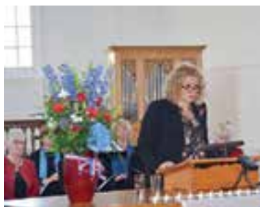
De kleindochter van verzetsheld Pieter Ouwerkerk.