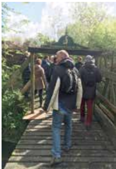
De poort naar een geheimzinnig stukje natuur in Uitgeest.