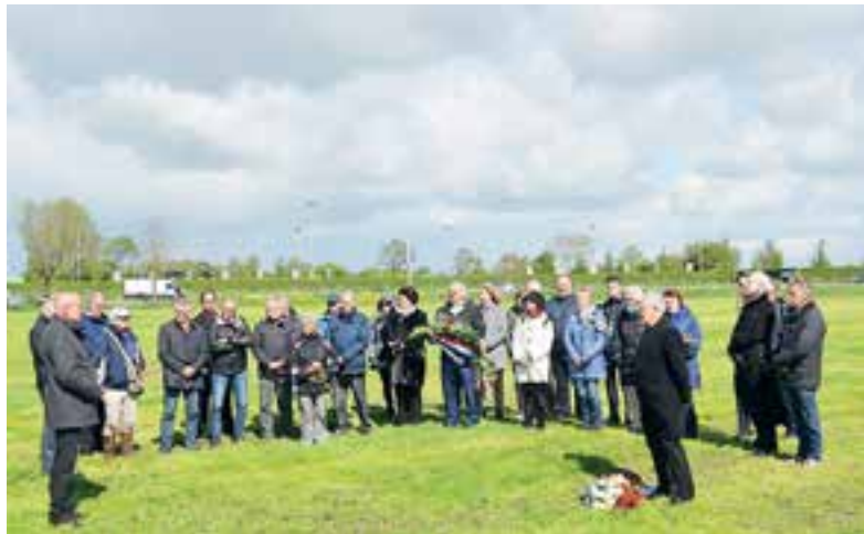
Ook bij het oorlogsmonument bij de spoorlijn werden de slachtoffers herdacht.