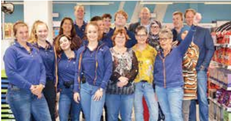
Het team van de Action is er weer helemaal klaar voor. Ze hebben er zin in!

https://www.uitgeester.nl/pagina/privacy