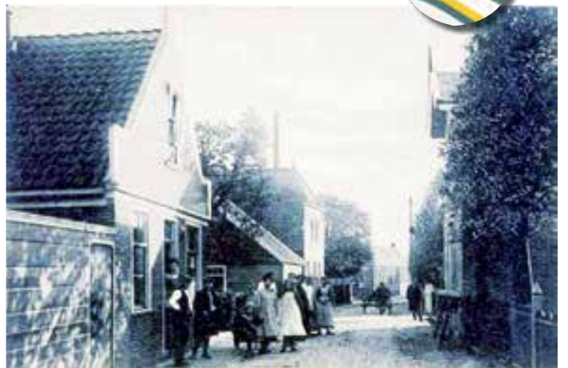
Foto uit 1915.

De houten tuitgevel is weer terug. De bij het huis horende tuinmuur werd ook met planken betimmerd. Op de tweede foto van 2019 is dit alles te zien. Het is opvallend zo goed als de in ere herstelde gevel zich voegt naar de gevelrij aan deze kant van de Meldijk, en hoe het pand nu bijdraagt aan de schoonheid van het dorpsdeel rond de hoek van Meldijk en Langebuurt. Wie meer wil weten over tuitgevels doet er goed aan de Beeldbank van Vereniging Oud Uitgeest te raadplegen. De betreffende rubriek heet 'Tuitgevels Uitgeest'.