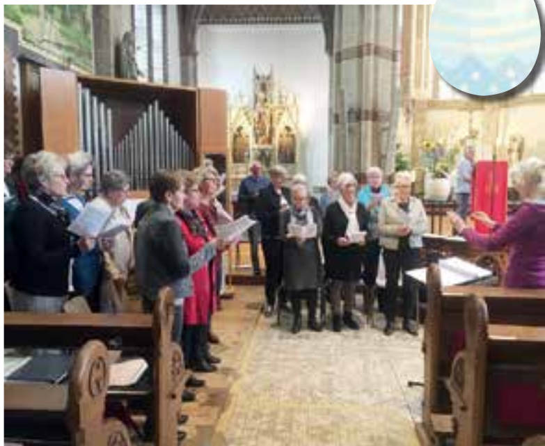
De viering vond plaats met medewerking van zangvereniging de Cantorij.