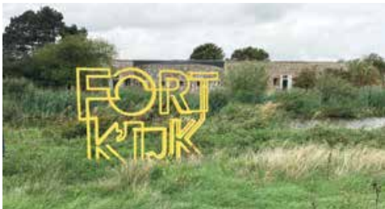
Fort Krommeniedijk oftewel Fort K'IJK.

Die verhalen worden op maandag 22 april verteld. Bovendien kan het publiek wandelen door de lange gangen waar eens soldaten bivakkeerden en zien welke herbestemming de forten hebben gekregen. In Fort bij Krommeniedijk oftewel Fort K'IJK zijn zorgwoningen voor jongvolwassenen met autisme gebouwd en architect Piet Hein Eek ontwierp de fortwachterswoning. In Fort aan Den Ham is een militair museum gevestigd en Fort aan de St. Aagtendijk oftewel het Muziekfort biedt muzikanten goede oefenruimtes. Hier worden de deelnemers aan de Fortenfietsroute getrekteerd op een drankje en livemuziek.