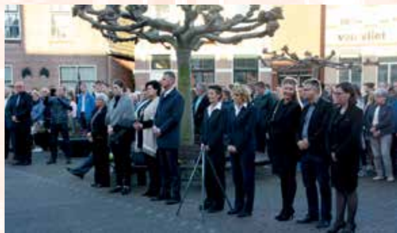
Overzicht van de herdenking bij het gemeentehuis in 2018

Na afloop van de herdenking is in de hal van het gemeentehuis een expositie te bezichtigen. Deze expositie bestaat uit gedichten, teksten en tekeningen over de Tweede