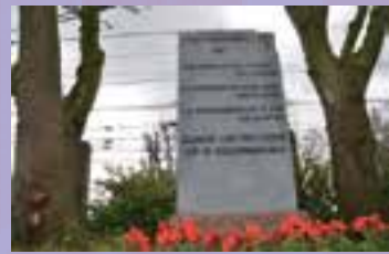
Het gedenkteken bij de spoorlijn Uitgeest-Castricum

Na een korte toespraak namens het comité en het blazen van de Last Post, is er een minuut stilte. Daarna wordt een gedicht voorgedragen en worden bloemen gelegd bij het monument. Dat gebeurt bij het monument aan de spoorlijn, gelegen achter het Kooghuis aan de provinciale weg (N 203) Uitgeest-Limmen. Voor deze gelegenheid is de locatie (particulier bezit van de familie Terra) openbaar toegankelijk.