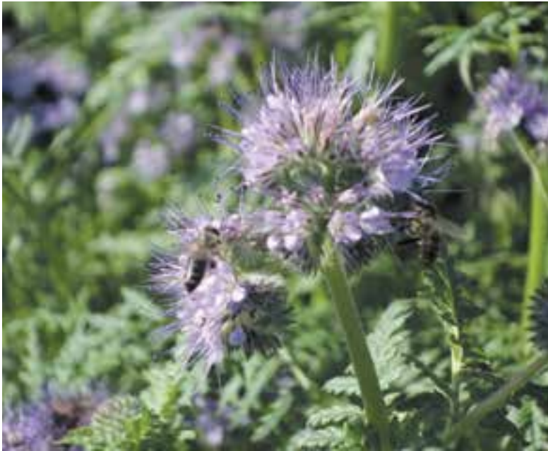
Phacelia: een echte bijenplant.

Belangstellenden kunnen langskomen op de tuin op zaterdag 20 april tussen 10.00 en 13.00 uur. De Milieutuin ligt aan de Tolweg, net voorbij de kruising Weeg/Assum, tegenover nr. 6. De Milieutuin is een collectieve tuin die al 41 jaar bestaat. Naast het kweken van onbespoten groenten voor eigen gebruik probeert men van de tuin ook een klein natuureservaat te maken voor vogels, insecten, planten en waterdieren. Op zaterdagochtend zijn er altijd leden aanwezig die belangstellenden een rondleiding kunnen geven.