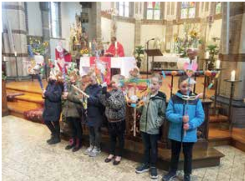
De kinderen toonden trots hun palmpasenstokken.

palmpasenstokken trok veel bekijks. Om 09.30 uur begon de H. Eucharistieviering met medewerking van RK zangvereniging de Cantorij. De priester vertelde het verhaal van Palmpasen en er werd gebeden en gezongen. Daarna volgde een kleurige processie door de kerk waarbij de kinderen hun versierde palmpasenstokken mochten showen aan de belangstellenden. "Wij zijn in Ethiopië hardlopers maar ik kon jullie amper bijhouden," zo sprak de priester de kinderen toe, tot grote hilariteit van de aanwezigen.