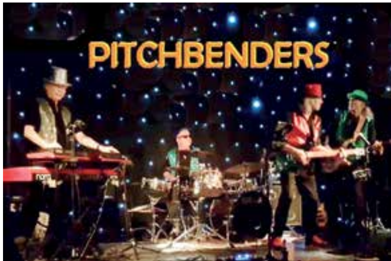
De Pitchbenders komen naar Uitgeest.

De Pitchbenders komen naar Uitgeest. Deze vijfkoppige band speelt voor ieder wat wils: Beatles, Common Linnets, Eric Clapton, Alvin Lee, Bill Withers en meer. "De laatste twee bandjes kwamen ook uit Den Haag. Dus de verwachtingen zijn erg hoog. We zijn open vanaf 15.00 en de band zal rond 16.30 beginnen. Dus voor de beste plaatsen: wees op tijd. Tot ziens in 't Portiertje!" aldus de organisatie.