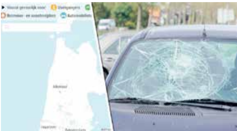
Waar in jouw omgeving is het gevaarlijk in het verkeer?

Het is een kleine greep uit de gevaarlijke plekken in de provincie. Om ook van de rest een beeld te krijgen, hebben we jouw hulp nodig: