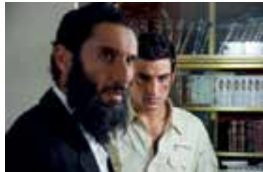
Beeld uit de film A New Spirit.

autobiografische bestseller Waarom Ik? van Jacov Damkani en heeft diverse internationale prijzen in de wacht gesleept. De zaal is open vanaf 19.45 uur en de film begint om 20.15 uur. Toegang € 6,- (Vrienden van de Zwaan € 5,-). Kaarten zijn in de voorverkoop verkrijgbaar bij Boekhandel Schuyt aan de Middelweg 139 in Uitgeest, of indien nog beschikbaar aan de zaal.