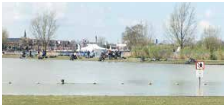
Het Zwaansmeer: een mooie plas met een fantastisch visbestand.