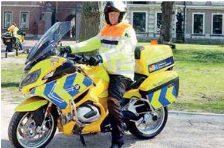
Weginspecteurs nu ook op de motor.

weginspecteurs. Na een periode van 1 jaar volgt een evaluatie en besluit de provincie of zij definitief wegingspecteurs op de motor gaat inzetten.