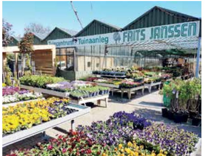
Tuincentrum Tuinaanleg Frits Janssen in Akersloot.

Op het tuincentrum heerst ook al een gezellige lentesfeer. De prachtige bloeiende planten, vaste