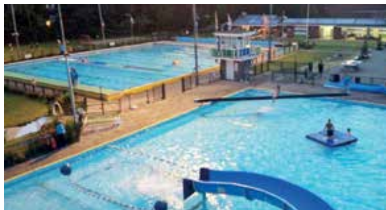
Zwembad De Zien gaat alweer bijna open.

Lekker zwemmen, glijden of spelen op de ligweide, er is zelfs een springkussen en de kantine is geopend voor koffie, thee, een ijsje of een snack. De toegang is gratis op deze feestelijke dag. Meer informatie op zwembad-dezien.nl.