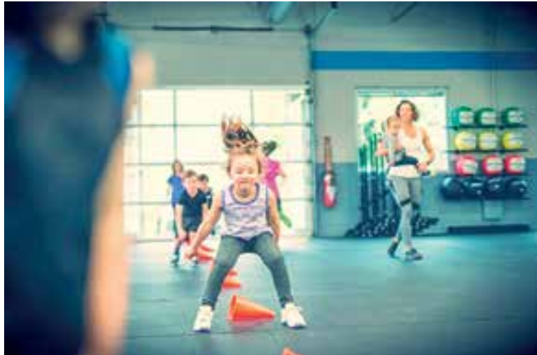
KidsFit & TeenFit bij LiefthingFit.

Elke week op: dinsdag 19.00 – 20.00 uur woensdag 17.00 – 18.00 uur donderdag 17.00 – 18.00 uur (kickboksen)