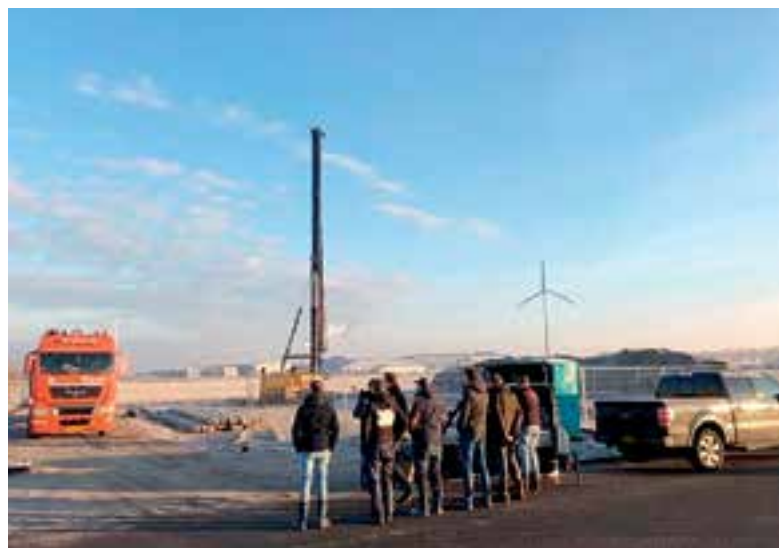
In de Bedrijfsunits Boekelermeer worden 20 duurzame bedrijfsunits gerealiseerd.

Ook in Velsen-Noord is inmiddels 45% van de units verkocht. De verwachting is dat binnenkort nog enkele units verkocht worden en dan kan de bouw rond mei 2019 starten.