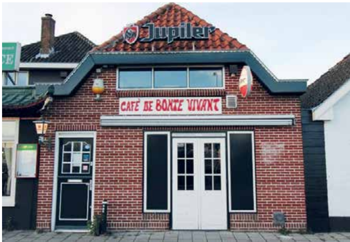
De Bonte Vivant is inmiddels al maanden gesloten.

De (kale) huurprijs van het café is 1100 euro per maand en het bedrag van de inventaris / goodwill bedraagt 15.000 euro. "Geïnteresseerden kunnen contact opnemen met Donald Satoer", besluit zijn broer Olly Satoer.