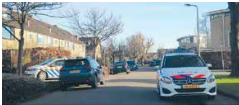
Politie aanwezig na het incident in een woning op de Kerverslaan.

het ander... Het lichaam bijvoorbeeld bestaat uit afzonderlijke delen die niet zonder elkaar kunnen. En ook in een gezin, school, bedrijf of kerk ben je onderdeel van een groter geheel. Iedereen is nodig! De viering wordt muzikaal begeleid door het koor Sound of Life. De viering begint om 19.00 uur. U bent van harte welkom!