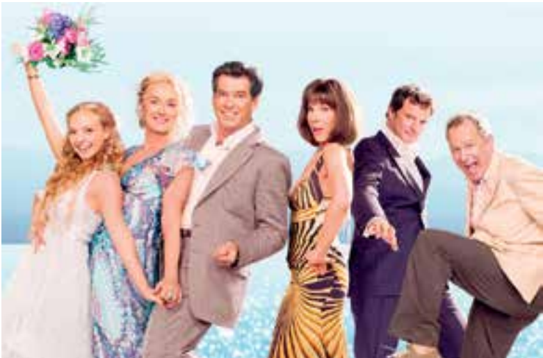
'Mamma Mia! Here we go again.'

De film verscheen op de tiende verjaardag van zijn voorganger. De film toont zowel de gebeurtenissen die op deze eerste film volgen als die aan het hotel op het Griekse eiland voorafgingen. In het verleden ontmoeten we een jongere Donna die volop van het leven geniet. We volgen haar romantische escapades wanneer ze het pad kruist van Sam, Harry en Bill. Na een tijd blijken deze romances niet enkel rozengeur en maneschijn te zijn. In deze film worstelt de zwangere Sophie met het gemis van haar moeder. Mamma Mia! Here We Go Again herhaalt vijf wereldhits uit het vorige deel, maar voegt ook wat onbekendere nummers toe. Het zijn in ieder geval