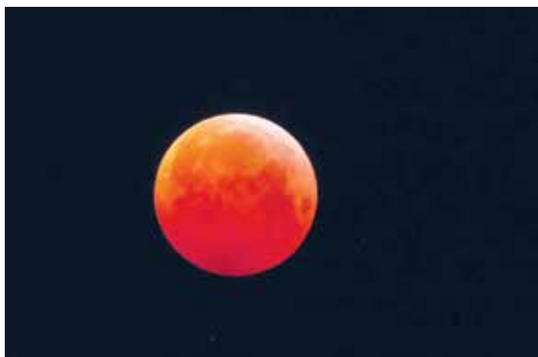
De 'bloedmaan' was maandagochtend ook in Uitgeest goed zichtbaar.