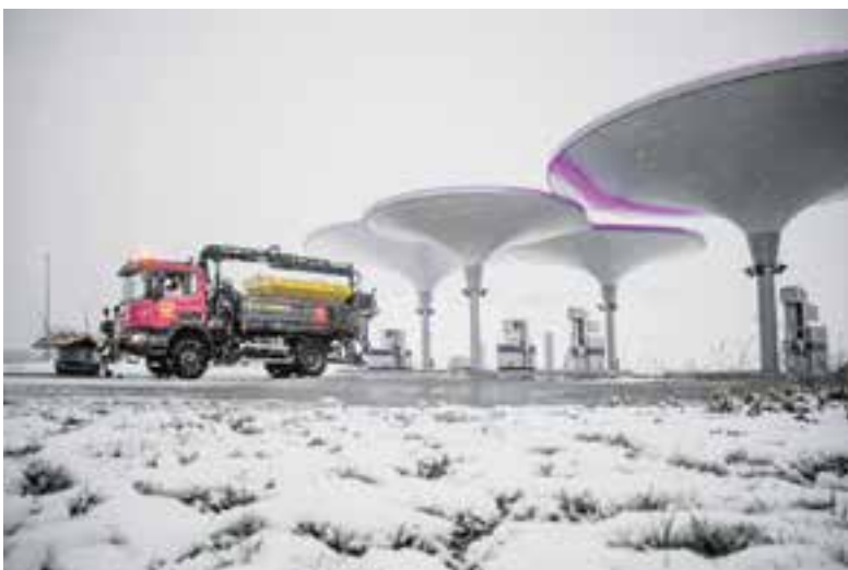
Bas op zijn strooiwagen

Voor Bas en zijn vrouw betekent dit dat zij geen feestjes of andere activiteiten plannen gedurende het strooiseizoen, dat loopt van 1 november tot 1 maart. "Als het rond het vriespunt is, ben ik eigenlijk continu stand-by," vertelt hij vanachter het stuur in zijn cabine. Als hij buiten werktijd vrachtwagens ziet rijden op zijn route dan kijkt hij goed hoe ze de route rijden en hoe ze bijvoorbeeld over de bruggen rijden: "Dat onthoud ik en neem ik mee als ik moet strooien op die bepaalde plek. Ik ben zo dus