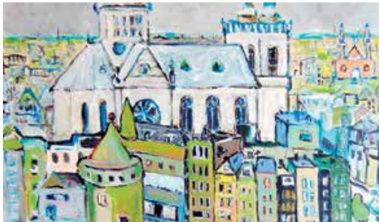
Een van de werken van Ton Brakenhoff.

Ton gebruikt naast zijn tekenboek vooral acrylverf, soms thuis op een groot doek of in de natuur op een formaat van 24 x 30 cm. Hij kan de