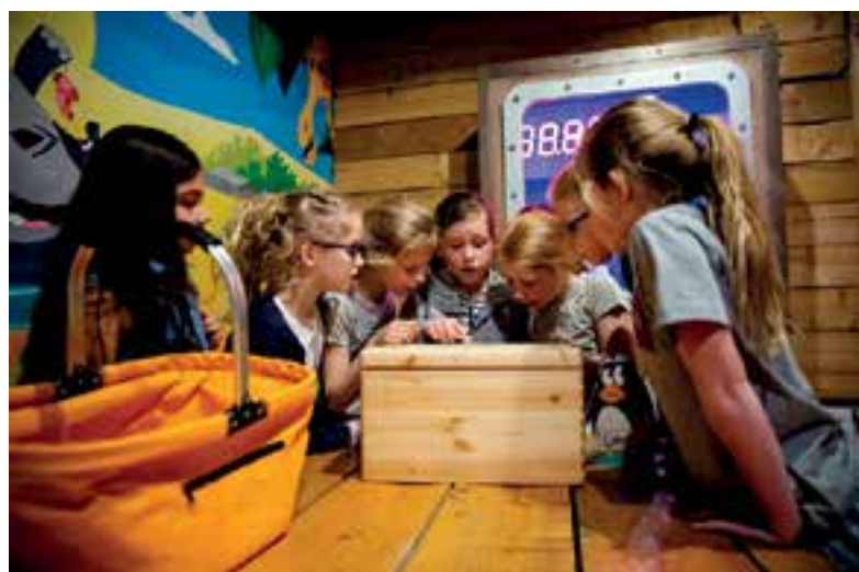
Jungle Kids Escaperoom bij Monkey Town Uitgeest.

Een groep van minimaal 5 en maximaal 8 kinderen (vanaf 6 à 7 jaar) en 1 volwassen begeleider gaan een Junglehut in en moeten met behulp van tricks & trucs sleutels vinden. Deze sleutels zijn nodig om de geheime code waarmee het slot van de Junglehut is afgesloten, te vinden en het slot te 'kraken'. Op woensdag 30 januari en vrijdag 1 februari mogen 2 groepen kinderen de nieuwe Kids Escaperoom gratis uitproberen. Degene die met zijn groep kans wil maken op een van de 4 gratis try-outs kan via de Facebookpagina van Monkey Town Uitgeest meedoen aan de wedstrijdactie. Na de try-outs is de