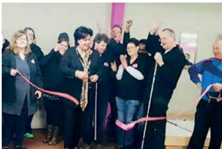
De opening door de burgemeester van Uitgeest.