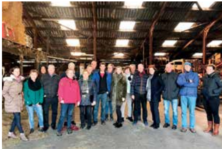
CDA Uitgeest op bezoek bij 'Het Kooghuis'.

Een stal met 70 melkkoeien, gemolken door een melkrobot. De kraamkamer waar een koe pas was bevallen van een tweeling en een stal met jongvee. Maaïke en Harm vertelden dat zij het plan hebben voor een moestuin, de volkstuinder Rien Kroos heeft al aangeboden om te helpen. Spontaan meldde zich ook een CDA-hobbytuinder om te helpen dit op te zetten. Ook voor overige diensten waren er CDA'ers die wilden helpen.