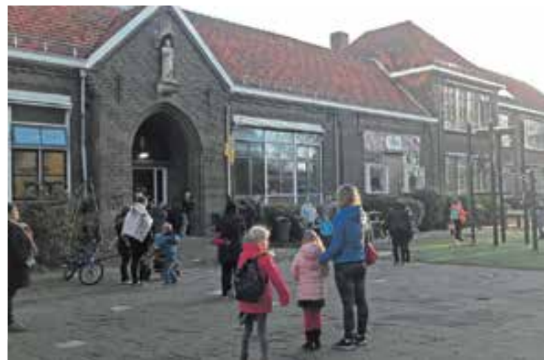
Het schoolgebouw van De Binnenmeer in Uitgeest.