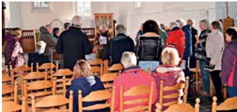
30 belangstellenden aanwezig bij het startmoment.

Er was echter een klein probleempje: door de nachtvorst stond de klok stil om 21.30 uur en dat moest eerst hersteld worden. Gelukkig lukte dat en kon de klok alsnog geluid worden om de actie Kerkbalans officieel te starten.