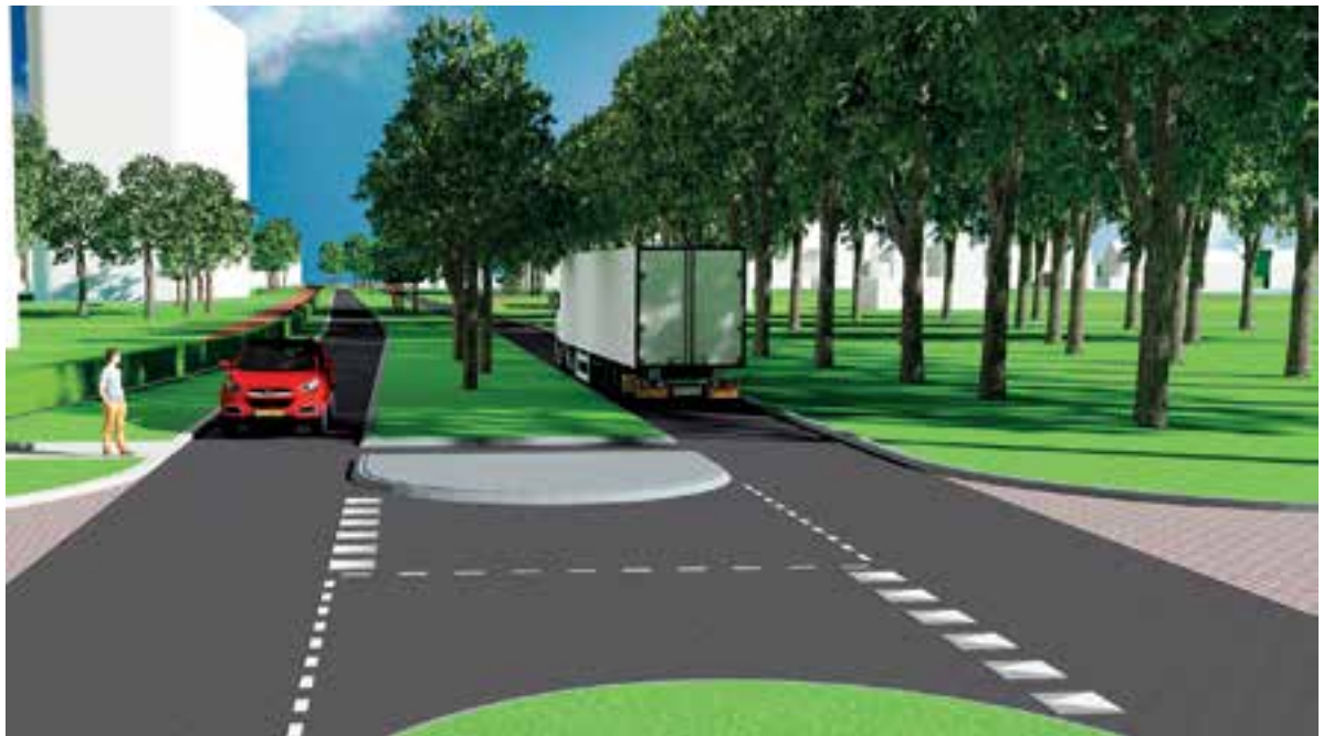
Illustratie herinrichting Tolweg.