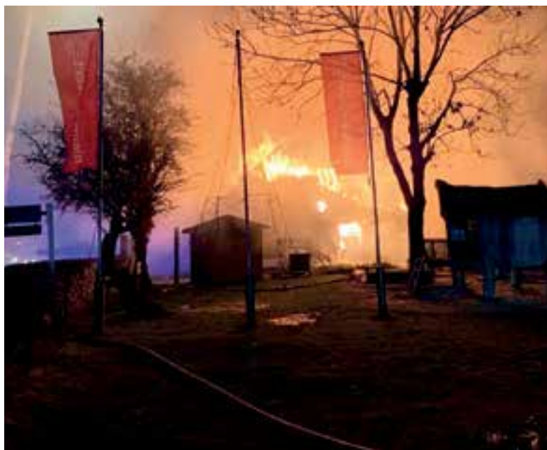
De monumentale boerderij waar het restaurant in was gevestigd was niet meer te redden.

De brand brak rond 2.30 uur uit. In eerste instantie was er alleen maar veel rook te zien. Later sloegen de vlammen uit het gebouw. Rond 4.20 uur was de brandweer vooral bezig de bijgebouwen te redden. Op Facebook wordt inmiddels verslagen gereageerd. Veel mensen uit de wijde omgeving hebben de afgelopen tientallen jaren