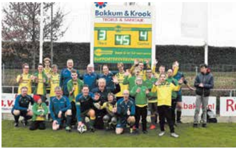
Het G-team en het team van bestuursleden.