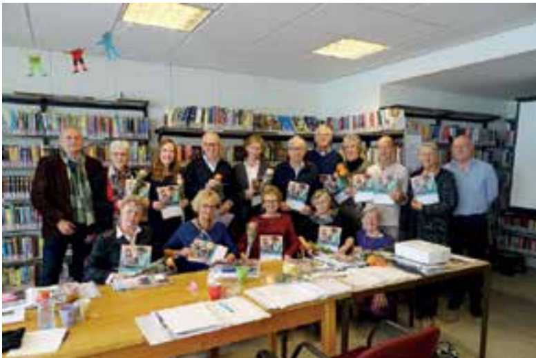
Wethouder Uitgeest met de gecertificeerde vrijwilligers.

https://www.uitgeester.nl/pagina/privacy