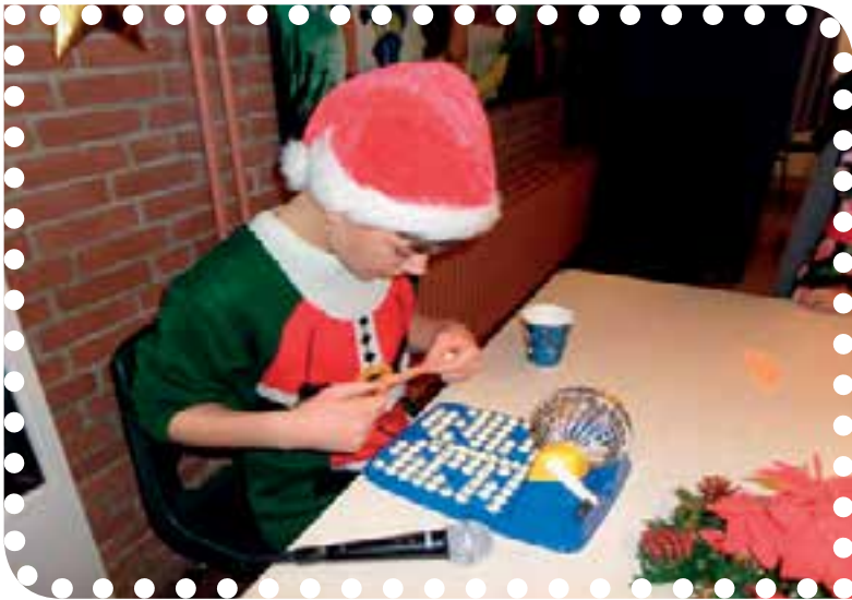
Een gezellige kerst zaterdag bij speeltuin Kindervreugd.