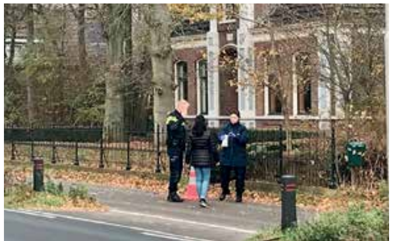
Politie doet onderzoek na incident met hardlooper in Egmond-Binnen.