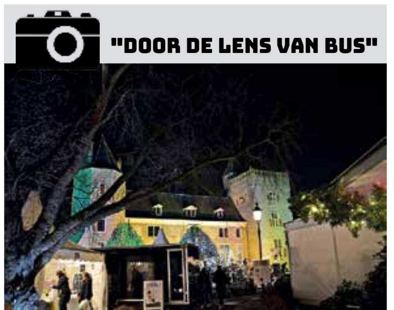
De Castle Christmas Fair in Heemskerk is een jaarlijkse kerstbazaar op een historische locatie met een breed scala aan kerstproducten en een exclusief programma op het gebied van wintermode, optredens en culinaire verwennerijen. Gedurende het gehele evenement waren er liveoptredens te bewonderen op diverse plaatsen in en rondom het kasteel. Ger Bus.