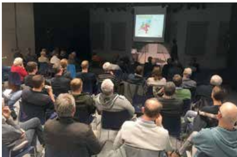
Een volle zaal bij de informatieavond van DUEC.

Voor wie zich verder wil informeren: alle informatie is te vinden op de website van DUEC en op de kersverse website van Zon op Uitgeest, te bereiken via www.duec.nl . Bij Zon op Uitgeest kunt u zich voorinschrijven als u geïnteresseerd bent in zonnepanelen op een bedrijfsdak. Dat geldt ook voor degenen die al hebben ingeschreven voor dit project bij DUEC.