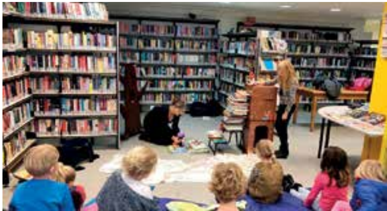
Sinterklaas en het hoogtevreespietje in Lees Lokaal.