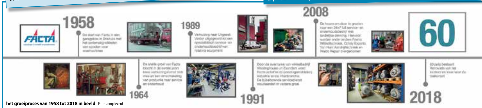
het groeiproses van 1958 tot 2018 in beeld

Als je interesse hebt om te komen werken bij Facta, mail dan naar vacatures@facta.nl Op de website www.facta.nl zijn alle openstaande vacatures te vinden. Voor informatie over openstaande vacatures of je sollicitatie kun je bellen naar Facta: 088- 600 0200.