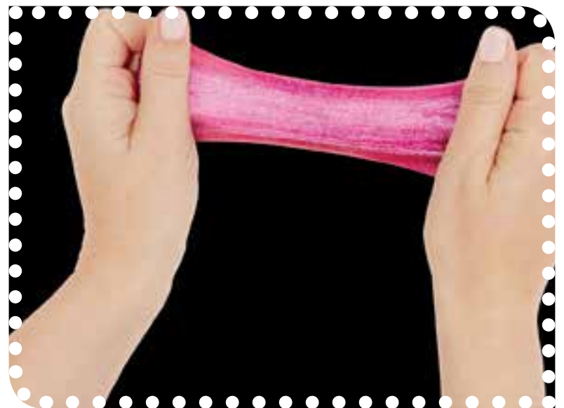
Slijm dit jaar erg populair.

Overigens net niet in de top 10, maar wel een grote trend op dit moment is het verkleden. Jongens voorname-lijk als draken en meisjes als eenhoorn. Ook knutselen, van armbandjes maken tot eenhoorns tekenen en bouwen met LEGO, is nooit wegge-weest. Traditioneel speelgoed staat nog steeds hoog in de top 10, bijvoorbeeld dankzij hernieuwde aandacht van YouTubers. LEGO is altijd populair en ziet Intertoys traditioneel terug op heel veel lijstjes. Hetzelfde geldt voor Playmobil. Met name de 'Spirit'-lijn, waaronder Lucky's huis uit de top 10, doet het