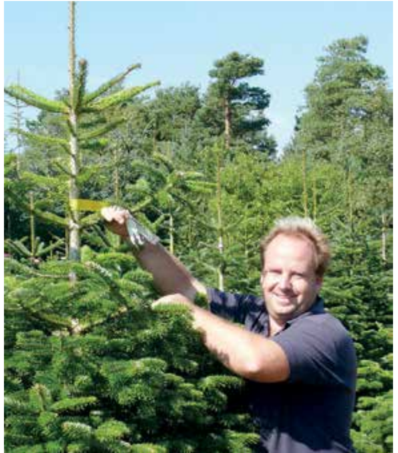
Er is een ruime keuze uit vele prachtige kerstbomen.

Tuincentrum Tuinaanleg Frits Janssen is dé verkoopdealer van stalen kerstboomstandaards, de EasyFix, een uniek systeem. De fraaie kerstboomstandaard met waterreservoir, waarbij uw boom in 5 seconden recht en stevig staat! Verkrijgbaar in verschillende kleuren en maten. Nieuw verkrijgbaar dit jaar is de kleur Wood, een mooie houtlook kerstboomstandaard. Dennis boort de kerstboom voor, waarna hij eenvoudig thuis op de standaard geplaatst kan worden. Voor een demonstratie is iedereen welkom. Heeft u in voorgaande jaren zo'n standaard bij Tuincentrum Tuinaanleg Frits Janssen gekocht, vergeet dan niet uw boom dit jaar te laten voorboren. Bovendien worden de bomen extra en gratis verpakt voor handig vervoer. Ook brengen zij de kerstboom gratis thuis in