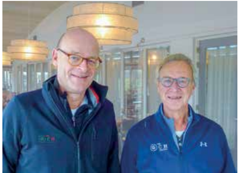
Voordelig golfen in Heiloo voor 'drukke' sporters.

De Vries vreest niet dat de 'gewone' leden gaan klagen over deze speciale prijs van 490 euro voor nieuwe leden. "Er zijn wat restricties, je kunt bijvoorbeeld niet meedoen aan de clubkampioenschappen. En verder is het in ieders belang dat we als club een gezonde leeftijdsopbouw hebben. Deze 'jongeren' zijn ook onze toekomst. Zodra hun kinderen de deur uit zijn, gaan ze meer golfen en worden ze volledig lid," voorspelt De Vries.