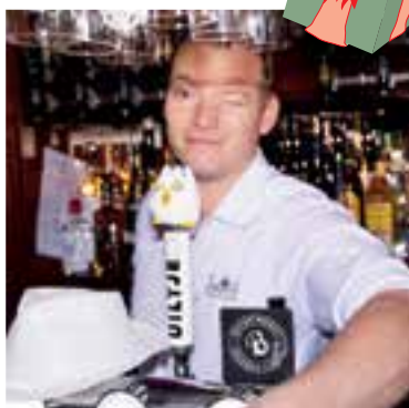
Jack's Bier Café in Heemskerk eindigde op nummer 13.