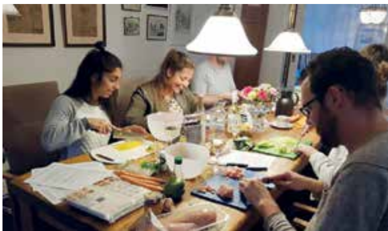
Met leuke uitjes werden de vrijwilligers in Uitgeest bedankt voor hun inzet.

Voor meer informatie of een vraag over vrijwilligersvacatures, ondersteuning van vrijwilligersorganisaties en trainingen kan contact opgenomen worden met het Vrijwilligers Informatie Punt Uitgeest, Middelweg 28 in Uitgeest, telefoonnummer 06-24178778. Het Vrijwilligers Informatie Punt is geopend op maandag en woensdag van 9.30 tot 12.00 uur.