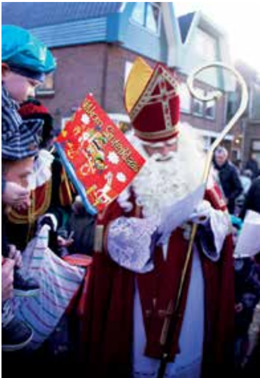
Sinterklaas nam de tijd voor een praatje en de ontvangst van tekeningen.

"Kijk eens dáár komt Sinterklaas" riep een vader enthousiast tegen zijn zoontje die vol overtuiging heel hard: "Ja KAAS!" gilde en zijn knuistje nog vaster in zijn vaders haar draaide. Op het Regthuysplein werd de goedheiligman welkom geheten door de burgemeester waarna er een rondrit door het dorp volgde.