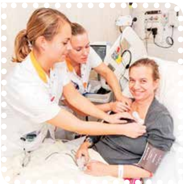
Biosensor-pleisters primeur voor ziekenhuis in Alkmaar.

Noordwest zal de Biosensor-pleister in eerste instantie 6 maanden gebruiken. Gedurende deze periode wordt onder andere bekeken of het gebruik van de pleister prettig is voor patiënten en verpleegkundigen en of we eerder kunnen signaleren of de conditie van een patiënt vooruit of achteruit gaat.