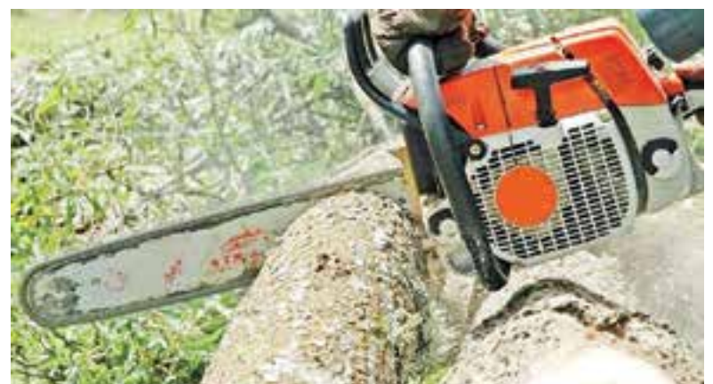
In Uitgeest zijn 80 bomen gekapt.

de OSU in de ether op 106FM, Ziggo 104.5FM, Ziggo kanaal 918 en via internet.