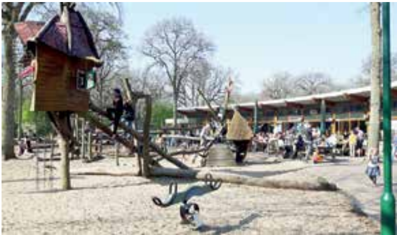
Pietenfeest bij Knoest op Camping Geversduin.