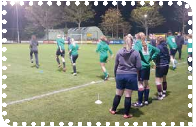
Blessurevrij sporten met Fysiotherapie SMC Uitgeest.

Ben je geïnteresseerd en is dit ook iets voor jou of voor jullie vereniging, neem dan contact met ons op of kom langs op de Zienlaan 3 in Uitgeest, 0251-750655 of info@smcuitgeest.nl .