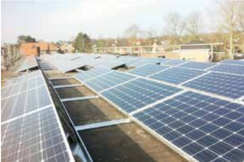
Zonnepanelen via Duurzaam Uitgeest Energie Coöperatie.

Gezamenlijk energie opwekken is nu net zo voordelig als zonnepanelen op eigen dak. De zonnepaneleninstallatie is voorzien op het dak van een bedrijfspand aan de Molenwerf. Het rijk en energieleveranciers maken dit mogelijk in de zogenaamde 'postcoderoos-regeling'. Bewoners in de postcode 1911 en aangrenzende postcodegebieden kunnen hieraan deelnemen. Op www.duec.nl vindt u meer informatie en kunt u zich vrijblijvend inschrijven. Tot nu toe zijn er al voor meer dan 220 zonnepanelen inschrijvingen.