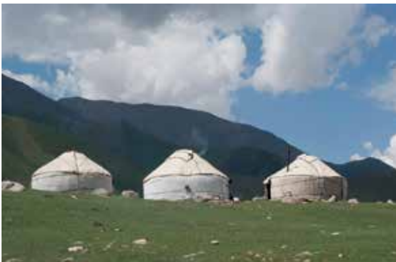
Expositie met foto's van Kirgizië in Boekhandel Schuyt.

Zelf vertelt ze daarover: "Al heel lang fotografeer ik heel graag, ik heb o.a. de basisopleiding aan de fotovakschool in Amsterdam gevolgd. Waar ik ga of sta, neem ik altijd mijn camera mee. In juni 2018 zijn mijn man ik drie weken in Kirgizië geweest. Samen met onze gids zijn we door verschillende delen van het land getrokken. Kirgizië is een van de armste landen in Centraal-Azië en bestaat voor het grootste deel uit indrukwekkend berglandschap en prachtige jailoo's (weidegronden in de dalen). Van oorsprong is de bevolking nomadisch. Gedurende het voorjaar, de zomer en het najaar tot oktober trekken nog steeds veel herders met hun gezinnen de bergen in met kuddes