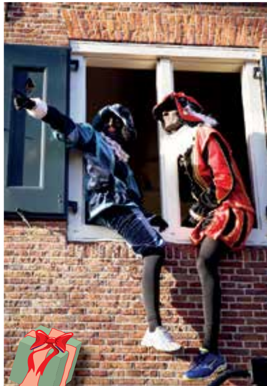
In Uitgeest waren er alleen traditionele Zwarte Pieten bij de intocht.