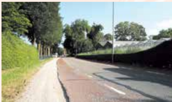
Huidige situatie

Het vernieuwen van het asfalt en het verbeteren van de verkeersveiligheid zijn aanleiding voor een nieuwe inrichting van de Uitgeesterweg en het kruispunt met de Geesterweg. De Uitgeesterweg wordt een fietsstraat. Bij het kruispunt komt een veilige oversteekplaats. De werkzaamheden zijn van 10 september tot en met 19 oktober. De weg en het kruispunt zijn wisselend afgesloten voor het verkeer.