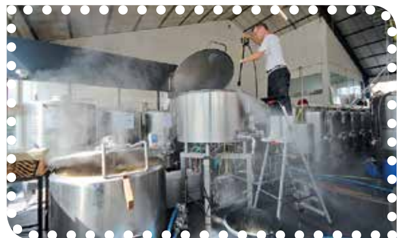
Bijna een op de vijf (17 procent) bierdrinkers heeft weleens een bierbrouwerij bezocht..