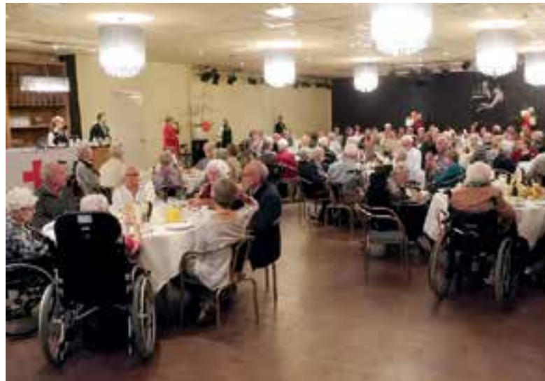
Verrassingstocht in 2017.

inwoners van Uitgeest die zelf in staat zijn om leuke dingen te doen, niet in aanmerking voor deelname aan de verrassingstocht," aldus de organisatie. De kosten voor de verrassingstocht bedragen 10 euro per persoon. Belangstellenden kunnen zich vóór 14 september opgeven bij: Bep Nelis, de Bonkelaar 20 te Uitgeest, 0251-313255. Of op maandagmiddag in Zorgcentrum Geesterheem tijdens de sociale activiteiten van het Rode Kruis tussen 14:00 en 16:00 uur in de grote zaal.