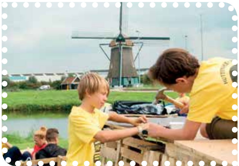
De Huttenweek was een groot succes dankzij alle sponsors.

Stichting Huttenweek Uitgeest wil dan ook alle sponsors, gulle gevers en hulpvaarders bedanken, die ervoor gezorgd hebben dat de kinderen en de leiding weer een onvergetelijke week hebben beleefd. Niet alle gulle gevers willen bekendgemaakt worden, maar diegenen die er geen bezwaar tegen hebben willen wij dan ook met naam en toenaam bedanken.