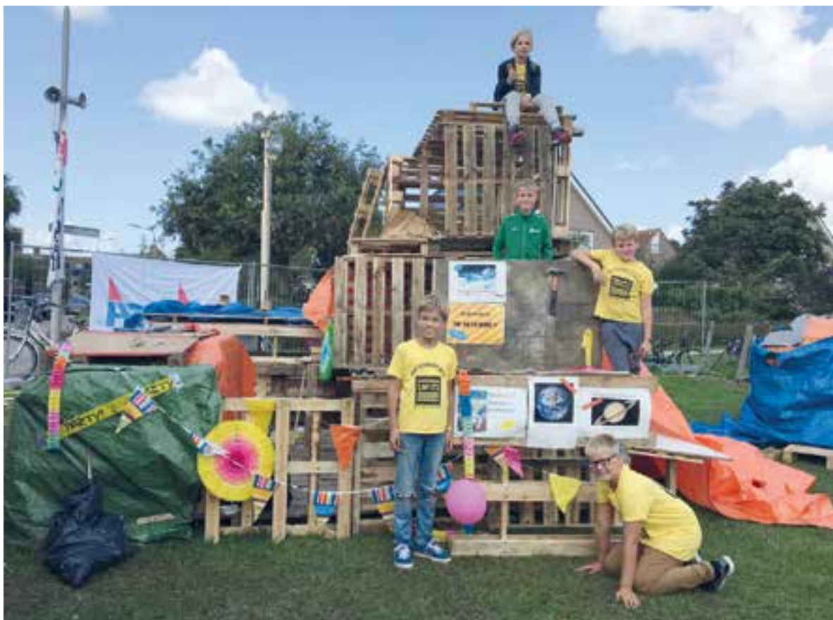
Het enorme reisbureau 'De Sleurhut' met bijzondere aanbiedingen.