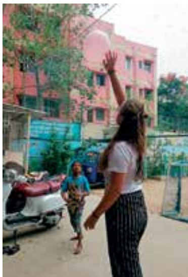
Er was veel lol met het spelen met een ballon.

jongens geweest, maar ook twee keer een avond naar de meisjeshuizen, waar getut en gedanst werd. De vlucht terug ging van Chennai naar Mumbai en van Mumbai naar Amsterdam. Het is een hele ervaring geweest, die ik niet snel zal vergeten."