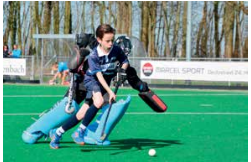
Kom in actie bij MHC Uitgeest.

Kennismaken met hockey? Dat kan bij ons! Wil jij graag een keer hockeyen en zelf ervaren wat een gave sport dit