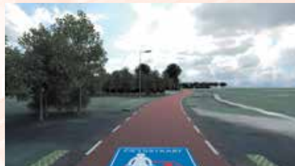
Nieuwe situatie