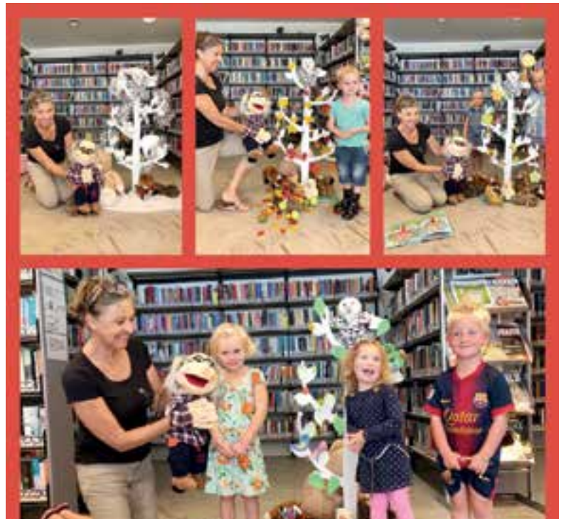
Een gezellige middag in het Lees Lokaal.