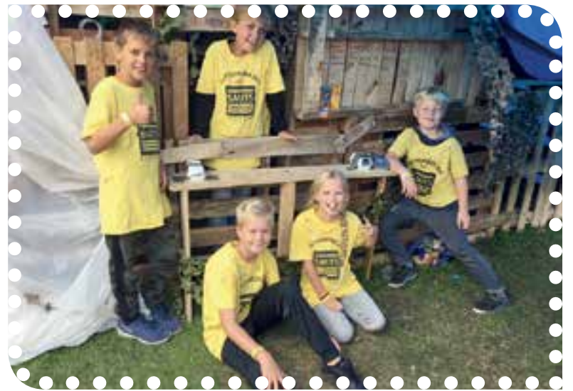
Bo en haar vrienden geven een inbreekcursus en rondleidingen.

Hourik van de Molenhoek leggen de dresscode uit voor Huttenweek. Het belangrijkste is dat je oude kleding draagt, een lange broek die lekker losjes zit is ideaal. Dena vertelt dat een spijkerbroek niet handig is, die zit te strak. Ook is een leuke accessoire bijna een must. Dena draagt een vrolijke diadeem die ze zojuist bij de