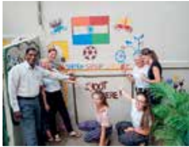
Het resultaat van de muurschildering.

onbewoond eiland. In de bus gingen de jongens allemaal weer los op de muziek! Het allerlaatste project werd niet vanuit Don Bosco geregeld, maar er wordt wel hetzelfde werk gedaan voor de kinderen. Hier hebben wij een muurschildering gemaakt samen met de kinderen, een leuke herinnering voor hen en voor ons. We zijn bij de