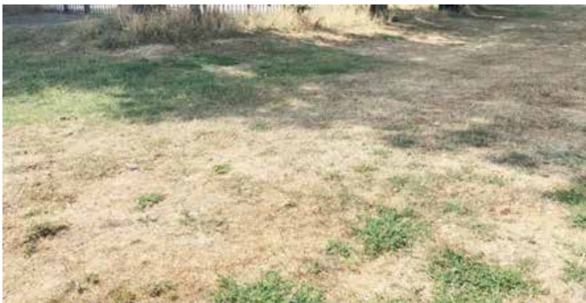
Verdord gras nabij basisschool de Vrijburg.