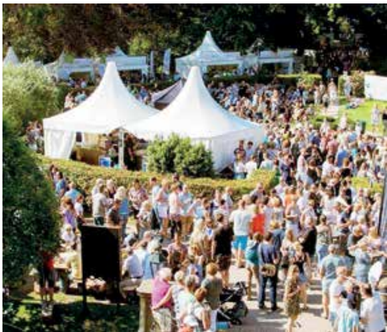
Bites & Beats: het food- en music event van de IJmond.

Bites & Beats start zondag 26 augustus om 12:00 uur op het terrein van Slot Assumburg te Heemskerk. De laatste informatie is te vinden op www.bitesbeats.nl .