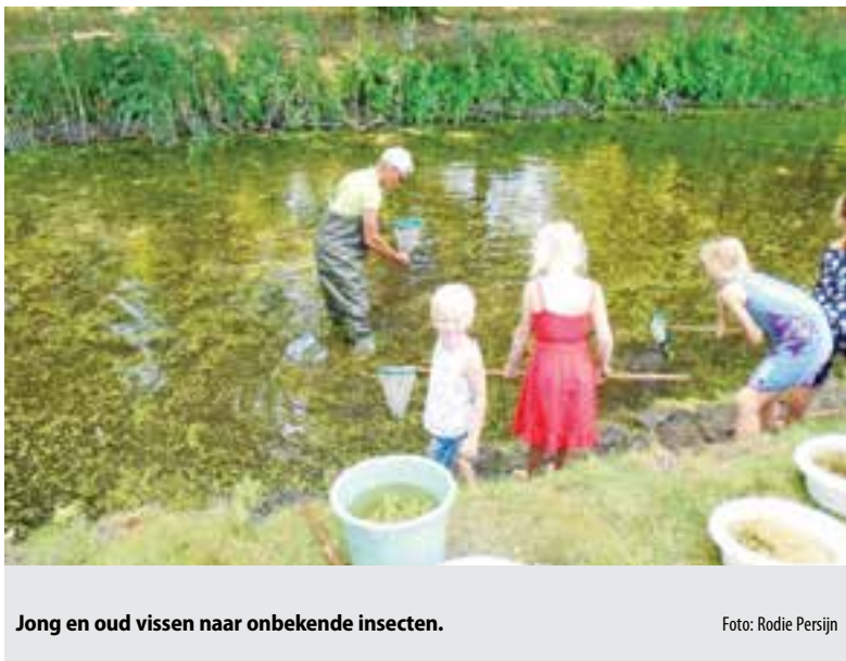
Jong en oud vissen naar onbekende insecten.

De inzendingen stromen inmiddels binnen. Deze foto is ingezonden door Rodie Persijn en dingt mee naar zomerfoto van het jaar 2018. De foto is gemaakt tijdens het zomerfestival Marquette op 15 juli 2018. Het is volgens de jury een bijzondere foto omdat er veel op te zien is: de interesse van de kinderen, het plezier van het jongetje op de kant die in de lens kijkt en het prachtige groen van de