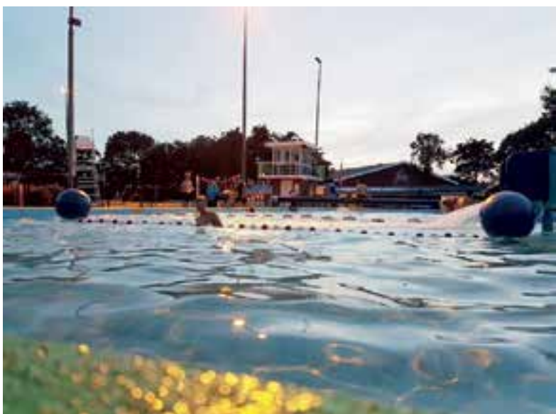
Het zwembad 'by night'.