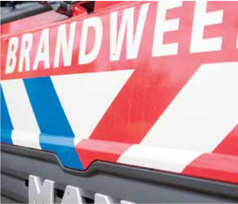
De brandweer was snel ter plekke.

Vanwege de aanhoudende droogte geldt al lange tijd een verhoogd risico op duinbranden. Uit voorzorg werden daarom tientallen brandweerwagens naar het gebied gestuurd. Ook waren de toegangswegen naar het duin afgesloten.