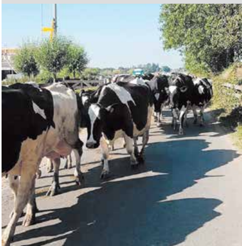
De koeien onderweg naar hun stal