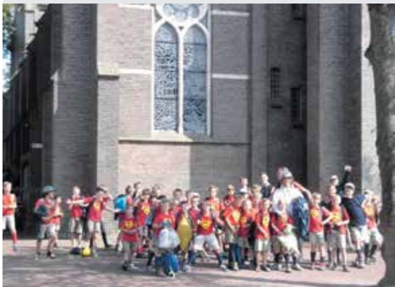
De Belgische supermannekes

Onze zuiderburen op bezoek bij scouting Uitgeest