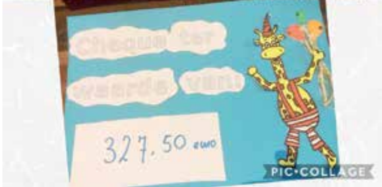
De cheque met het bij elkaar gespaarde bedrag.