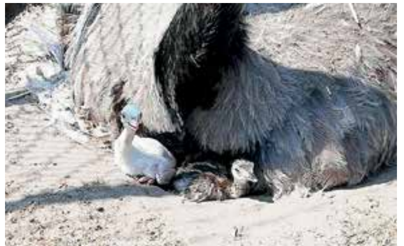
Het jonge geluk.

Een nandoe lijkt uiterlijk veel op een struisvogel, maar is beduidend kleiner en lichter. Andere verschillen met een struisvogel zijn dat een nandoe drie tenen heeft in plaats van twee en dat de seksen nauwelijks van elkaar te onderscheiden zijn. Het mannetje maakt in de paartijd veel herrie om de vrouwtjes te lokken, daarbij probeert hij indruk te maken met zijn vleugels. Een enkel