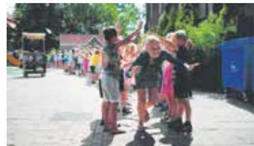
Groep-8-leerlingen van de Binnenmeer rennen door de erehaag hun middelbareschooltijd tegemoet.

Voor de aanstaande brugklassers was de laatste week op de basisschool aangebroken. Ze ruimden op en namen afscheid van elkaar en van de school. De achtstegroepers mochten hierna door een erehaag lopen en de rest van de leerlingen zwaaiden de schoolverlaters uit.