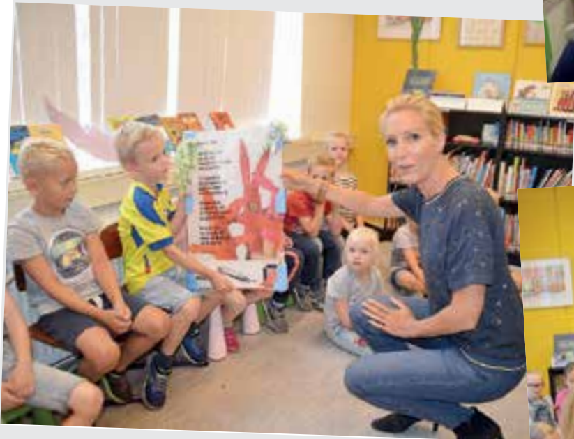
Kornak: 'Wie is wie'.