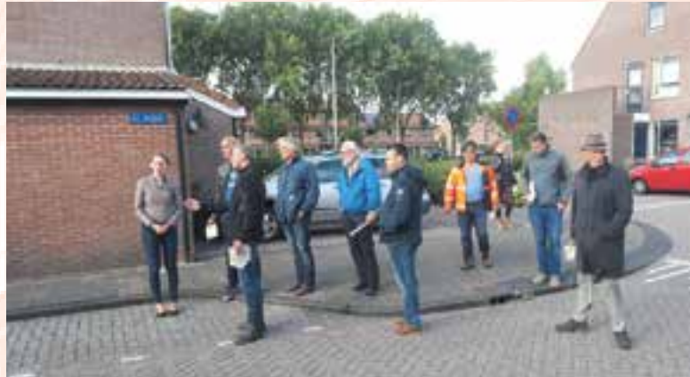
Leden van de werkgroep De Koog 'op safari' door de wijk

werkgroep ter inspiratie eerst een voorbeeldproject van een duurzaam en klimaatbestendig ingerichte wijk. Daarna buigen de leden zich over het schetsontwerp, worden reacties verwerkt en in januari 2019 ligt er een voorlopig ontwerp ter inzage. Alle bewoners van De Koog kunnen hierop reageren.