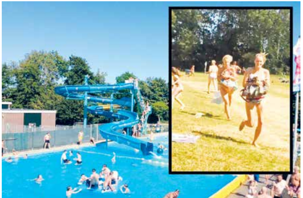
Mensen rennen over de speelweide om hun spullen in veiligheid te brengen.

"Ben je iets kwijt of heb je iets gevonden? Meld het bij de kassa, het zou fijn zijn als alles terugkomt bij de rechtmatige eigenaar!", aldus zwembad De Zien.