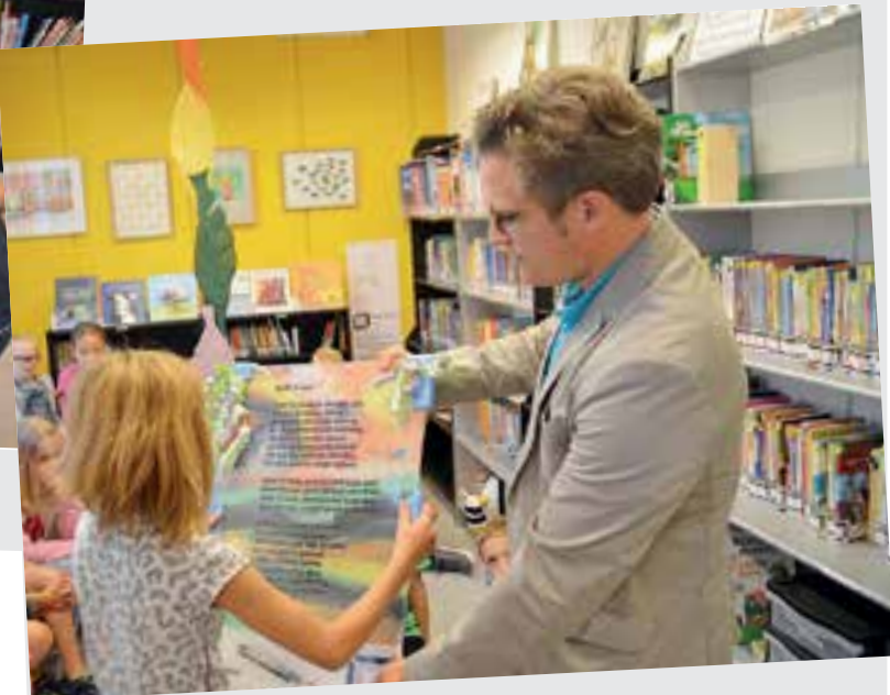
Binnenmeer: 'Leuk is raar'.