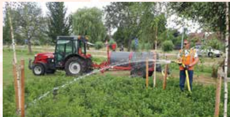
Een medewerker van wijkbeheer besproeit een van de perken langs de Geesterweg

voering van geplande werkzaamheden van de gemeente. En past dit ook in het verzoek van het waterleidingsbedrijf PWN om verantwoord en doelmatig met het schaarse water om te gaan. Desondanks heeft de natuur het de komende tijd nog moeilijk en komt het voor dat bomen en struiken nu al te maken hebben met extra en vervroegd bladuitval.