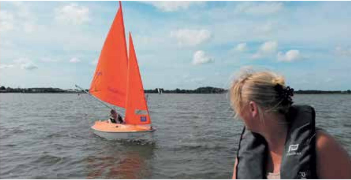
Vacature voor zeilen met mensen met een beperking.

toe een dagje of halve dag willen komen helpen als zeilmaatje. De Bemiddelingskamer zoekt buurtbemiddelaars om tussen burens te bemiddelen bij een conflict. Zij zijn neutraal en luisteren naar het verhaal van beide burens. Door burens met elkaar in gesprek te brengen en begrip te creëren voor elkaars standpunt, ontstaat ruimte om samen op zoek te gaan naar duurzame oplossingen. Aan de slag? Meer informatie over genoemde vacatures en meer vrijwilligerswerk in Uitgeest is te vinden op de website van het Vrijwilligers Informatie Punt: www.vrijwilligerswerkuitgeest.nl of kom langs op maandag of woensdag tussen 9.30-12.00 uur. Wij zijn te vinden in de hal van het gemeentehuis.