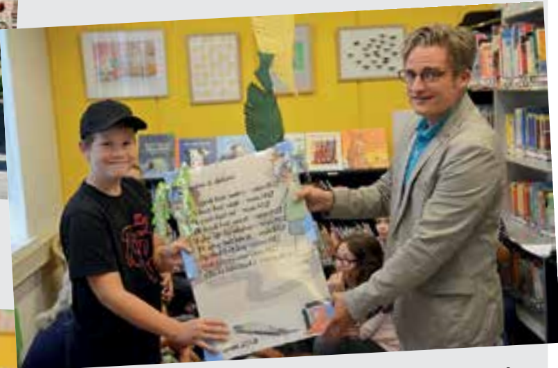
Vrijburg: 'Peuter en delen'.