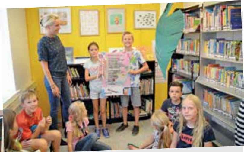
De Wissel: 'De hand van mijn vader'.