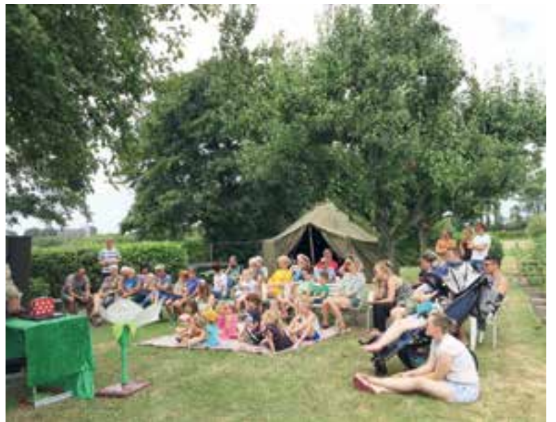
Veel belangstelling van jong en oud voor een verhaal over het insectenhotel.

Na deze voorstelling hoeven we er niet vreemd van op te kijken als er