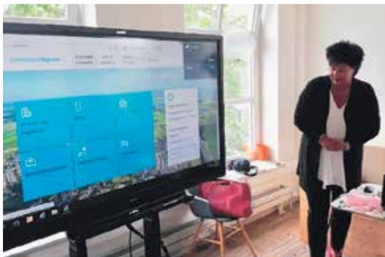
Op symbolische wijze werd de nieuwe website maandag 'gelanceerd' door de burgemeester.

tijdens de zomermaanden. Ben jij iemand die het wel leuk vindt om in de maanden juli en augustus een half uurtje te wandelen met een oudere in een rolstoel en te helpen koffie schenken? Kom dan op donderdag om 10.45 uur naar Geesterheem. We wandelen van 11.00 tot 11.30 uur en drinken daarna koffie.