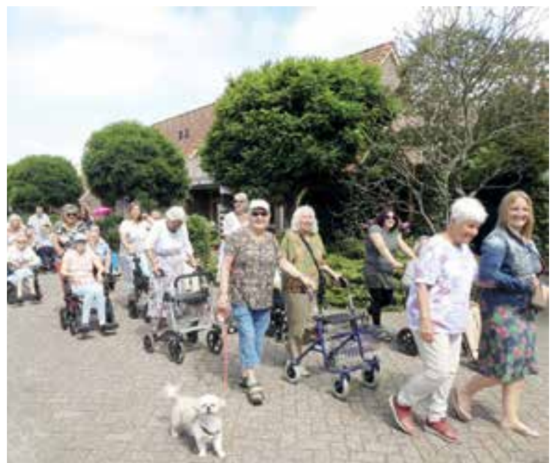
Ouderen door het dorp tijdens de wekelijkse wandeling.