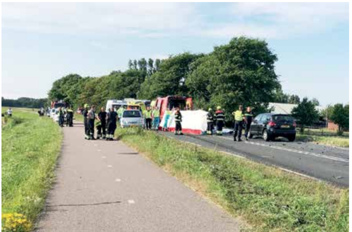
Veel hulpdiensten aanwezig bij dodelijke aanrijding op N203.

De afgelopen jaren is er een aantal maatregelen genomen. Zo is aan de kant van Uitgeest een vangrail geplaatst en bij de camping aan de kant van Castricum een vluchtheuvel. "Maar daar is het bij gebleven," zegt Harm. "Het tussengelegen stuk is een racebaan. Ze zouden over de gehele lengte een vangrail tussen de weg en het fietspad moeten plaatsen. En vooral die snelheid moet omlaag." Lees het vervolg op pagina 4.