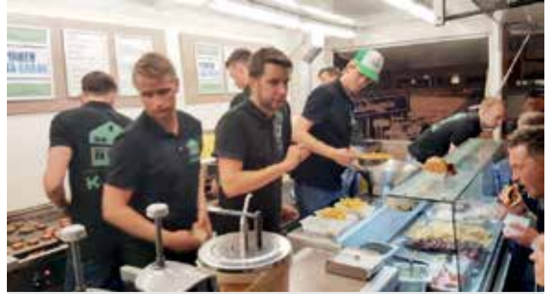
De 'Klaas Vreetschuur' deed goede zaken tijdens de kermis.