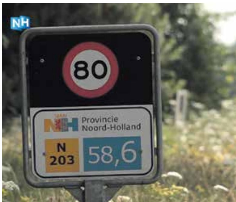
De N203 is volgens ANWB-leden de gevaarlijkste weg van Noord-Holland.

van de ANWB kwam de N203 als de gevaarlijkste weg van Noord-Holland naar voren. De weggebruikers noemden toen vooral de wegdelen ter hoogte van Wormerveer en Castricum onveilig. "Veel