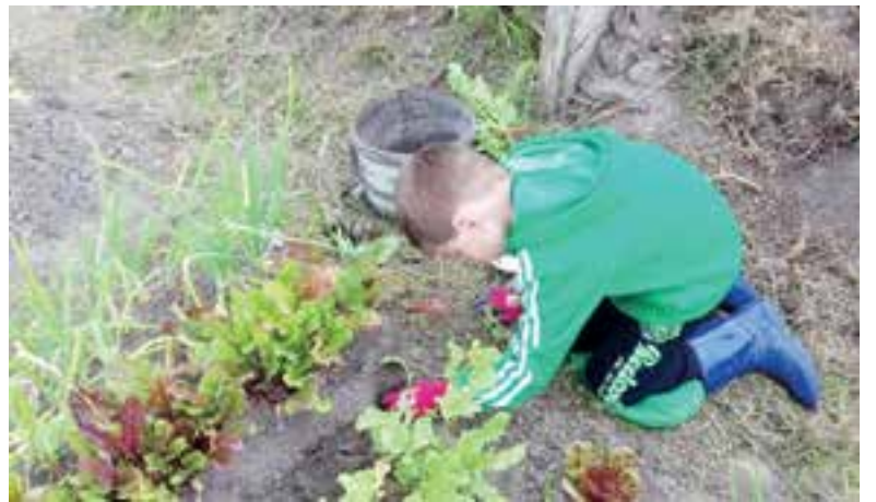
Lekker tuinieren in de eigen volkstuin.