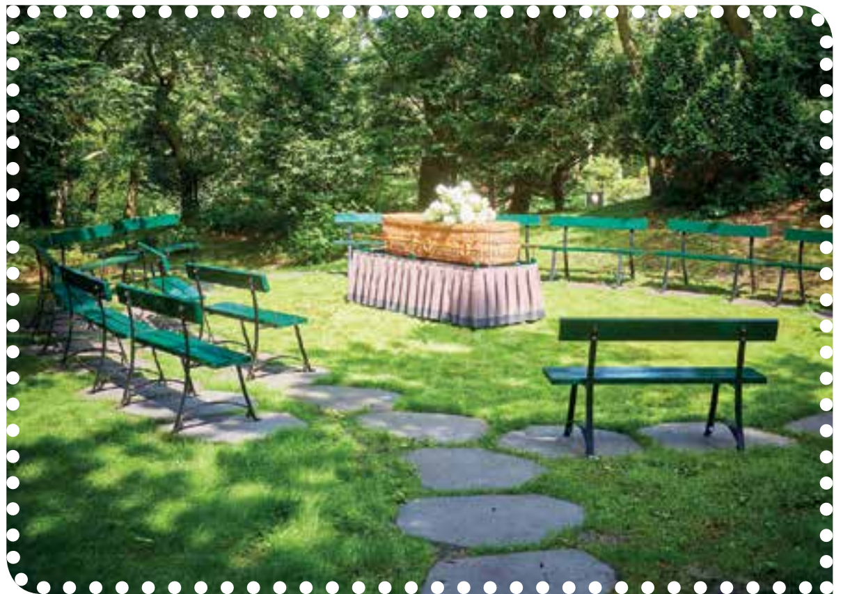
Nieuwe buitenaula in Gedenkpark Westerveld.