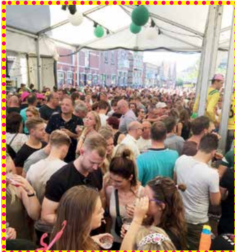
Het was maandagochtend volle bak tijdens het deunen.