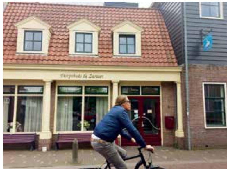
Dorpshuis De Zwaan zit al weken zonder bestuur.

Het bestuur heeft aangegeven de hoogst noodzakelijke werkzaamheden voorlopig te blijven verrichten totdat er een nieuw bestuur benoemd is. De al geplande activiteiten gaan daarmee vooralsnog gewoon door. Ondertussen is het college van B&W er alles aan gelegen om het dorps huis volwaardig open te houden in het belang van de Uitgeester gemeenschap. Hiervoor onderneemt zij op het moment een aantal stappen. Zo is onder andere het Vrijwilligersinformatiepunt ingezet om nieuwe bestuursleden te werven en er is aan de fracties gevraagd om in hun netwerk te zoeken naar geschikte kandidaten.