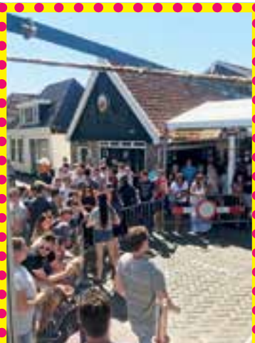
Aan publiek geen gebrek tijdens het hooivorkdarten.