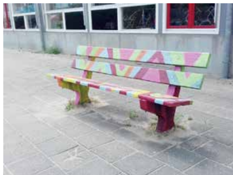
Het 'vriendschapsbankje' op het schoolplein van basisschool De Wissel.

"Dit is precies wat de bedoeling is van het bankje. Als kinderen wel graag samen willen spelen maar hier bijvoorbeeld geen initiatief toe durven nemen kunnen zij op deze bank gaan zitten en weten de