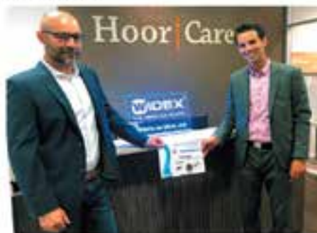
Overhandiging audicien Premium Dealer certificaat en LED display

Onze audiciens werken graag met de producten van WIDEX omdat de klanten er gemakkelijk aan kunnen wennen en zeer tevreden zijn over de uitstekende geluidskwaliteit. Die geluidskwaliteit maakt dat veel klanten het merk trouw blijven. Daarnaast is WIDEX één van de meest innovatieve hoor-toestelmerken, vooral als het gaat om die aspecten die maken dat de slechthorende - binnen de mogelijkheden van zijn of haar gehoorverlies - optimaal kan meedoen.