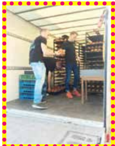
Ontbijt: de ham-kaascroissants.