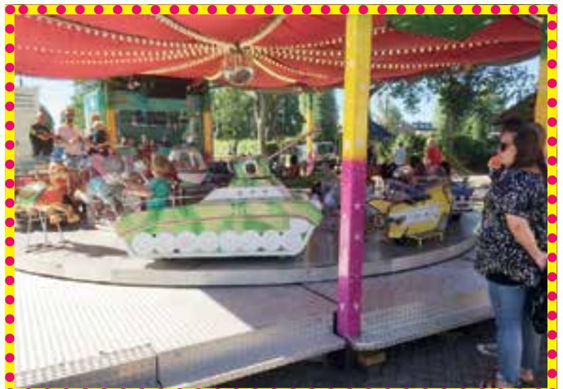
Kermis Uitgeest is ook plezier voor de allerkleinsten.

De kermis gaat nog door tot vandaag, woensdag 4 juli, lees het after-kermisverhaal volgende week in De Uitgeester.