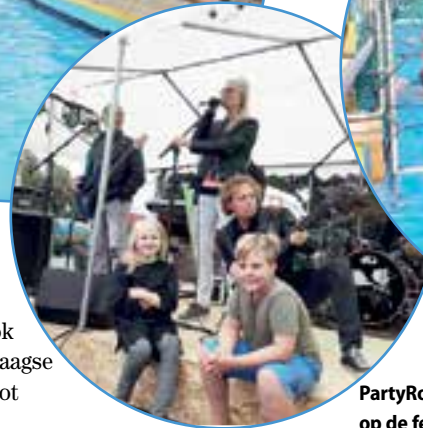
PartyRockers op de feestavond.