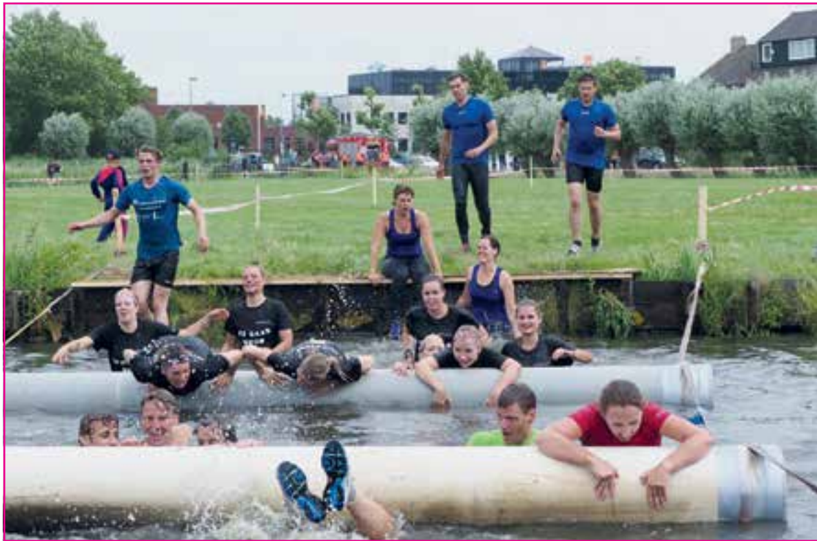
Ook dit jaar: sportiviteit, gezelligheid, kermis en een lekker zonnetje...

De warming-up wordt verzorgd door Lieftefit, het evenement wordt verder muzikaal omlijst door o.a. DJ Weizen & DJ Drogba en voor de kids staat er een springkussen op het Gemeentehuisplein. Om 19.30 is de prijsuitreiking voor de snelste dame, snelste heer en het snelste team en voor iedere deelnemer is er een schitterende medaille. Aansluitend is er nog een verloting, voor alle deelnemers en