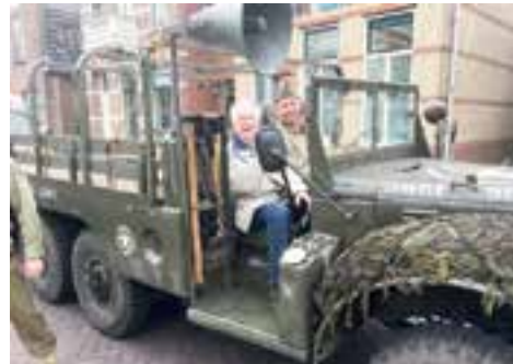
Een prachtig eerbetoon aan de soldaten die vochten voor onze vrijheid.

De veteranendag die is bedoeld als eerbetoon