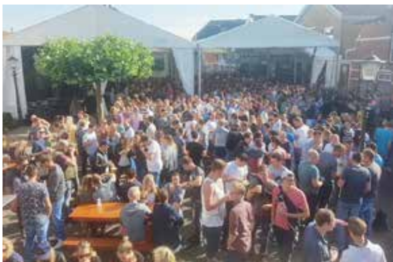
Over paar dagen barst het feest in Uitgeest los...

"Wij staan er zelf eigenlijk niet om 08.00 uur, maar al om 06.00 uur," vertelt de zanger. Paper Plane heeft op veel kermissen opgetreden maar de Uitgeester kermis is bijzonder. "Op maandagochtend 08.00 uur staan er twaalfhonderd Uitgeesters bier te drinken op een plein, dit gebeurt nergens," zegt hij enthousiast. De saamhorigheid onder de kermisgangers is hem al vaker opgevallen. Hij doet namelijk al jaren het licht en geluid tijdens de kermis met zijn bedrijf Higher Ground. Lees verder op pagina 6 en 7