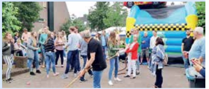
Het touwtrekken was een populair spel tijdens deze feestdag.