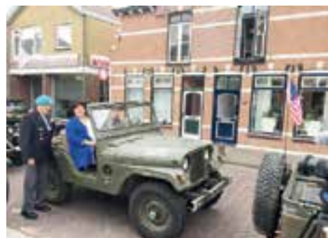
Ook de burgemeester van Uitgeest was van de partij.

aan de inzet van veteranen voor vrede en veiligheid in Nederland, werd georganiseerd door de gemeenten Castricum en Uitgeest en het Veteranencomité. De tentoonstelling en rondritten in historische legervoertuigen worden mede mogelijk gemaakt door de Stichting Rijdend Museum Militair Erfgoed (S.R.M.M.E.). Zij gaan evenementen langs met de meest bijzondere voertuigen uit de oorlog. Veel van deze voertuigen zijn van een overleden verzamelaar. Zijn weduwe heeft de voertuigen in beheer gegeven bij de stichting.