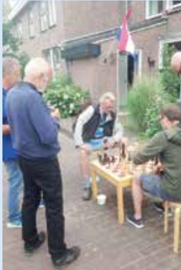
Een potje schaken op straat in de Kerkbuurt.

Mede dankzij de weergoden was het tot 23.00 uur een gezellige boel in de Kerkbuurt.