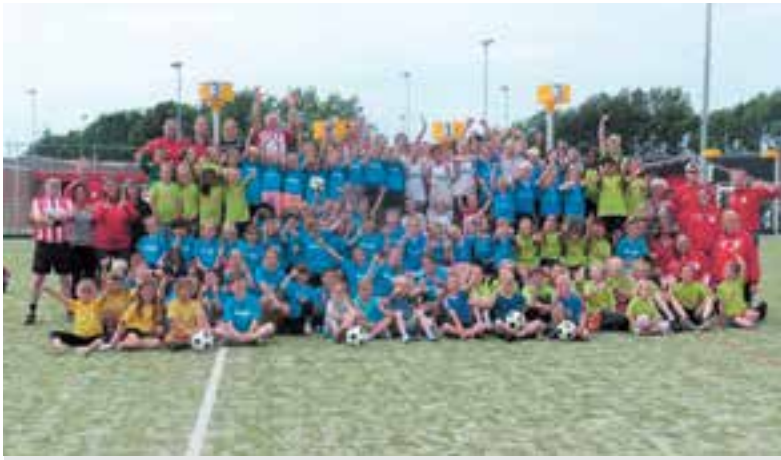
Negentien schoolteams deden mee aan het korfbaltoernooi.