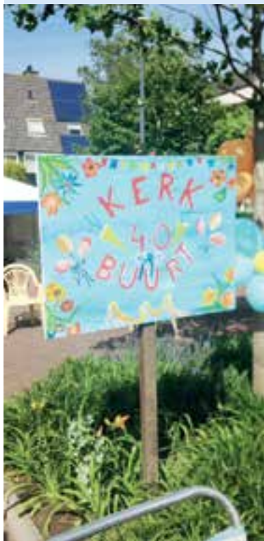
40 jaar Kerkbuurt: reden voor een feestje!