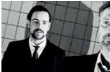
Voorstelling Harold Pinter in De Zwaan.

De Zwaan - Uitgeest Aanvang: 20.30 uur/15.00 uur Meer informatie: dorpshuisdezwaanuitgeest.nl & www.huisvantheater.nl.