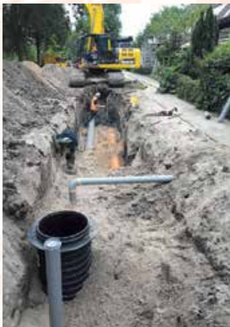
De werkzaamheden aan Park de Koog zijn gestart

Aannemer Kreeft Infra bv is gestart in het noorden van het park, op de Hartemaat. De werkzaamheden in fase 1 lopen tot aan de bouwvak vakantie (3 augustus). Tijdens de werkzaamheden in fase 1 kan gewoon gebruik worden gemaakt van de rest van het park. Na de bouwvak gaan we verder met de werkzaamheden in fase 2 en 3. Naar verwachting zijn de werkzaamheden medio oktober/november afgerond. Voor meer informatie ga naar www.uitgeest.nl/wijk-wonen/dekoog