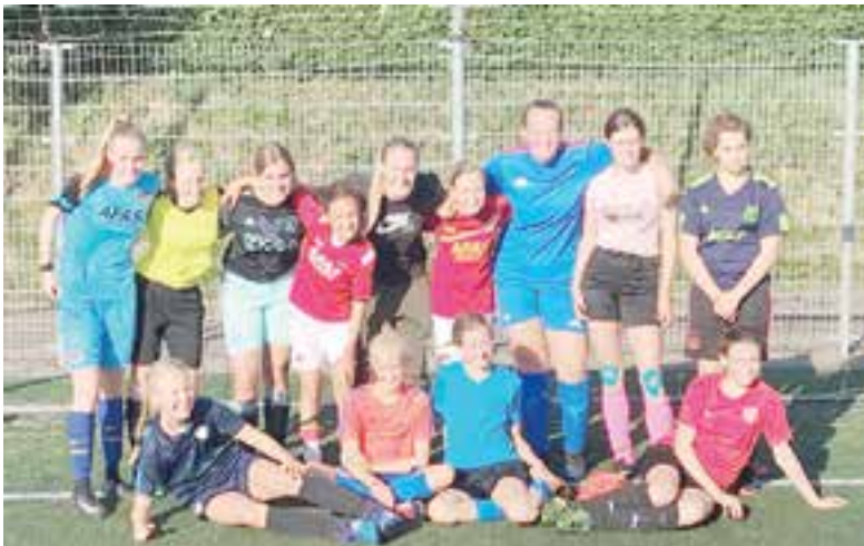
MO13 FC Uitgeest krijgt training van Stefanie van der Gragt.

Onder een strakblauwe lucht gaf Oranje leeuwint Stefanie van der Gragt, speelster van het Nederlands elftal, de meisjes training op het gebied van techniek en tactiek. Er werd hard en enthousiast getraind onder belangstelling van ouders en trainers. Het was voor de meisjes een leuke, leerzame en onvergetelijke avond. En mogelijk niet alleen een mooie afsluiting van dit seizoen, maar wie weet ook een goede start van het nieuwe seizoen.