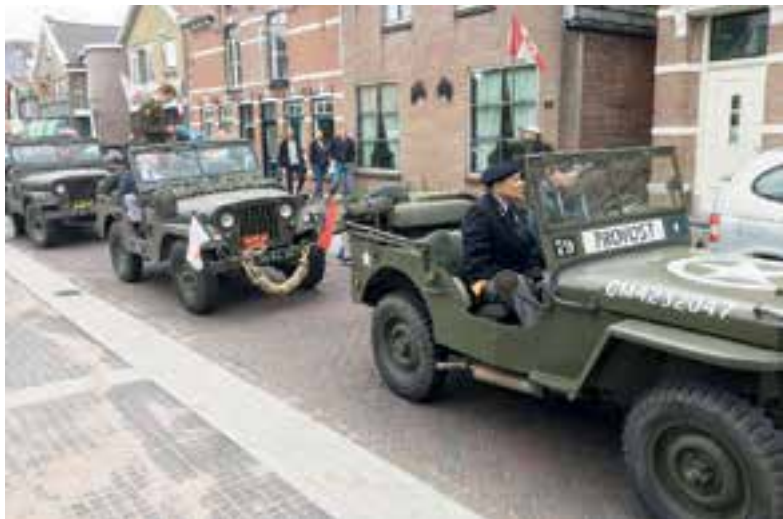
De legervoertuigen gingen in een optocht door Uitgeest naar Castricum.