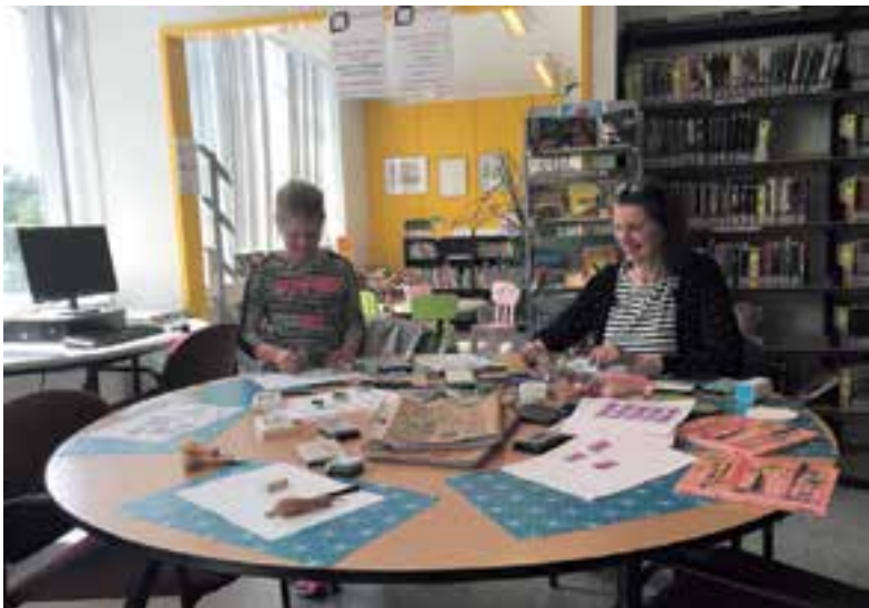
Workshop stempel maken tijdens de Kunstroute in het Lees Lokaal.

de haalbaarheid van de ambities een koppeling gemaakt moet worden tussen het realiseren van een school danwel scholen en woningbouw. Een belangrijke ontwikkellocatie is het stationsgebied. Hierbij is men het niet eens geworden om te onderzoeken of het nodig en wenselijk is om eventueel voorzieningen naar een andere centrale locatie te verplaatsen.