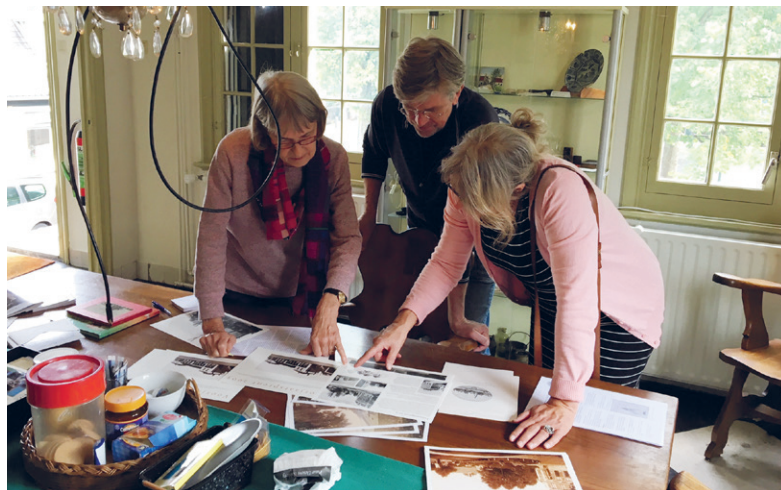
Veel belangstelling in het Regthuys waar bezoekers te woord werden gestaan door de vereniging oud-Uitgeest.