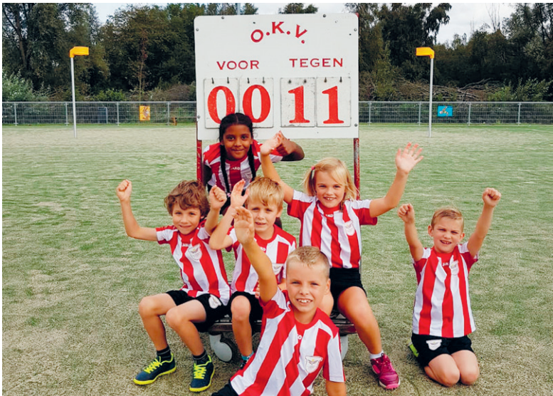
Jeugd Stormvogels deed dit weekend goede zaken.