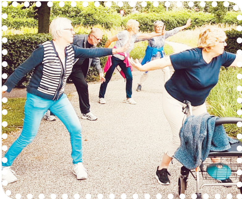
Training 'In Balans' helpt vallen voorkomen.

De cursus is bedoeld voor zelfstandig wonende senioren, die onzeker ter been worden of al eens zijn gevallen en daar wat aan willen doen! Meer weten? Kom naar de informatiebijeenkomst op maandag 24 september 2018, om 13.00 uur. Graag aanmelden via 0251-254161 of info@smc-ijmond.nl . SMC Uitgeest, Zienlaan 3 (oude de Opmaat).