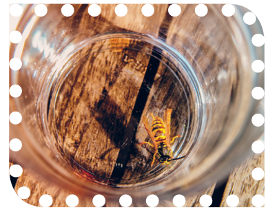
We hebben deze zomer veel last van wespen.

is er wel sprake van een allergische reactie. Je wordt dus ergens gestoken en op een andere plek van je lichaam treedt een reactie op. In aller-