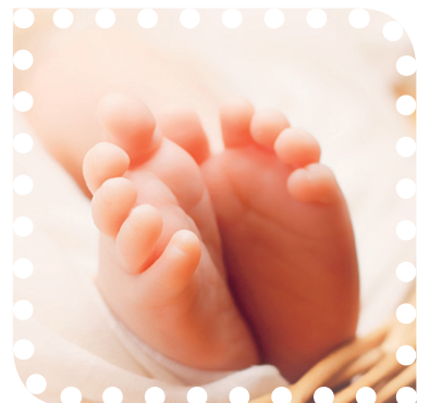
De meeste baby's komen gezond ter wereld.

"Het belangrijkste is om goed voor jezelf te zorgen. Eet gezonde voeding, rook niet, drink geen alcohol en gebruik geen drugs. Zorg dat je genoeg rust en slaap krijgt. Verder verkleint een gezond lichaamsgewicht de kans op complicaties bij moeder en kind. Maar de moeder kan natuurlijk niet alles voorkomen. Als de moeder de baby niet meer goed voelt bewegen of zich niet goed voelt, raden we altijd aan om contact op te nemen