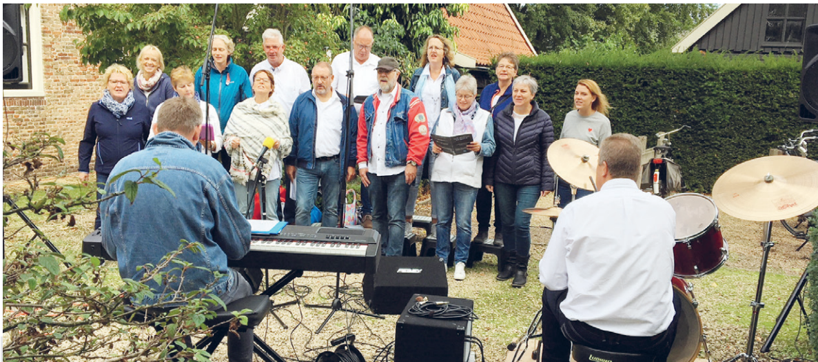
Recreation, het koor uit Heemskerk dat spontaan een optreden gaf.