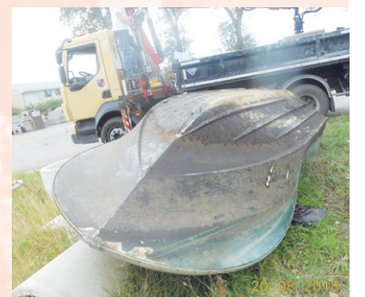
De verwijderde boot op de gemeentewerf