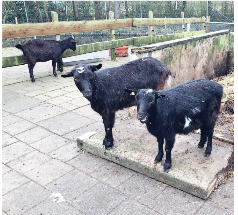
Stichting Hertenpark Uitgeest wordt volledig gerund door vrijwilligers.

gemiddeld tussen de 1.000 en 15.000 euro op, wat weer in de club gestoken kan worden. De verenigingen die meedoen zijn B.C. Castricum, Fusie Club Uitgeest, Gymnastiekvereniging Unitas, Jeugdvereniging Don Bosco, Korfbalvereniging Stormvogels, Loeka Dance Exp., MHC Uitgeest en Uitgeester Harmonie.