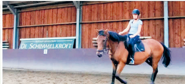
De Sportboulevard beweegt!