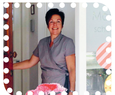
Mooier DAN viert jubileum.

Graag tot ziens bij Mooier DAN. Voor meer informatie: Mooier DAN, Kooglaan 70, 1911 TH Uitgeest. 06-12900228, www.mooierdan.nl , info@mooierdan.nl , facebook@mooierdanschoonheidssalon .