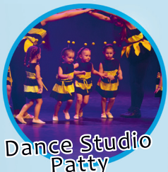
Dance Studio Patty

16 september 2018 vanaf 11.00 uur Kerkweg 217 t/m 225, Heemskerk