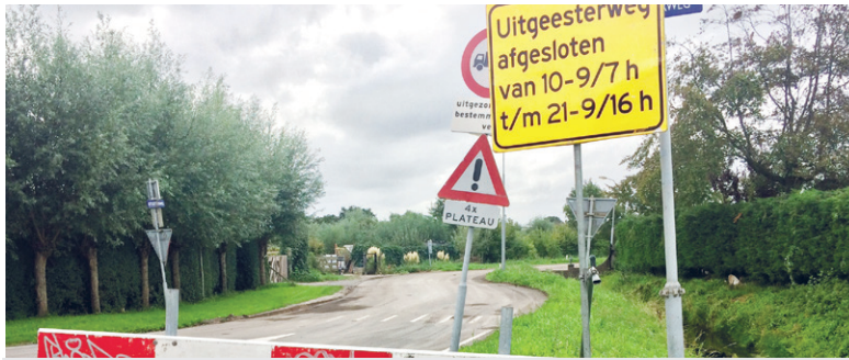
De weg is sinds maandag afgesloten voor al het verkeer.

De gemeente richt de weg en kruispunt opnieuw in. De aanleiding hiervoor zijn het vernieuwen van asfalt en het verbeteren van de verkeersveiligheid. De werkzaamheden zijn al begonnen maar sinds afgelopen maandag is de weg echt dicht. Er zijn een aantal omleidingsroutes. Auto- en fietsverkeer uit Limmen kunnen omrijden via Akersloot, hetzelfde geldt voor verkeer vanuit Uitgeest naar Limmen. Fietsverkeer naar Castricum of Limmen kan