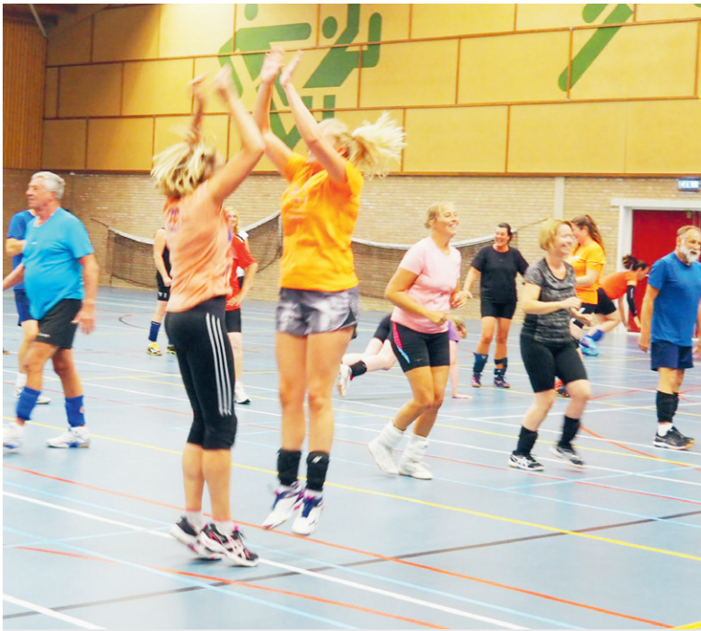
"Een goed begin is het halve werk".

de E-jeugd van 7-9 jaar wist een gelijkspel te halen. Een goede start voor deze jeugdige sporters. Vind jij het na het schoolkorfbal van afgelopen juni ook leuk om een keertje mee te komen trainen, kom dan geheel vrijblijvend eens langs op de donderdagavond tussen 18.30 en 20.00 uur op het sportterrein aan de Niesvenstraat.