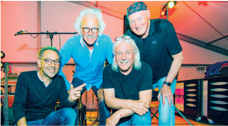
The Frogs Ltd in 't Portiertje Uitgeest.