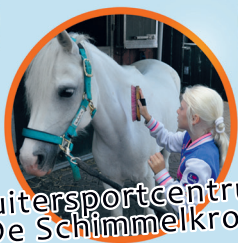
Ruitersportcentrum De Schimmelkroft