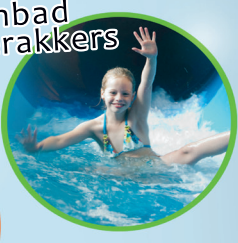
Zwembad de Waterakkers