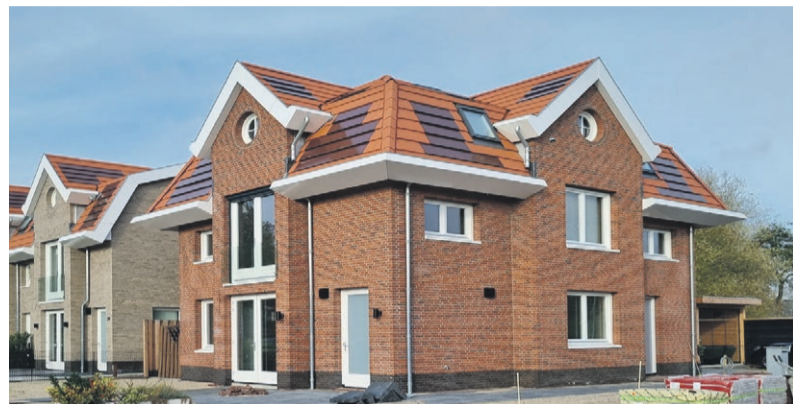
Ontwikkeling Oude Kruisweg, Cruquius Met geïntegreerde zonnepanelen in de dakpannen

Hieronder een kleine greep uit ons werk van de afgelopen twee jaren.