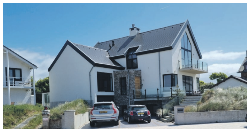
Villa Boulevard Paulus Loot, Zandvoort