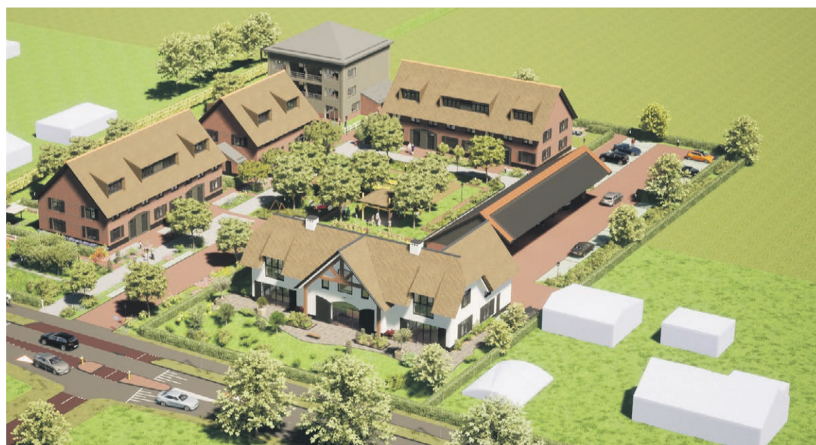
Planontwikkeling "wonen op de boerderij" Elisabeth Hoeve, Nieuw-Vennep Nieuwbouw van 17 woningen. Start verkoop oktober 2023

Wij vervullen de volgende werkzaamheden voor grote én kleine projecten: