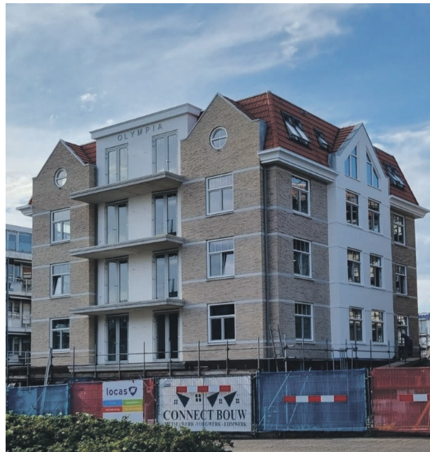
Appartementen Watertorenplein, Zandvoort

Optimalisatie van concept tot aan de sleutel. Door de intensieve samenwerking van architecten, bouwkundigen en ontwikkelaars binnen het eigen bedrijf en onderaannemers van buitenaf kan hoge kwaliteit binnen het budget gerealiseerd worden. Hierbij staat het architectonisch ontwerp te allen tijde centraal.