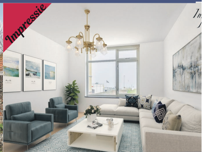
Van Galenstraat 120

Bezoek een van deze huizen tijdens de ERA Open Huizen Route tussen 11:00 en 15:00 uur! Vind je de woning leuk?