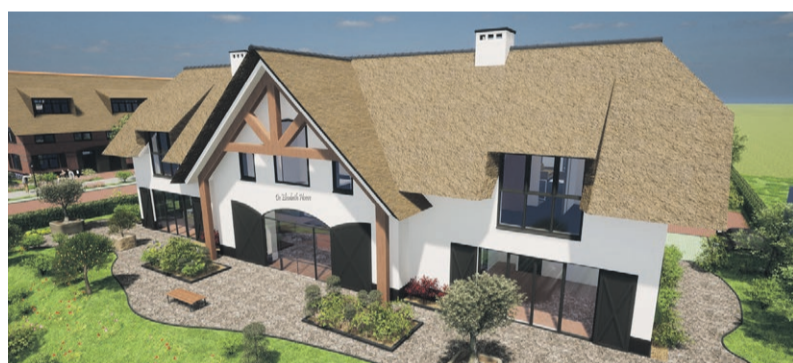
Villa Elisabeth Hoeve, Nieuw-Vennep