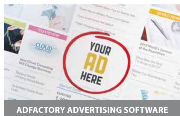
ADFACTORY ADVERTISING SOFTWARE