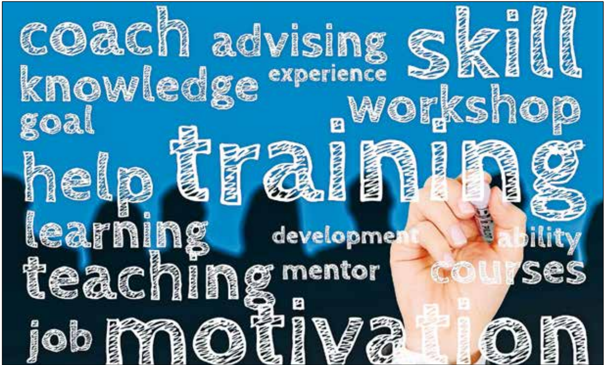
Hoe beter de kennis van Pubble, hoe vlotter de workflow.

kan? Daarom bieden we Pubble-workshops aan. Die zijn bedoeld voor Pubble-gebruikers die wat dieper in het programma willen