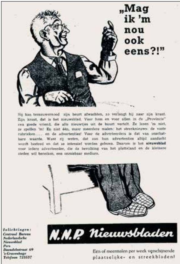
'Het nieuwsblad is voor iedere adverteerder, die de bevolking van het platteland en de steden wil bereiken, een onmisbaar medium'.