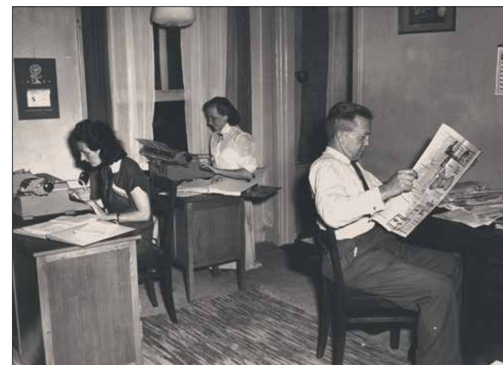
Blik op het NNP-kantoor in Den Haag. De medewerkers hadden de handen elke dag vol met het verwerken van alle post van en voor aangesloten nieuwswijden.