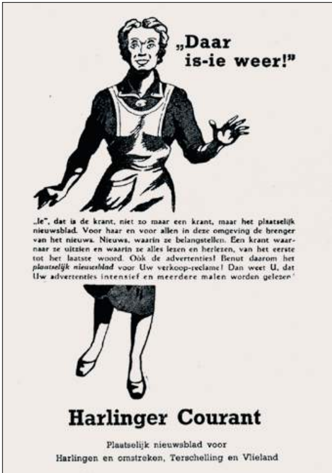
De Harlinger Courant werft adverteerders: 'Benut het plaatselijk nieuwsblad voor Uw verkoop-reclame!'. ■