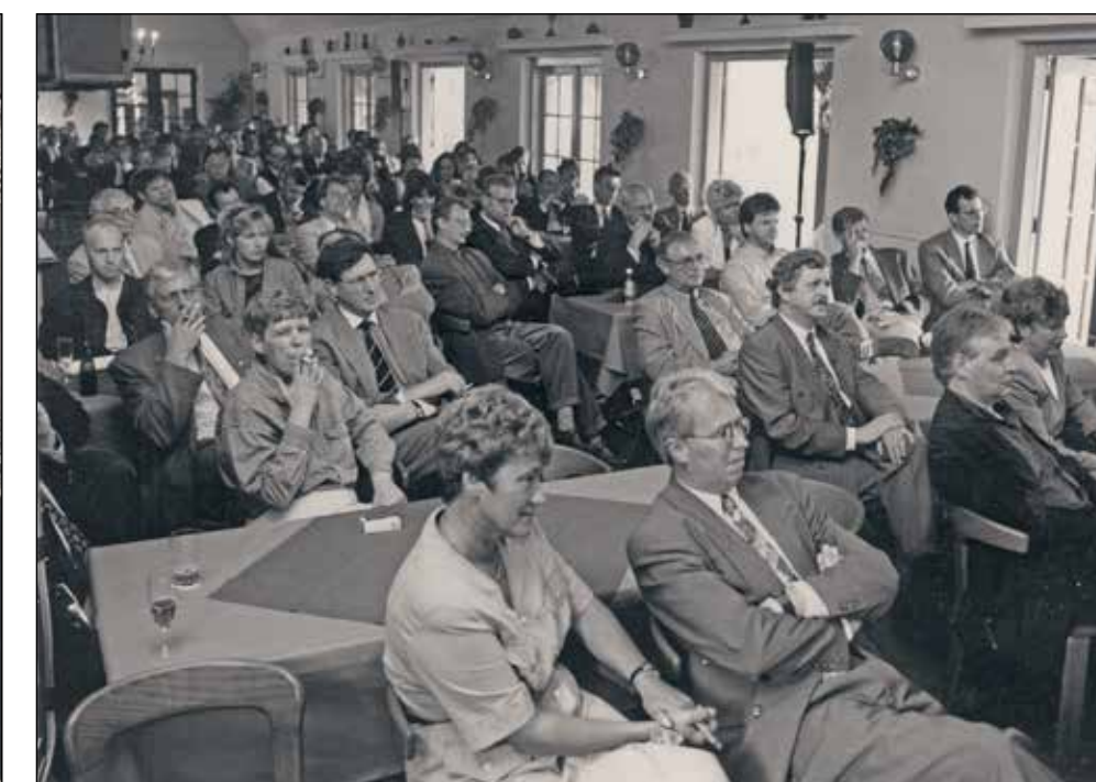
Impressie van de NNP-dag in Arnhem.