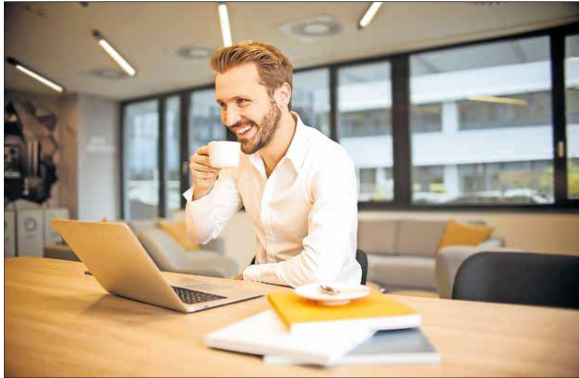
We hebben een dynamisch vak. Juist daarom is een efficiënte workflow van groot belang.

Optimaal gebruik Al sinds 2011 doet Pubble een