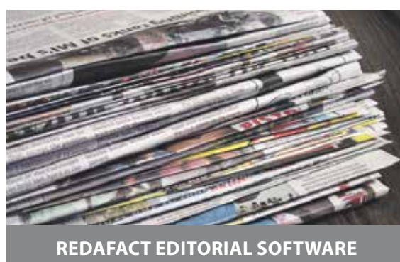
REDAFACT EDITORIAL SOFTWARE