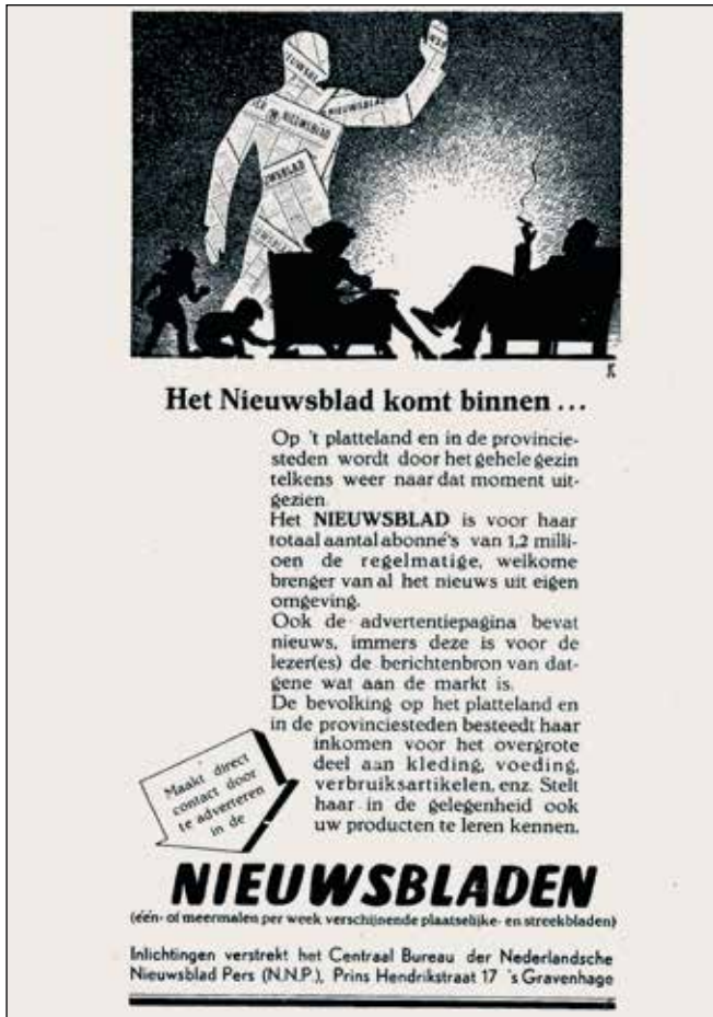
1948: de NNP voert campagne om adverteerders te werven voor nieuwsbladen. 'Het nieuwsblad komt binnen...'.