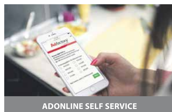
ADONLINE SELF SERVICE

Online advertentie- en redactioneel systeem met lokale opslag, voor snelle en vooral flexibele opmaak van uw blad.