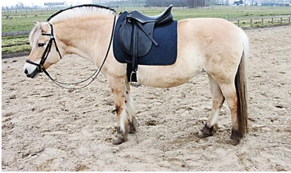
Een correct opgezadeld paard.

Om op te zadelen leg je eerst het zadel over je linkerarm en loop je naar de linkerkant van het paard. Je tilt dan het zadel over de rug heen en legt het zo neer dat het zadel iets op de schoft ligt. Leg uiteraard wel zachtjes het zadel neer zodat je paard niet schrikt. Als het zadel ligt dan trek je het een beetje naar achteren zodat de haren onder het