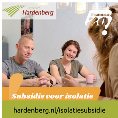
Subsidie voor isolatie

Hebt u vragen over de subsidie voor isolatie? Neem dan contact op met provincie Drenthe via 0592-365555 of via post@drenthe.nl met als onderwerp: isolatiesubsidie.