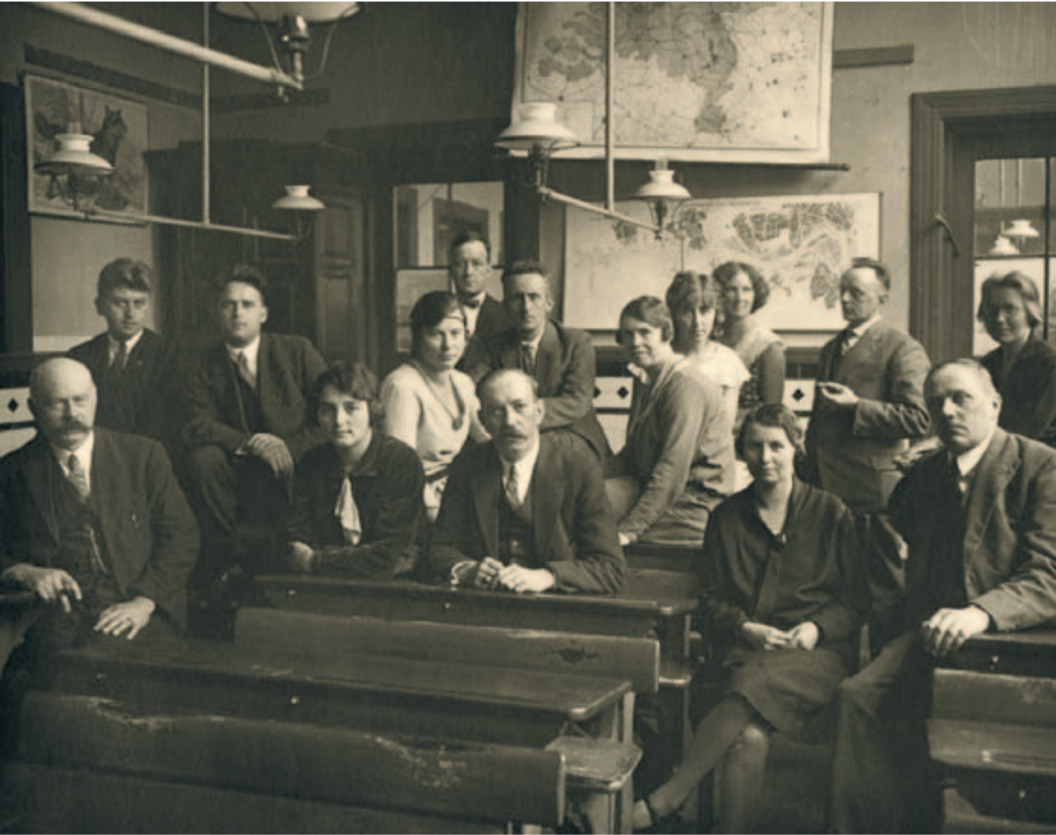
Onderwijzend personeel in een klaslokaal, circa 1925–1939. Het team telt 8 onderwijzers en 7 onderwijzeressen.

De professionalisering van het vak hielp het imago wel wat, maar tegelijkertijd moesten onderwijzers erg hun best doen om op een goede manier over te komen. In zijn boek De gelukkige klas (1926), beschrijft Theo Thijssen hoe hij zichzelf en het onderwijzersvak zag. ‘Hij en zijn tijdgenoten zoals bijvoorbeeld W.G. van de Hulst, hadden duidelijke ideeën over waartoe de onderwijzer op aarde was. Ze droegen een missie uit en waren daar trots op.’ Dat is ook terug te zien op beeldmateriaal uit die tijd, bijvoorbeeld op de foto die gemaakt is bij het afstuderen van Thijssen aan de kweekschool in Haarlem. ‘De jongens zitten allemaal met een net pak aan een tafel waarop een stapel boeken is uitgestald. Dat moest wijsheid