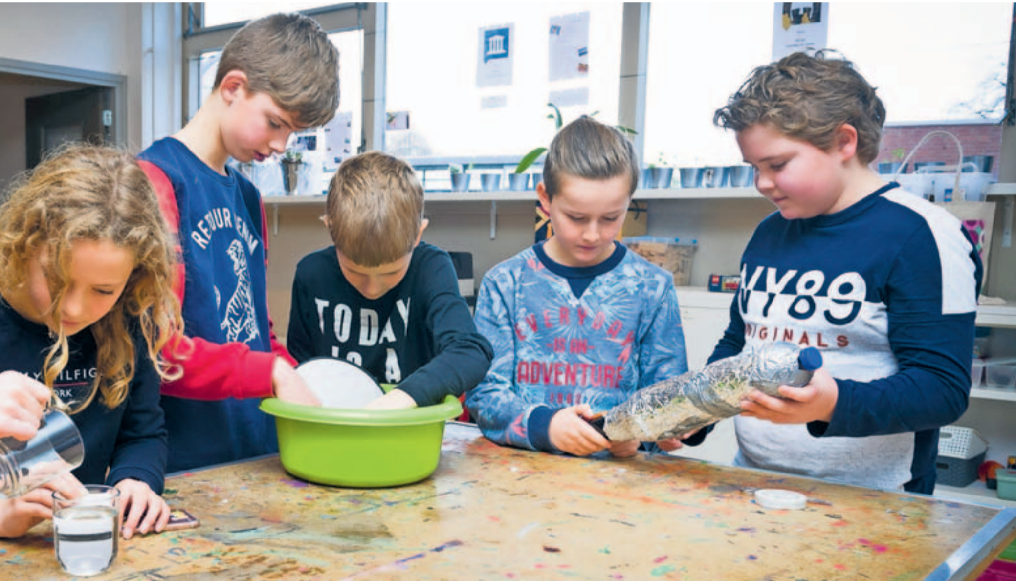
Leren door doen op de LeerOnderneming van het Gemini College in Ridderkerk.

klassiek onderwijs, moet een draai in zijn hoofd maken. Er zijn geen traditionele klassen meer met leraren ervoor, maar jaarlagen waarin leerlingen van dezelfde leeftijd bij elkaar zitten. Er worden geen lessen gegeven. Dat zou te